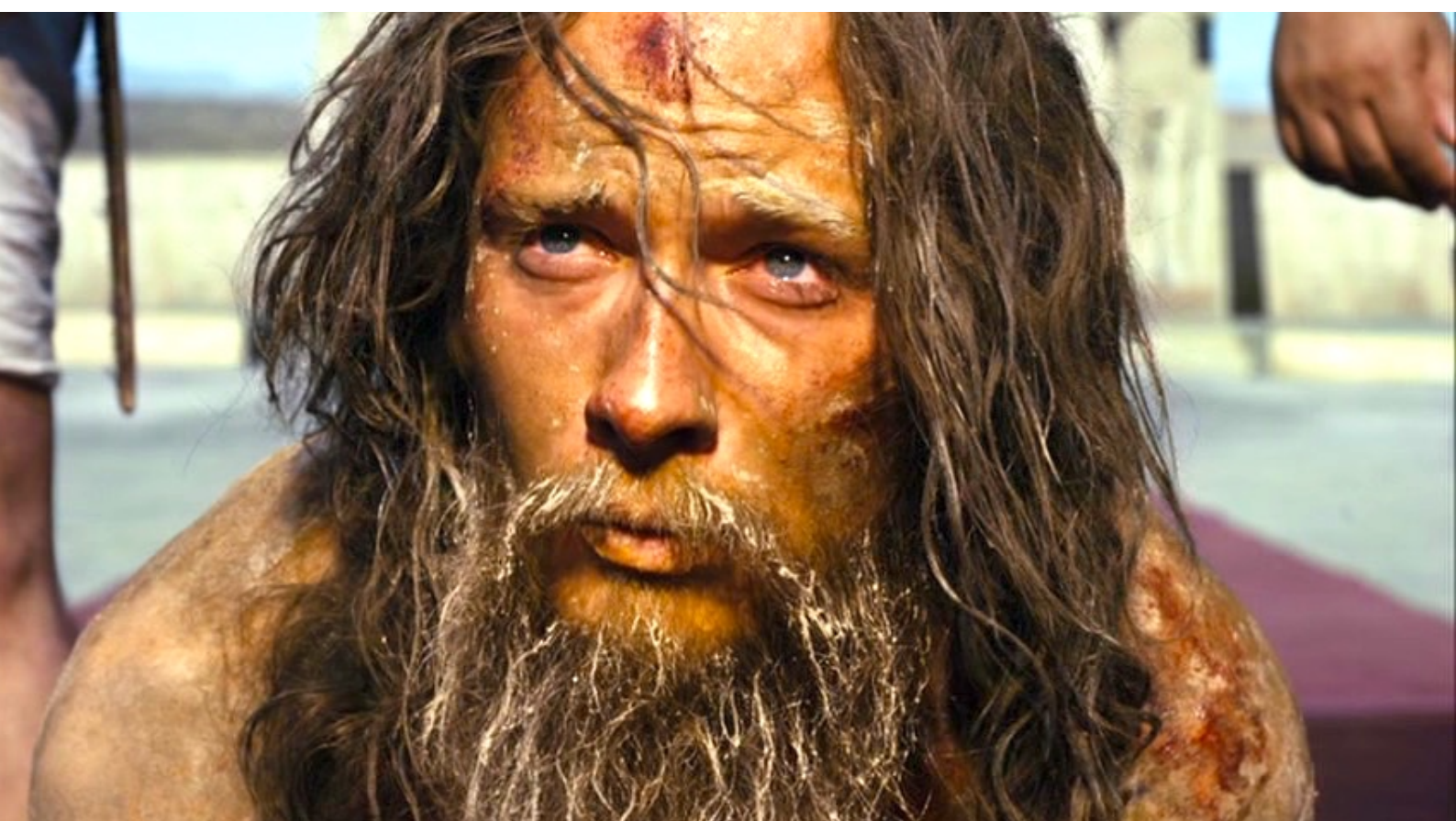
The Red Tent : ... et, en lui expliquant ses rêves, se gagne les faveurs du roi,