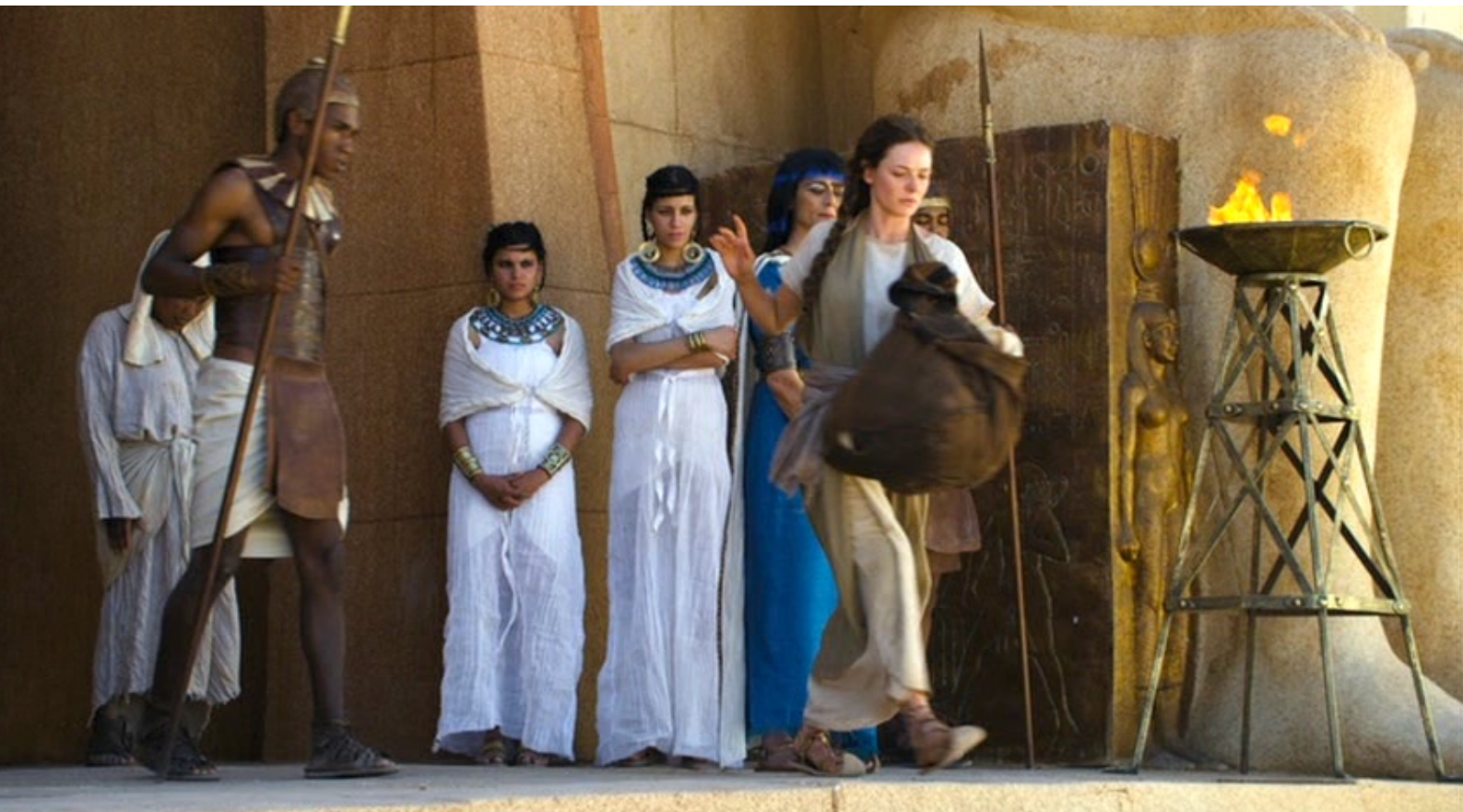
The Red Tent : Puis Dina est chassée du palais par sa belle-mère...