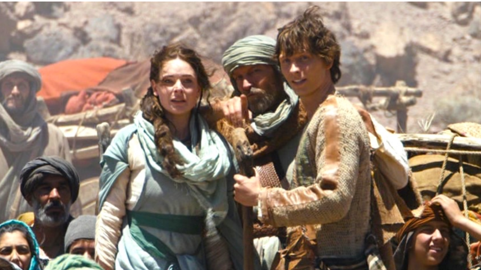
The Red Tent : À l'approche de Sichem, Dina voit pour la première fois de sa vie une ville,

Comme cinquième portfolio du numéro 48 de La 12 e Heure , nous vous offrons dans la présente annexe la suite du petit florilège de photos tirées du télépéplum The Red Tent , dont nous avons parlé dans notre dossier sur cette œuvre (captures d'écran de Claude Aubert).