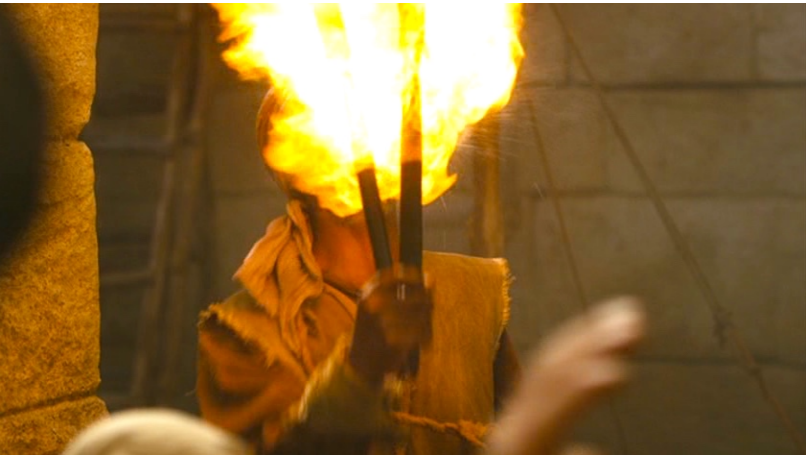
The Red Tent : voit, émerveillée, un cracheur de feu,