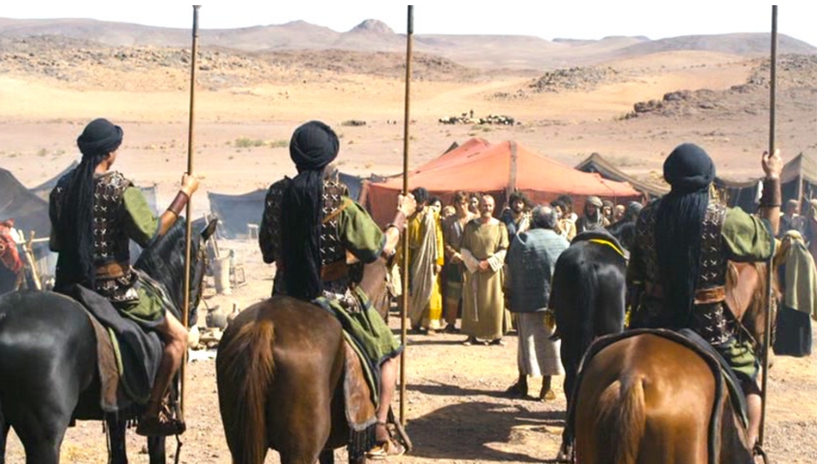
The Red Tent : et se rend auprès du père de Dinah...