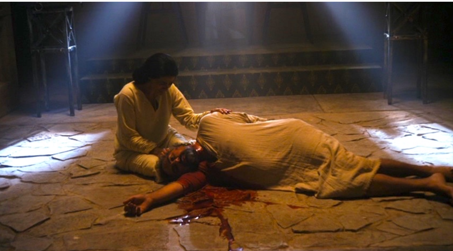
The Red Tent : et n'épargnent même pas le vieux roi Hamor.