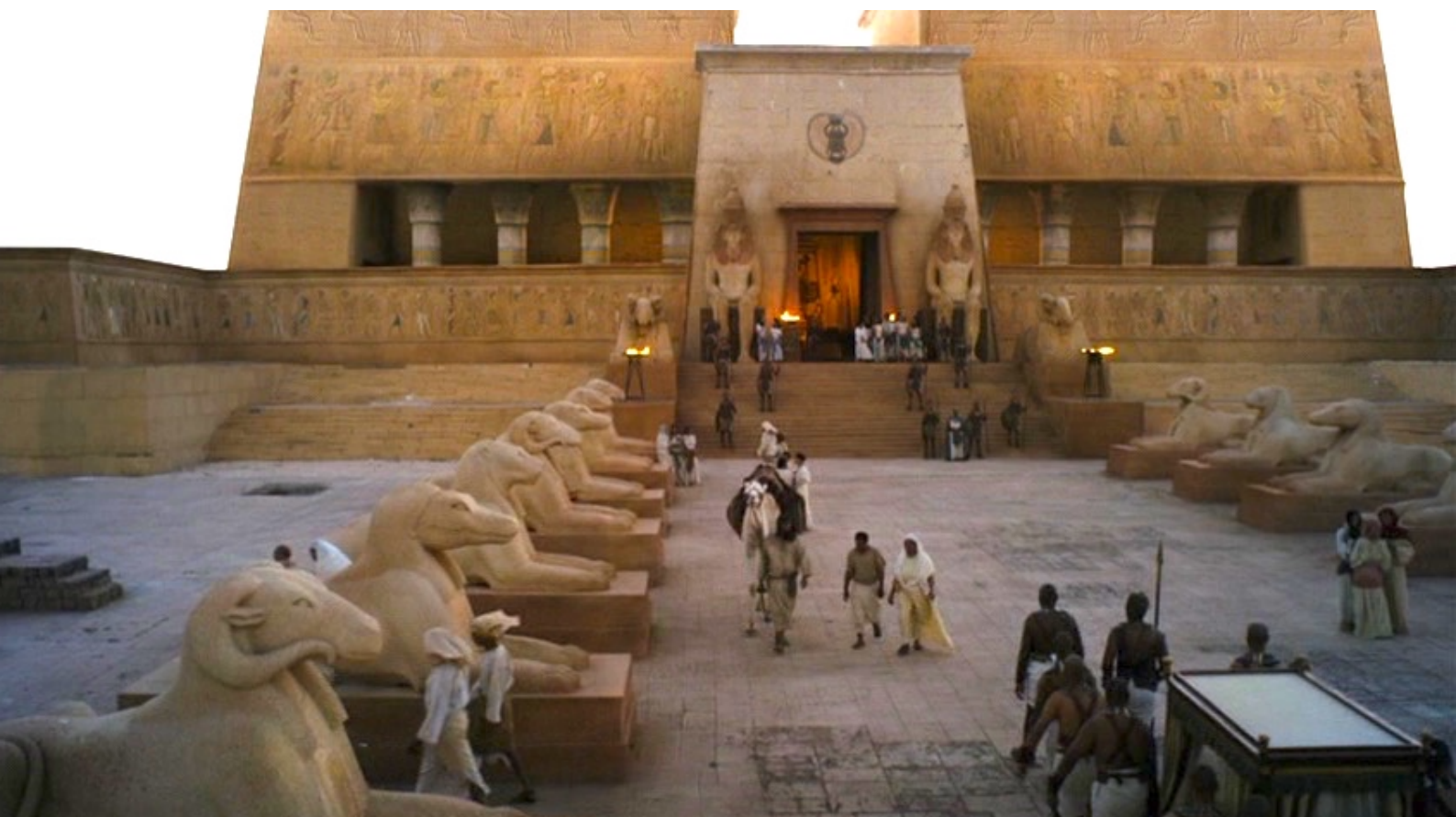
The Red Tent : elles arrivent devant le palais du frère de Re-Nefer...