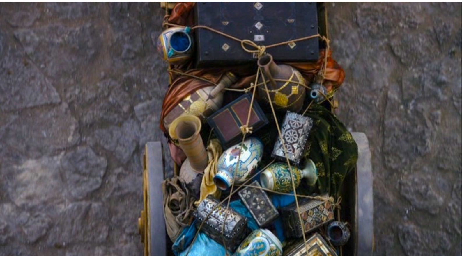
The Red Tent : afin de lui offrir une riche dot.