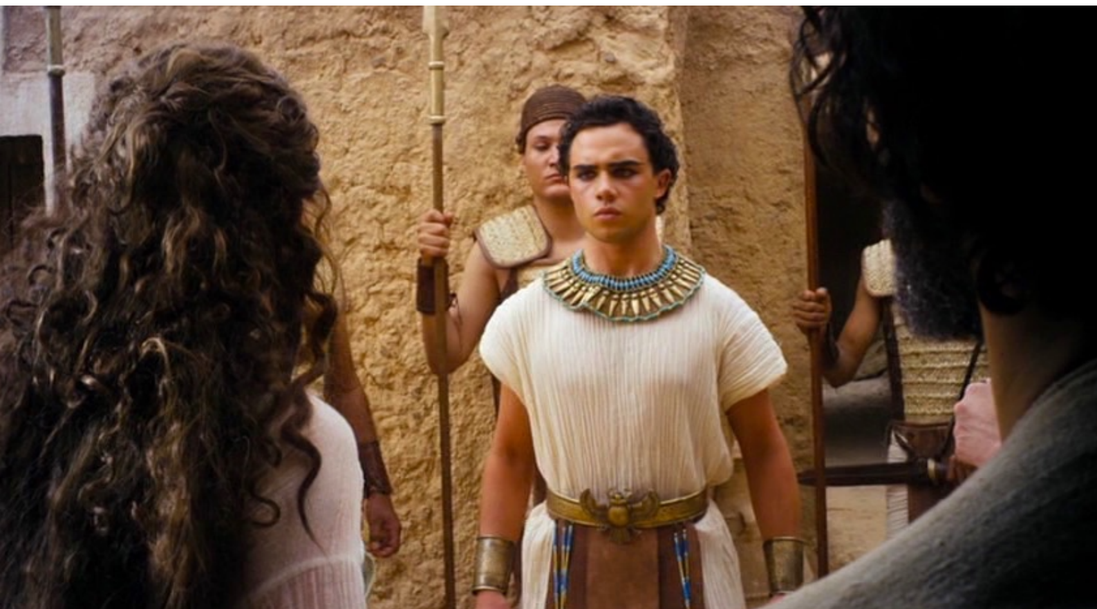
The Red Tent : ... qui se révèle être Re-Mose, le fils unique de Dina.