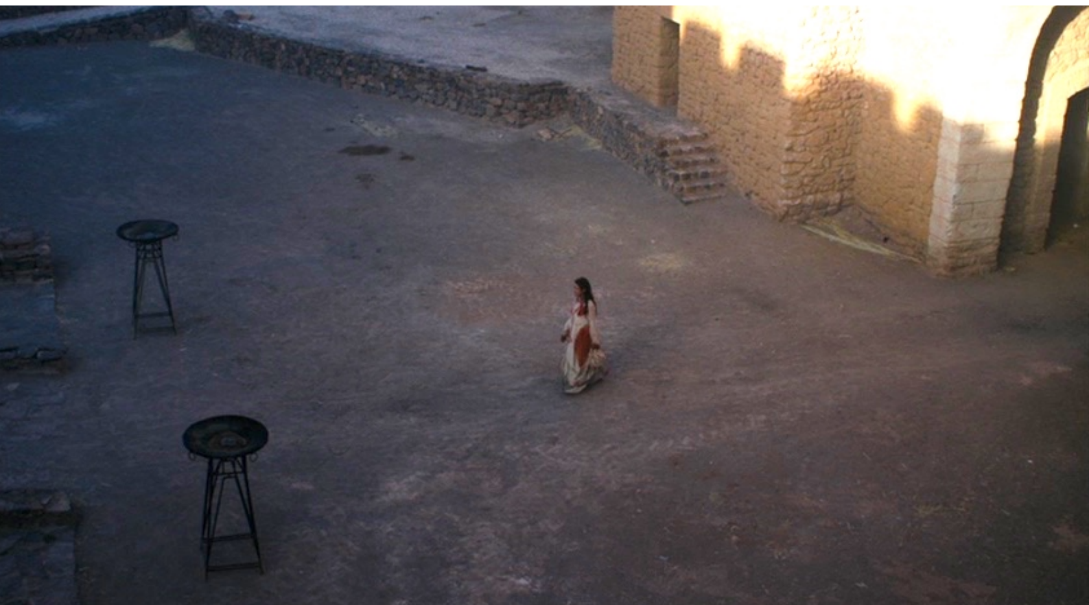
The Red Tent : Revenant à Sichem déserte, elle se livre au désespoir,