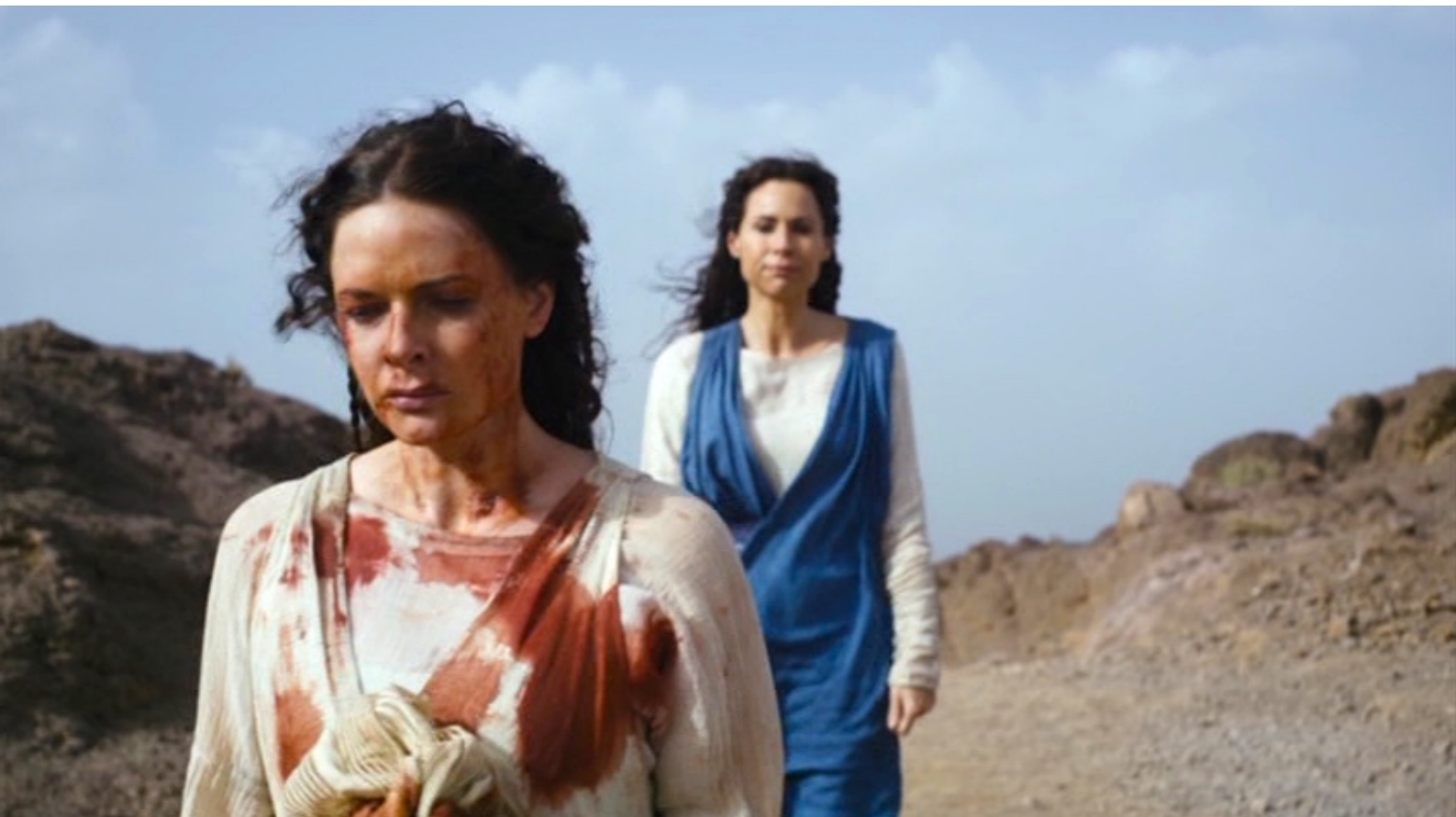
The Red Tent : ... et décide de quitter sa tribu et même sa mère.