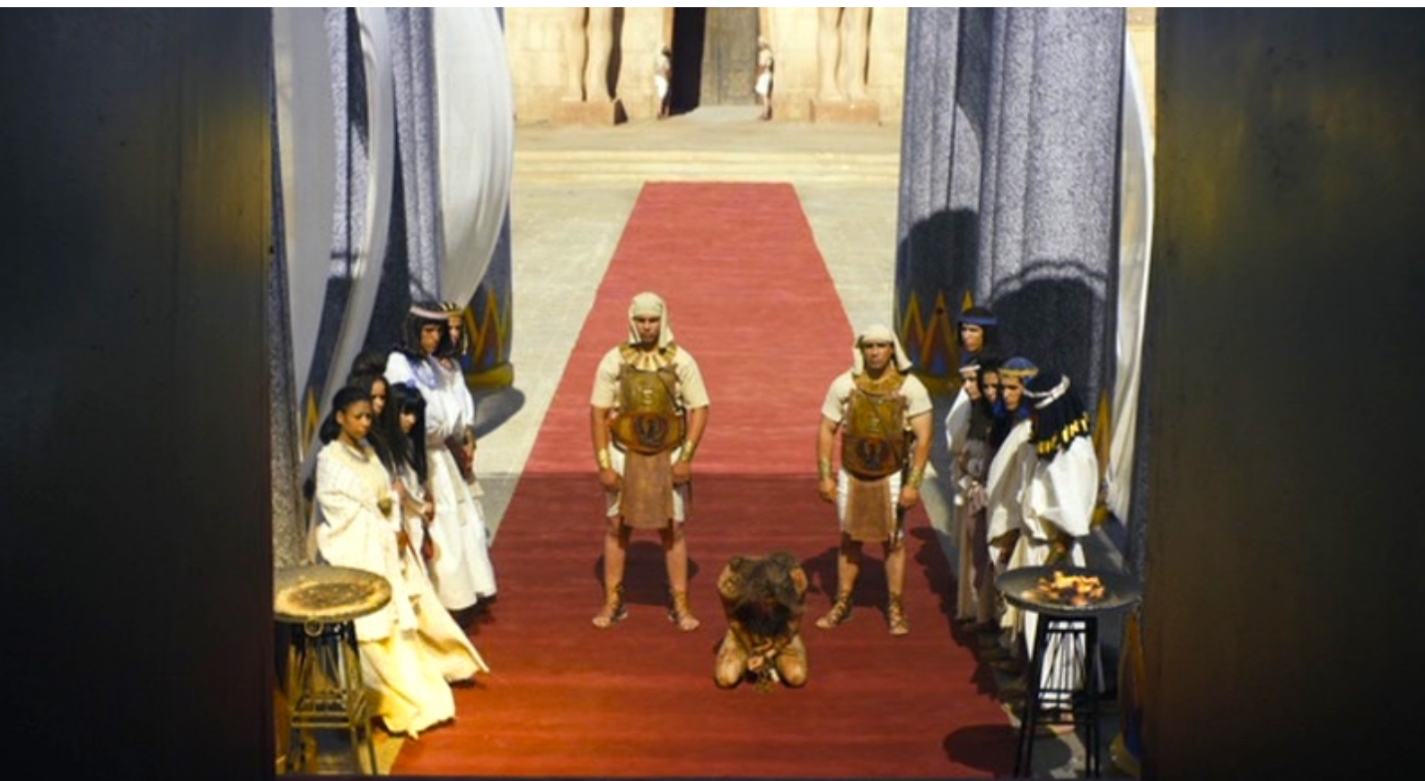
The Red Tent : Entre-temps, son frère Joseph, prisonnier, est amené devant Pharaon...