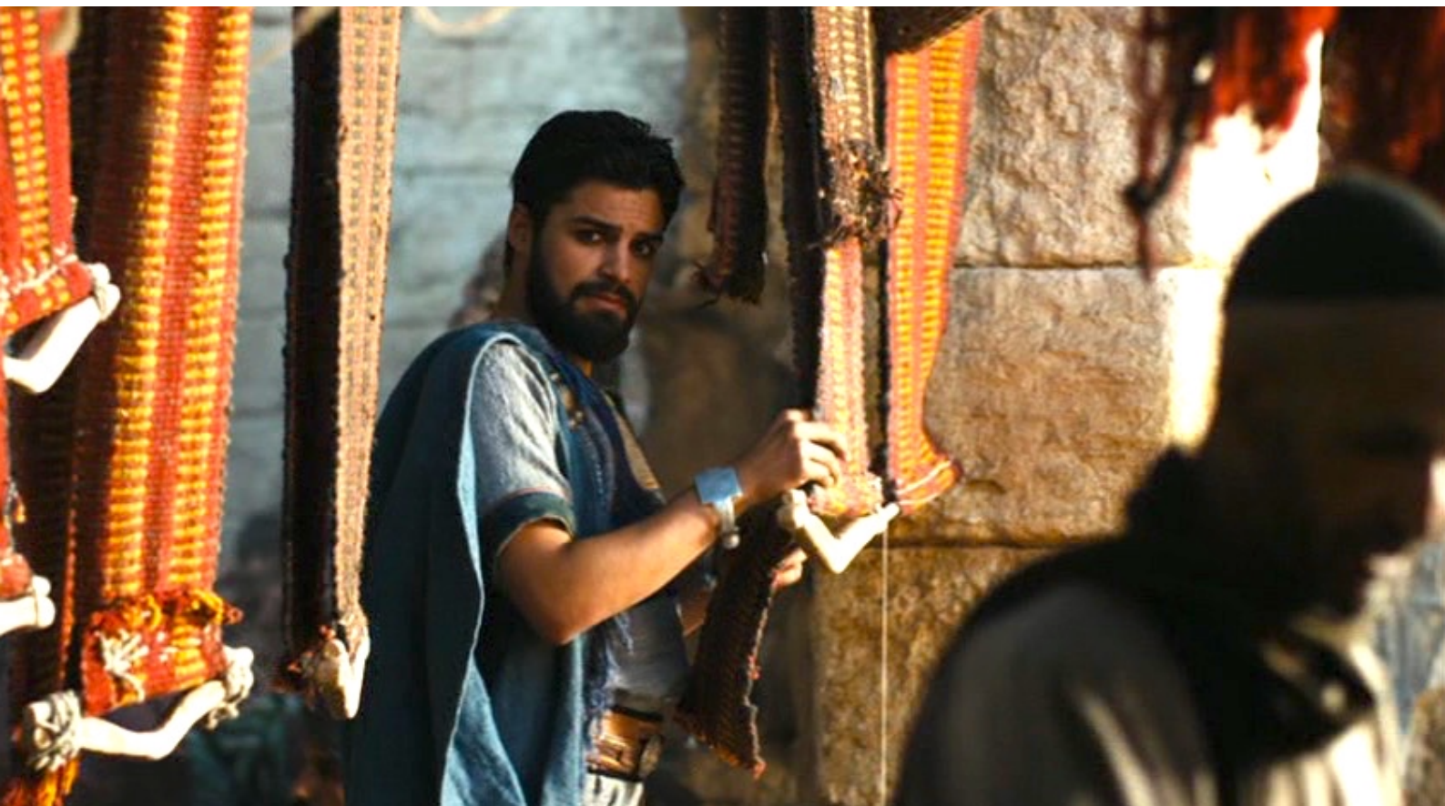
The Red Tent : et qui se révélera être Shalem, le prince héritier du royaume.