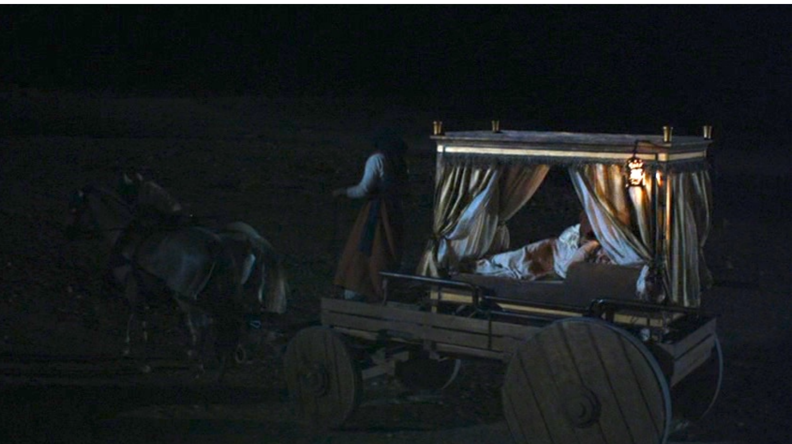
The Red Tent : cheminant nuit et jour pour échapper aux assassins.