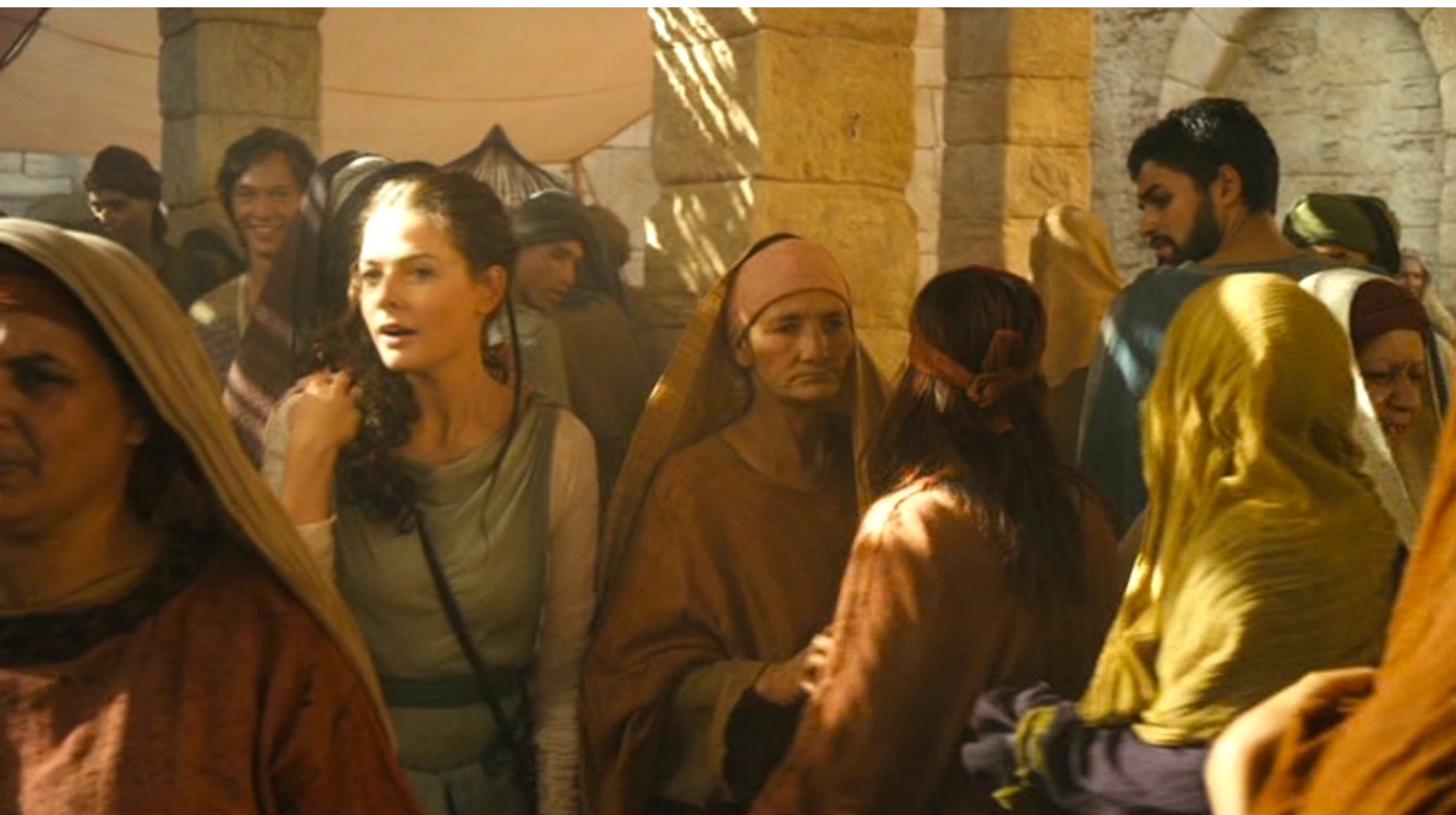
The Red Tent : Elle s'y rend avec ses tantes,