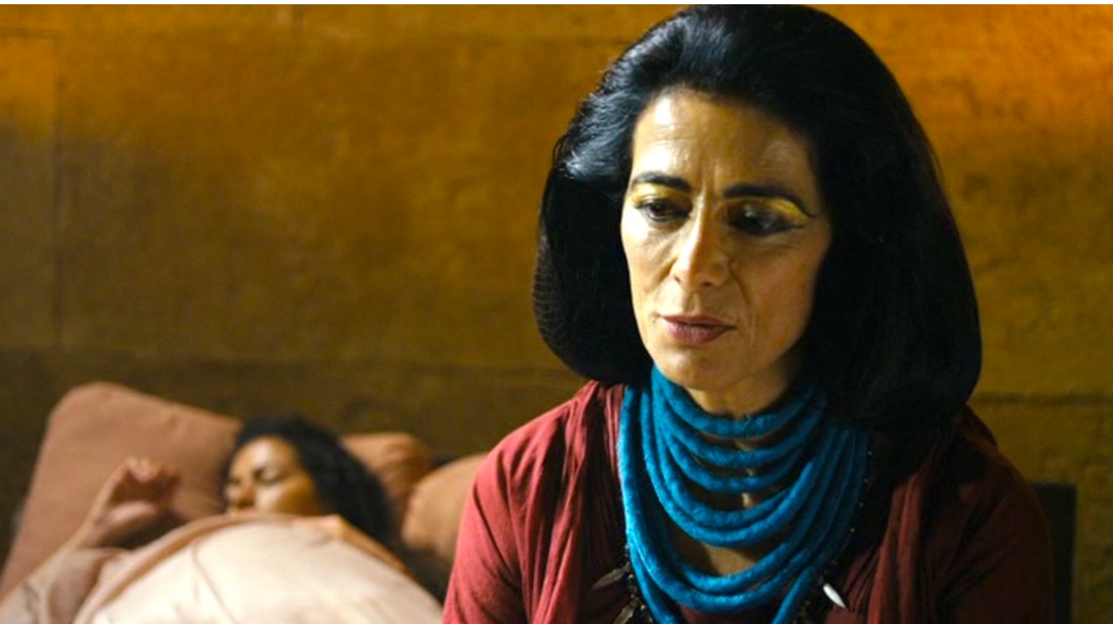
The Red Tent : La reine Re-Nefer a assisté à l'accouchement...