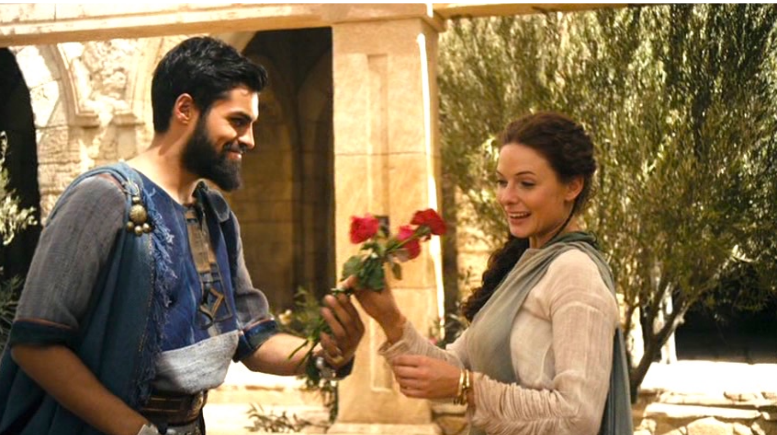
The Red Tent : ... et dont elle reçoit des fleurs.