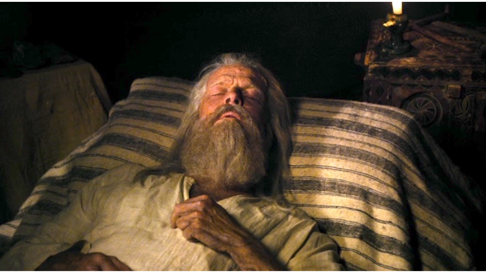
The Red Tent : leur père, très vieux, gâteux et mourant,