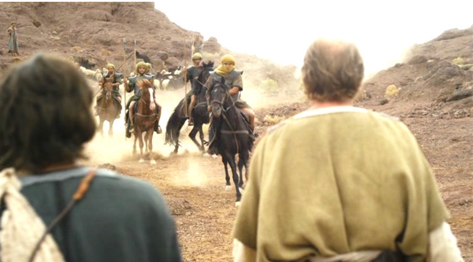
The Red Tent : Peu après, des envoyés du roi Hamor viennent quérir des sages-femmes,