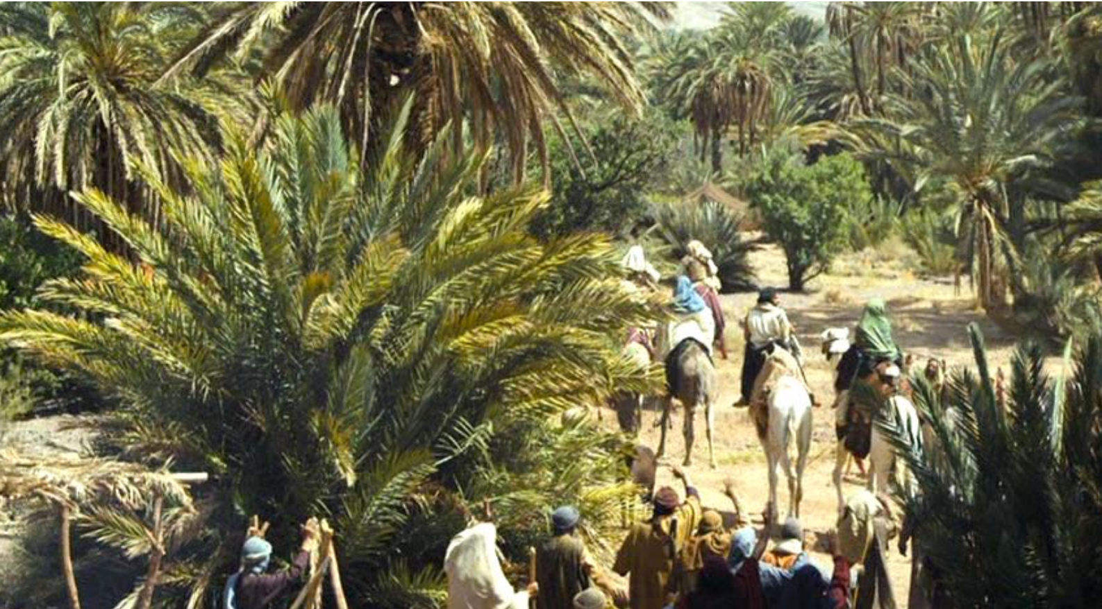
The Red Tent : puis, après son décès, décident de repartir pour l'Égypte.