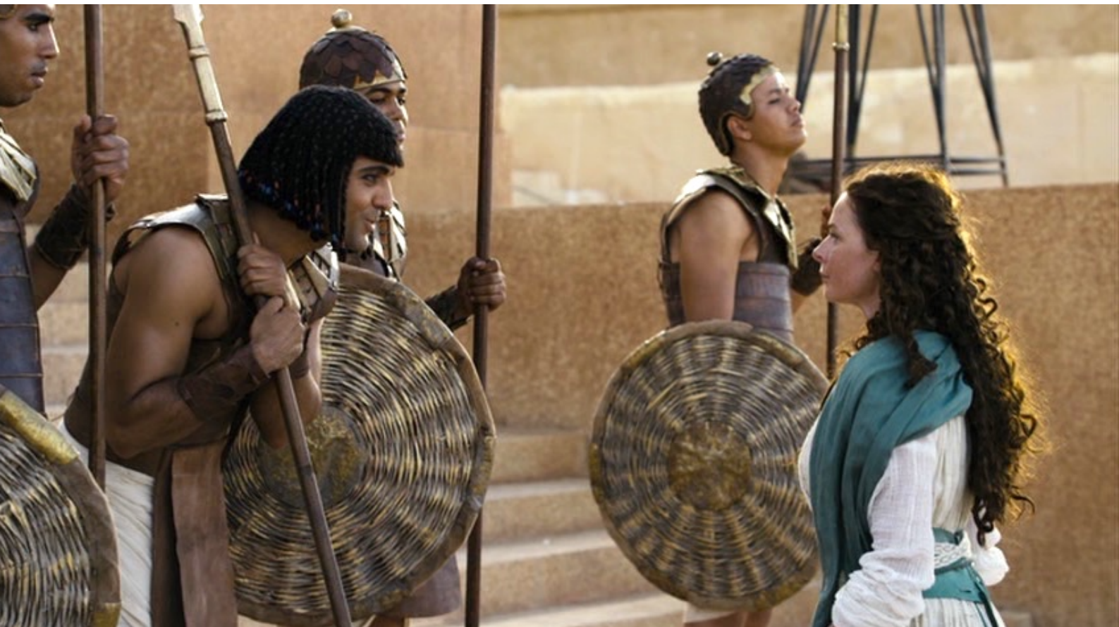
The Red Tent : ... et va périodiquement au palais demander si Re-Mose est revenu.