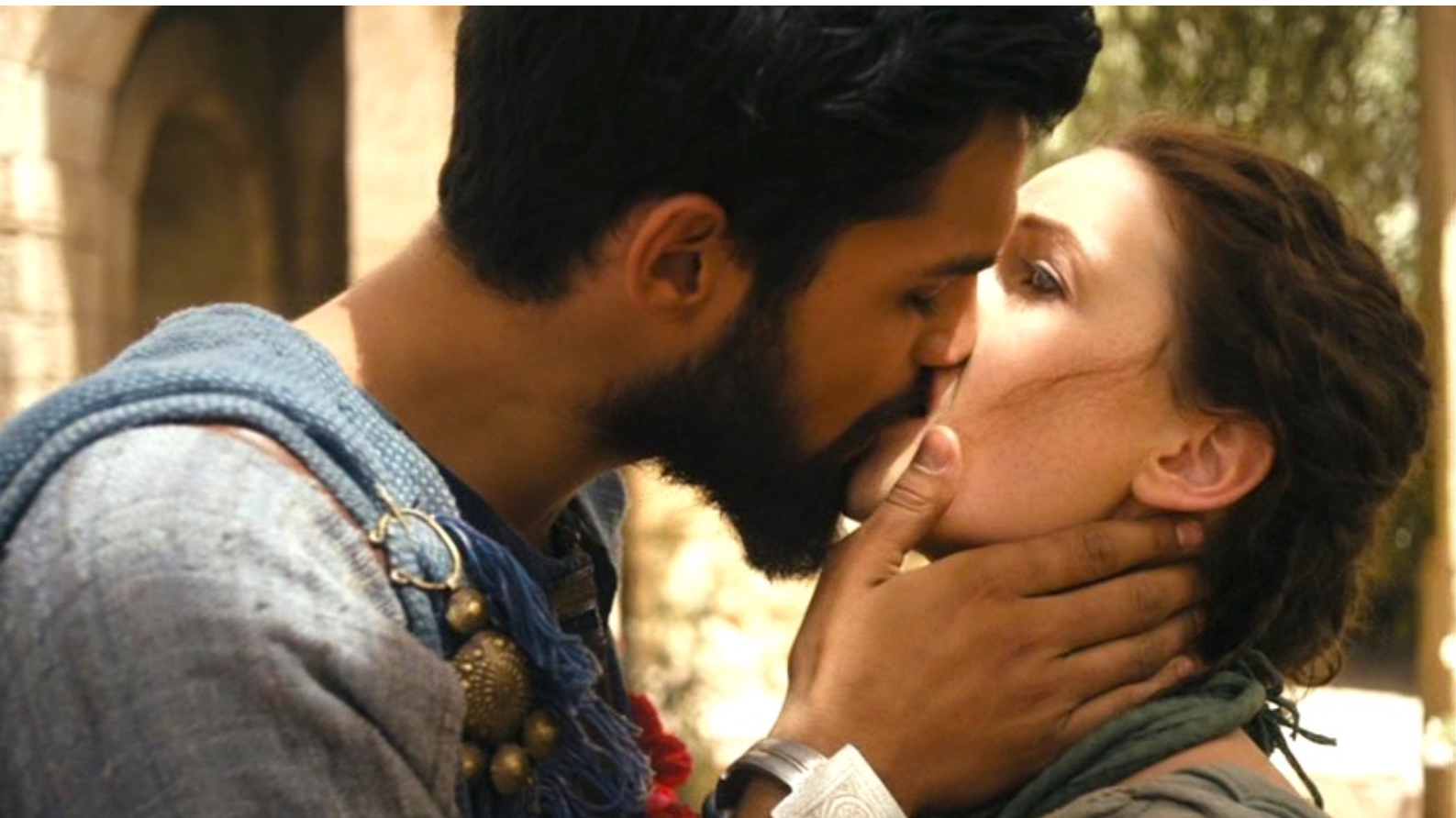
The Red Tent : Ils tombent follement amoureux l'un de l'autre...