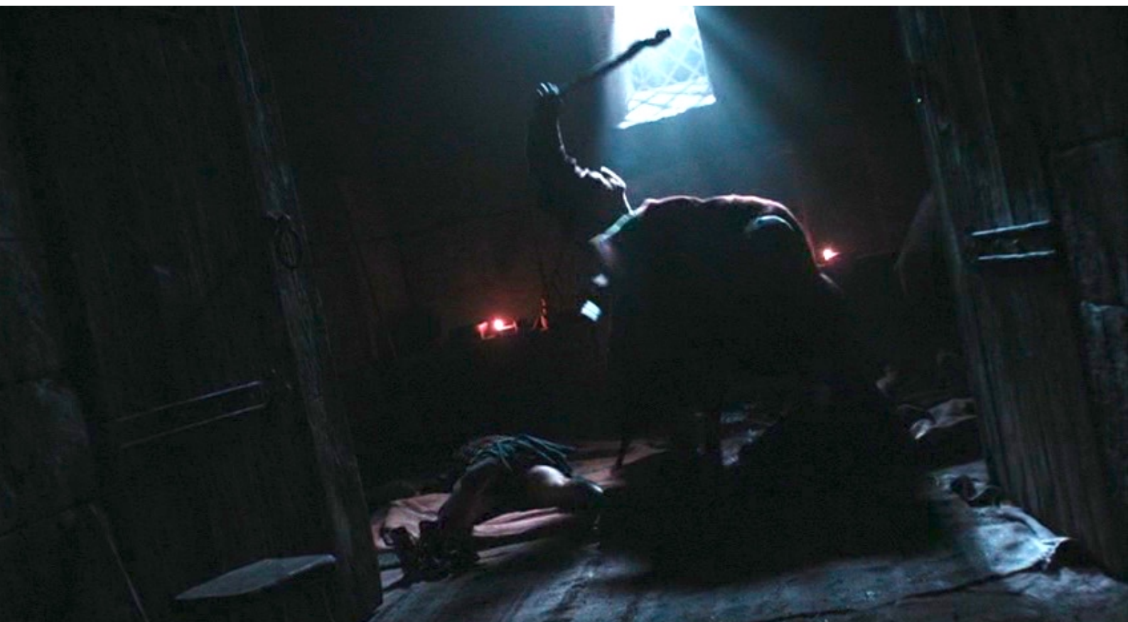
The Red Tent : bastonnent,