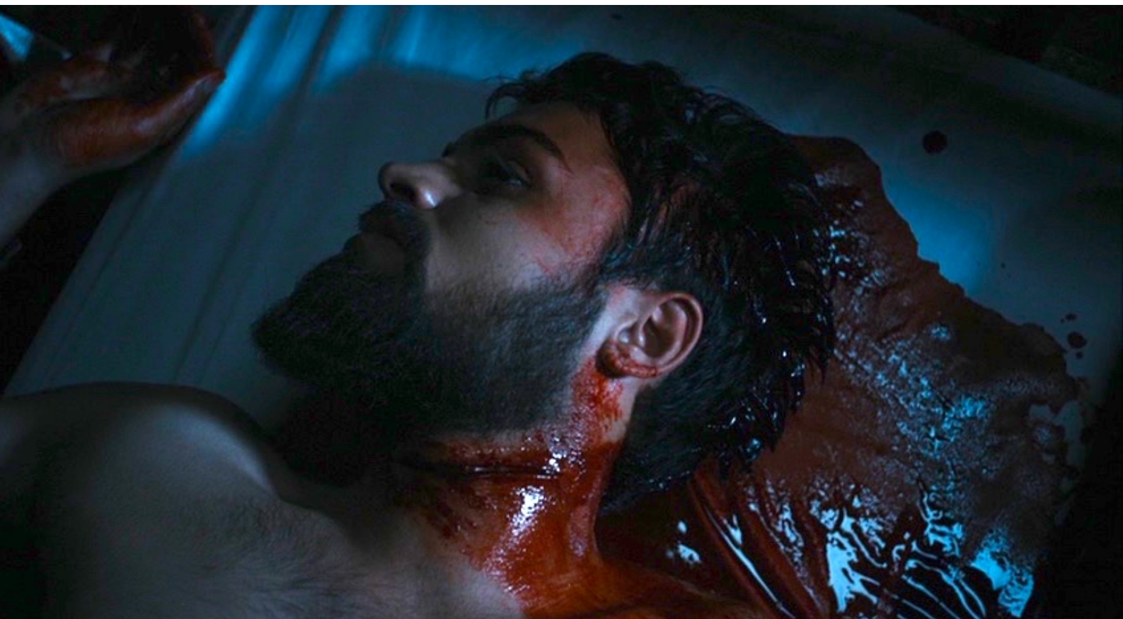
The Red Tent : tuent Shalem, le mari de Dina,