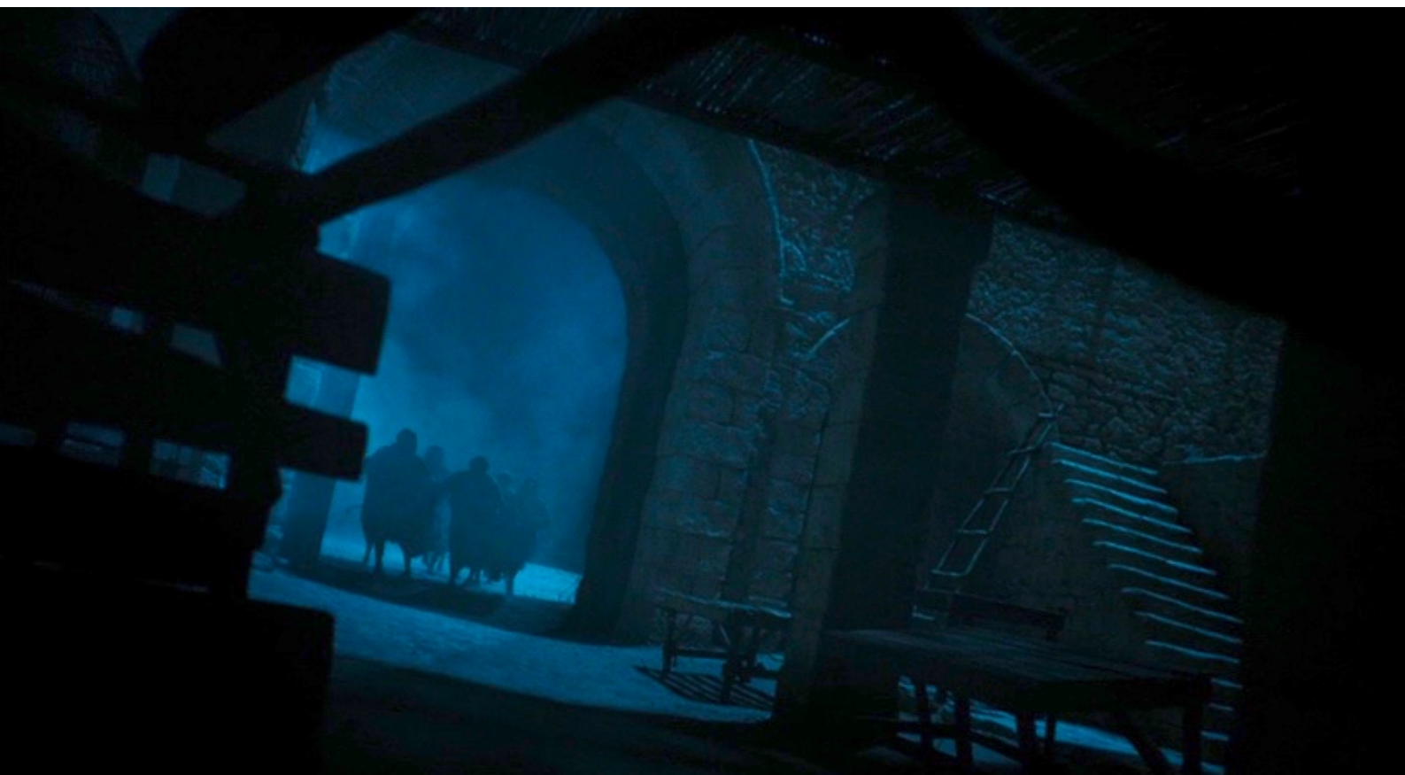
The Red Tent : Profitant de l'affaiblissement des Sichemites, Lévi et Siméon, avec quelques bergers,