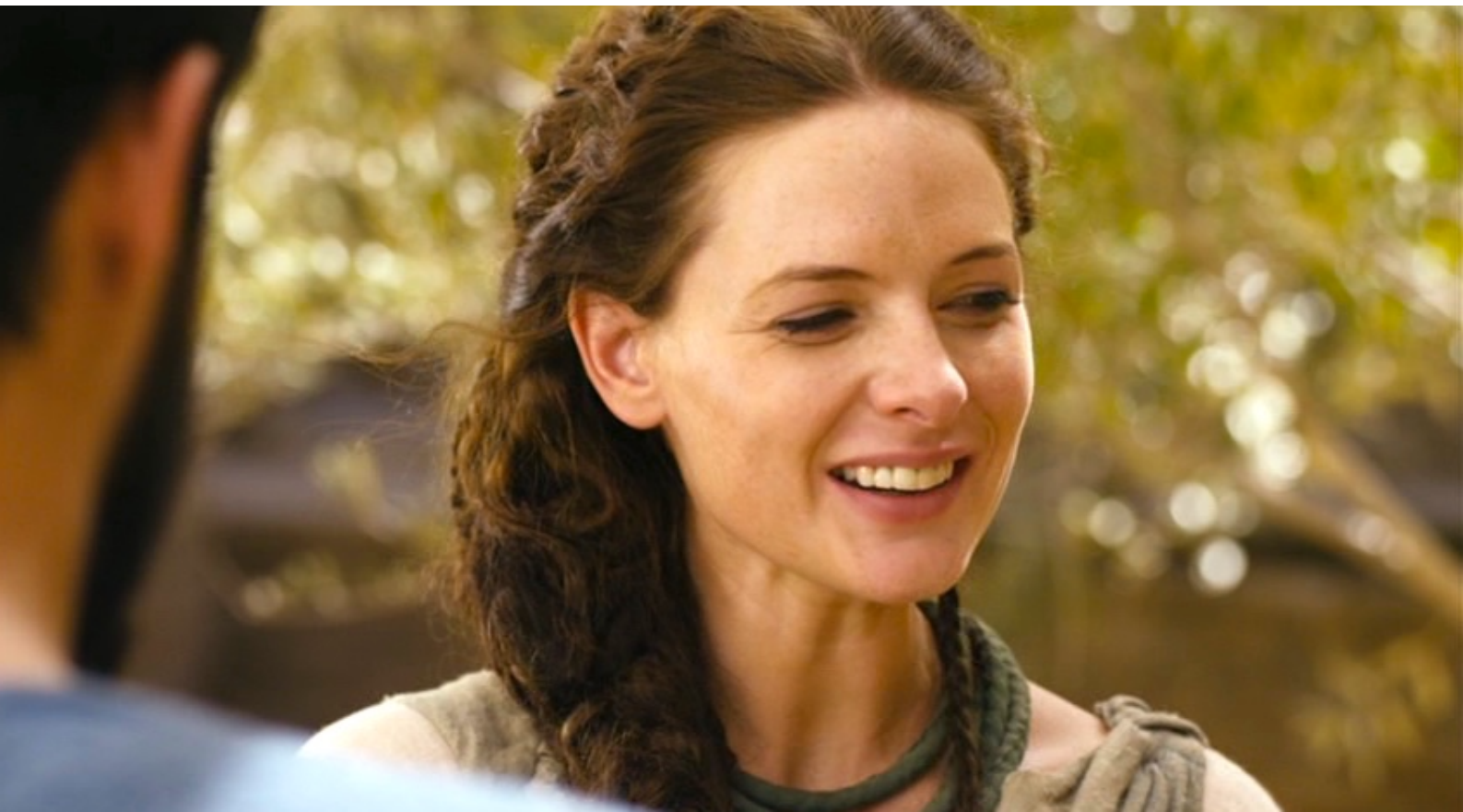
The Red Tent : dont elle apprécie les compliments...