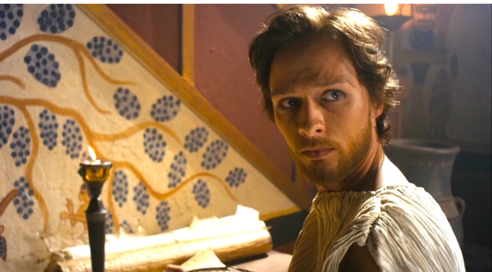
The Red Tent : devenant ainsi grand vizir.