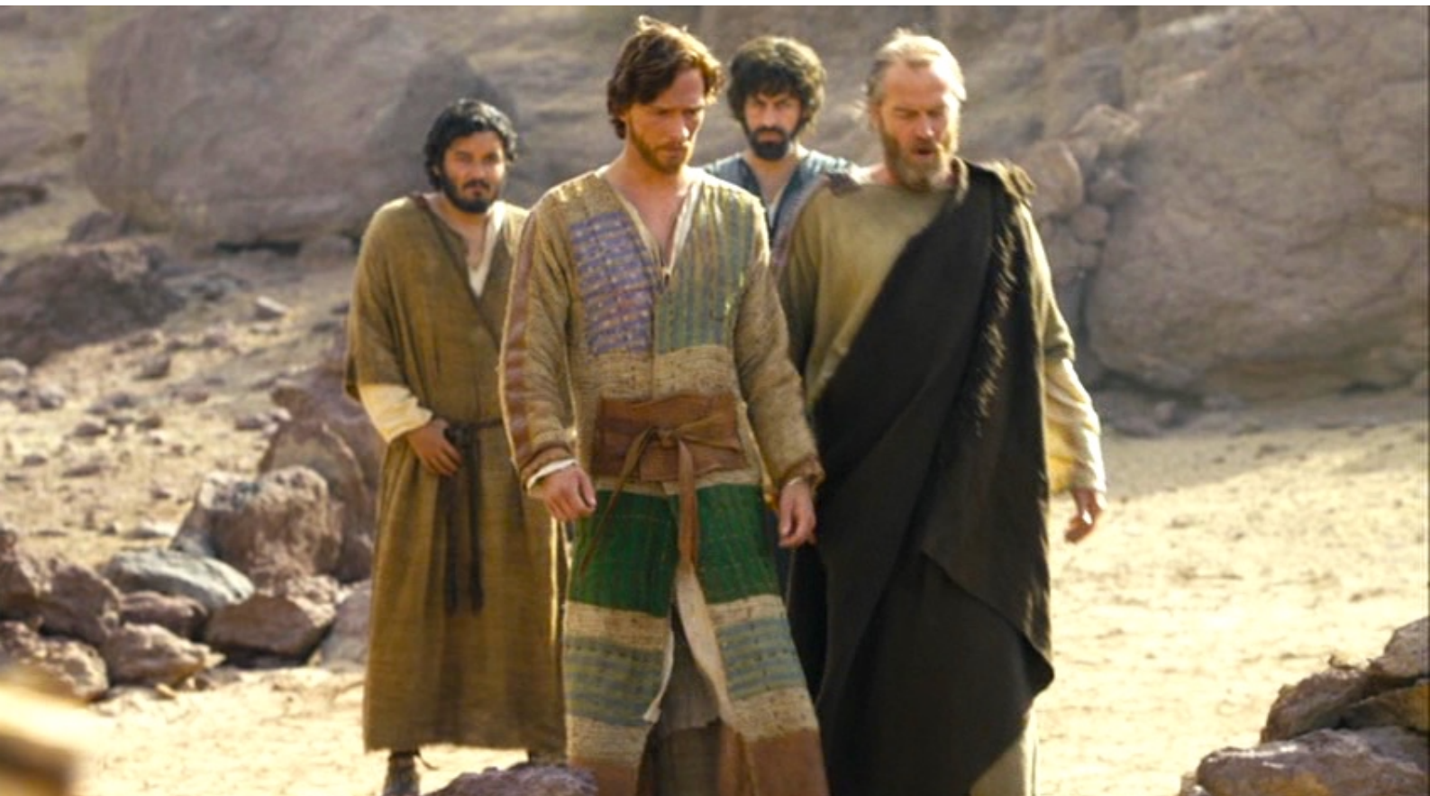
The Red Tent : suscitant la jalousie de ses frères.