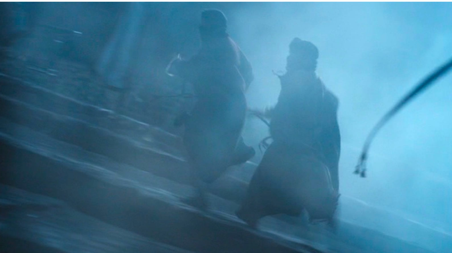
The Red Tent : envahissent nuitamment la ville,