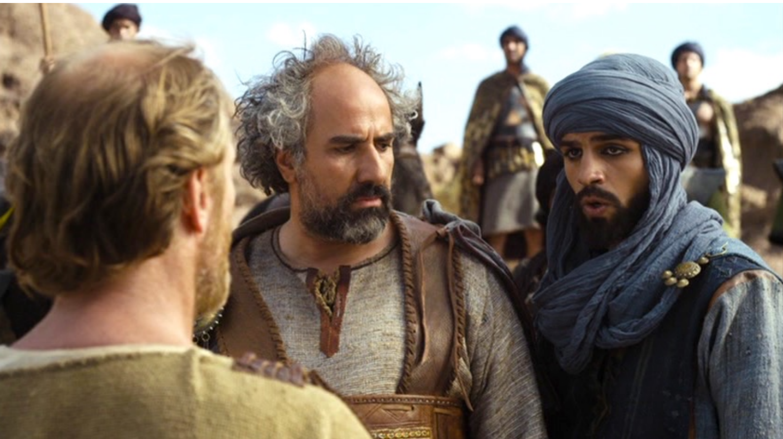
The Red Tent : Shalem pousse son père à accepter.