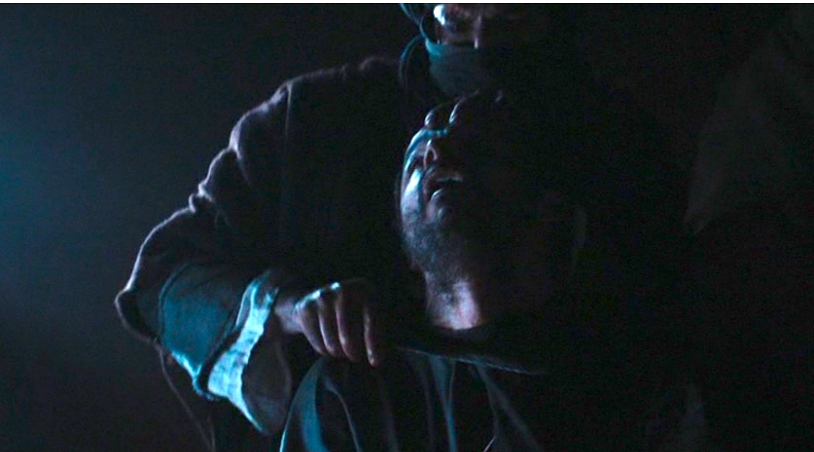
The Red Tent : égorgent,