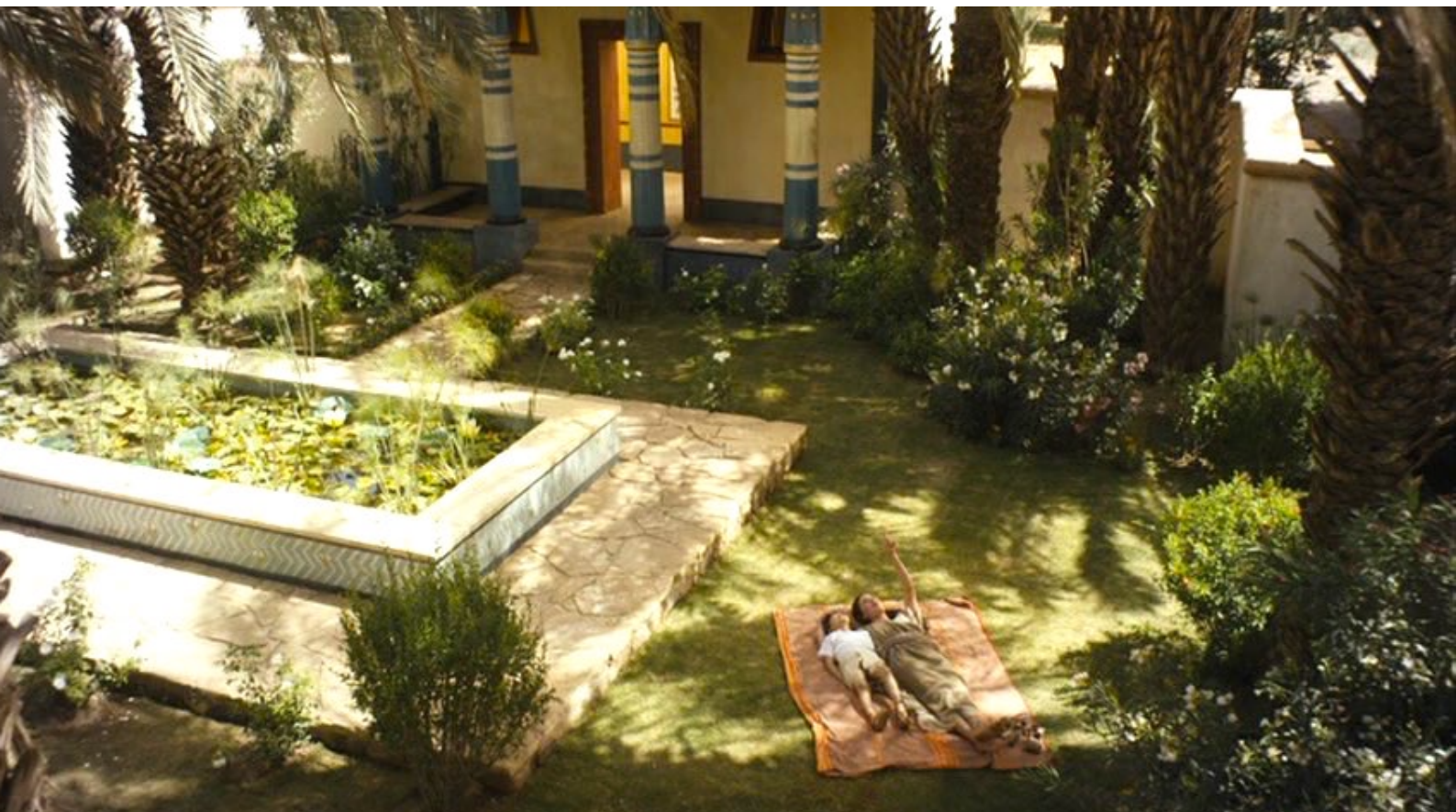
The Red Tent : ... ou lui apprenant à observer le ciel.