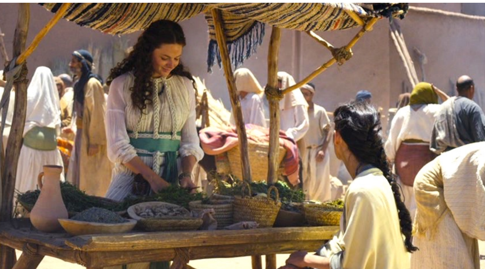
The Red Tent : Elle survit en vendant des herbes médicinales au marché,