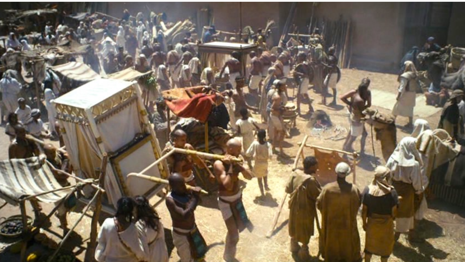
The Red Tent : Après avoir traversé une place de la capitale égyptienne,