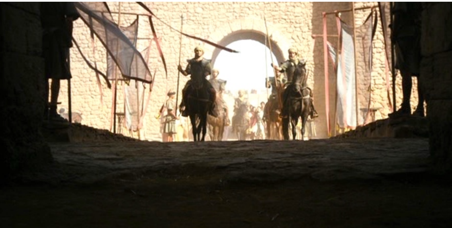
The Red Tent : Pour régler le problème et calmer la colère de Jacob, le roi Hamor quitte Sichem...