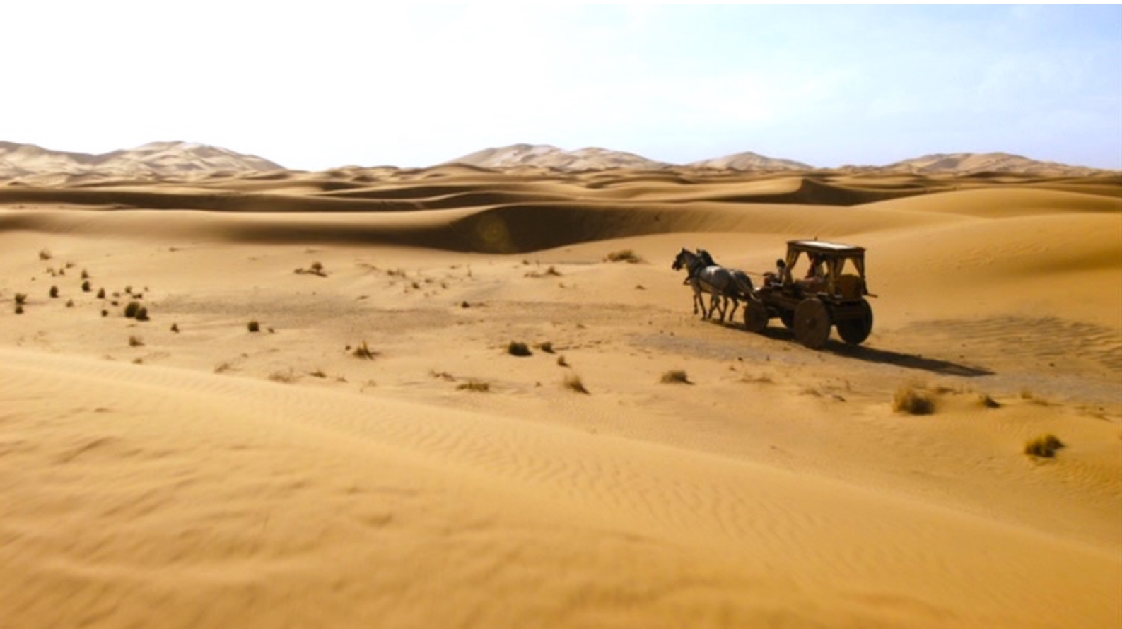
The Red Tent : mais sa belle-mère Re-Nefer, princesse égyptienne, l'emmène en Égypte,