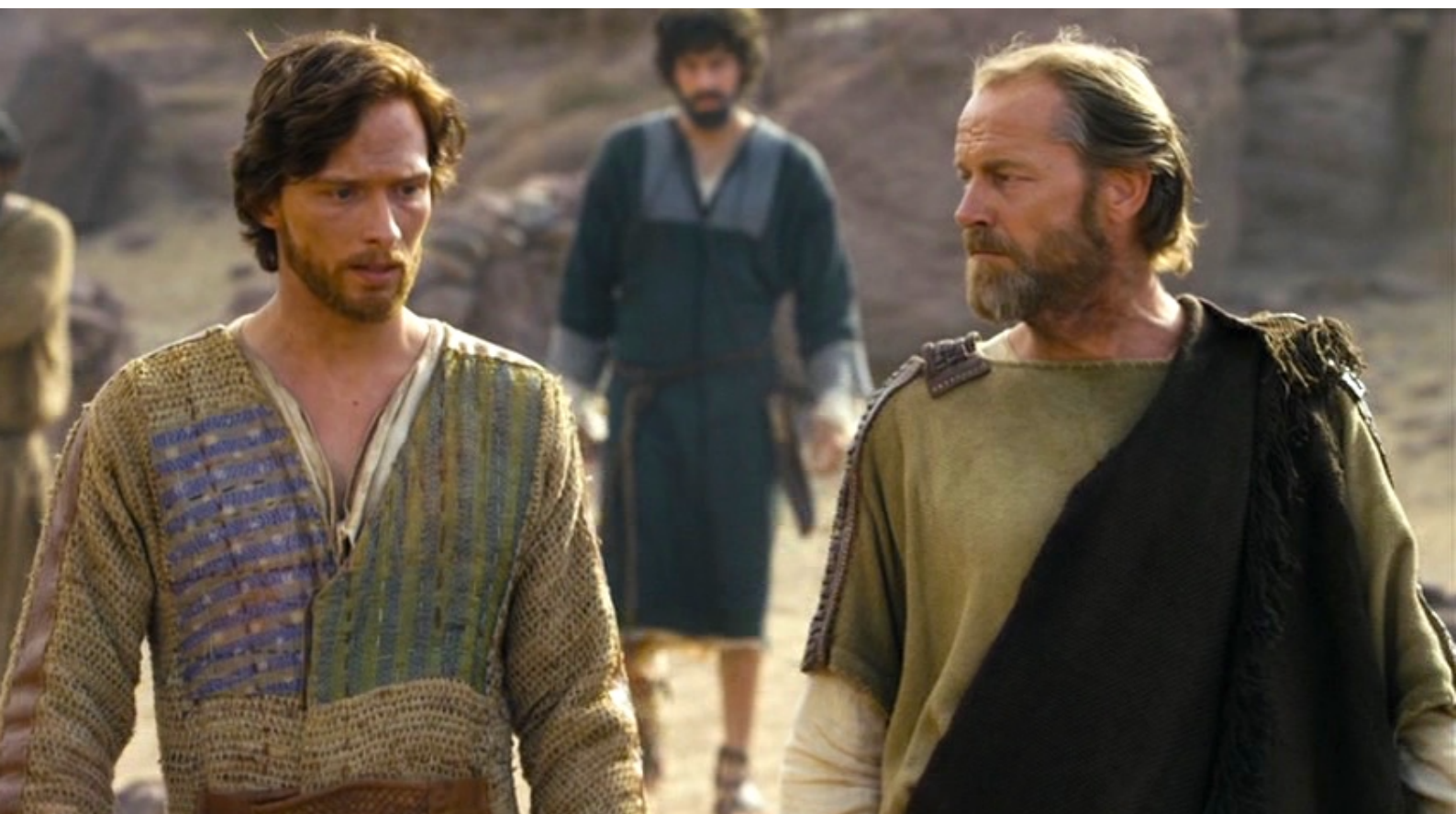
The Red Tent : et Jacob, inquiet, ne consulte que Joseph,