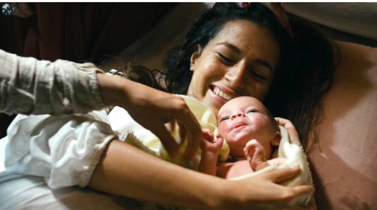
The Red Tent : et feront naître un nourrisson.