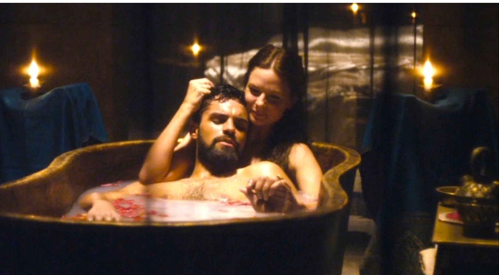
The Red Tent : ... et se marient sans demander l'autorisation de Jacob.