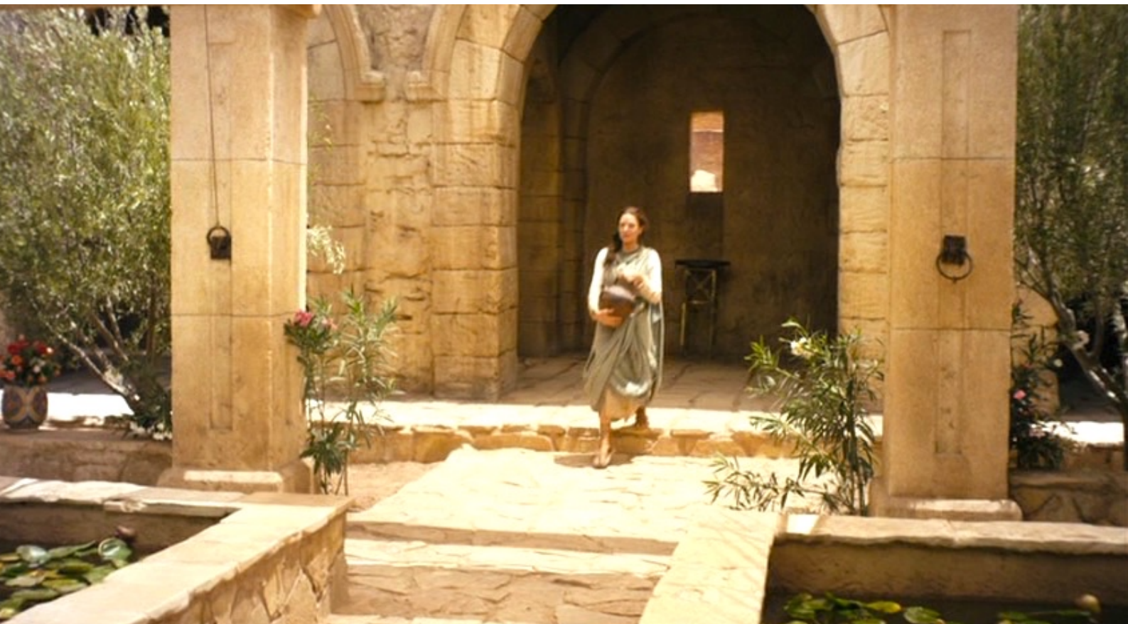
The Red Tent : Pendant ce séjour, allant dans le jardin,