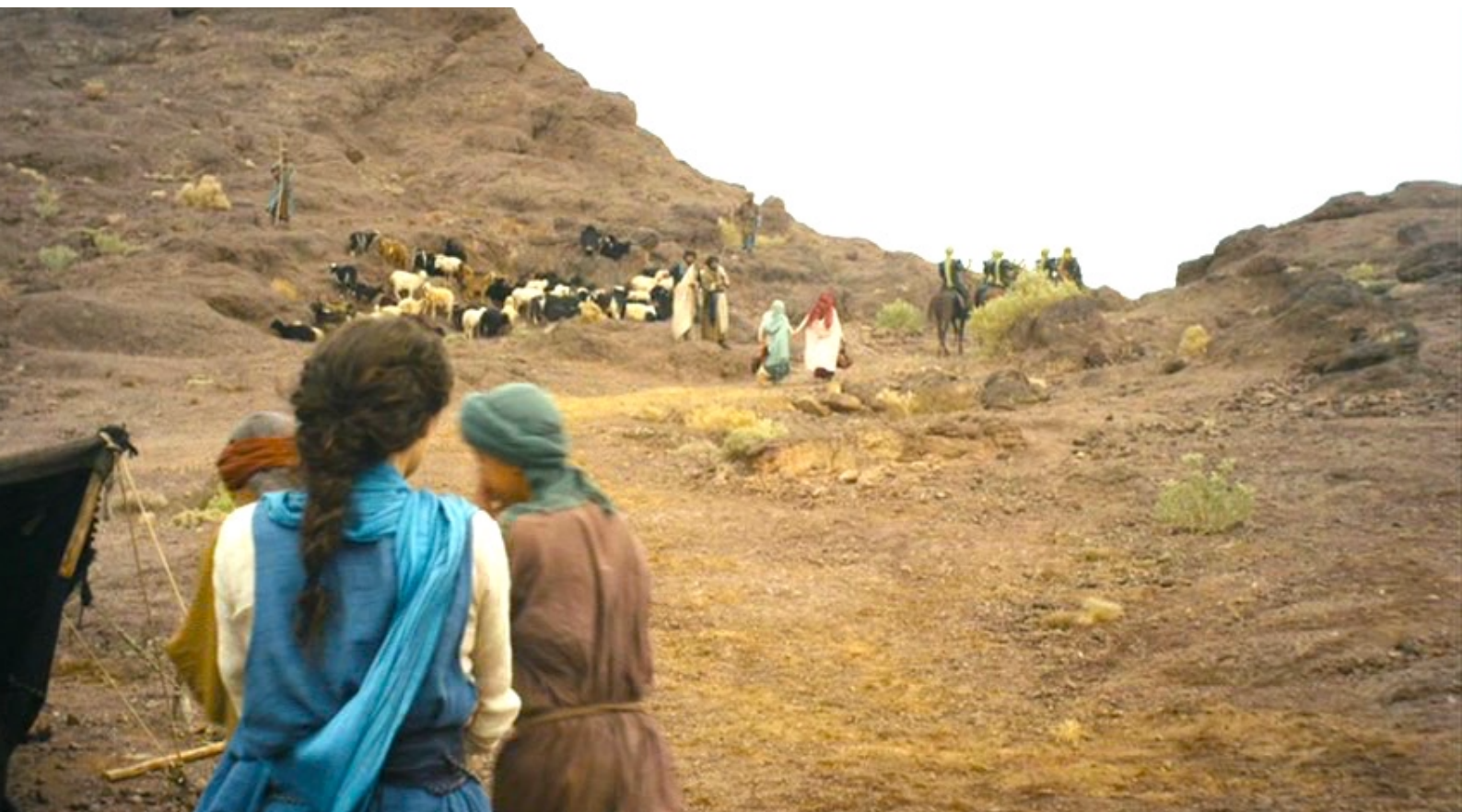
The Red Tent : et Rachel et Dina acceptent de se rendre à la ville :