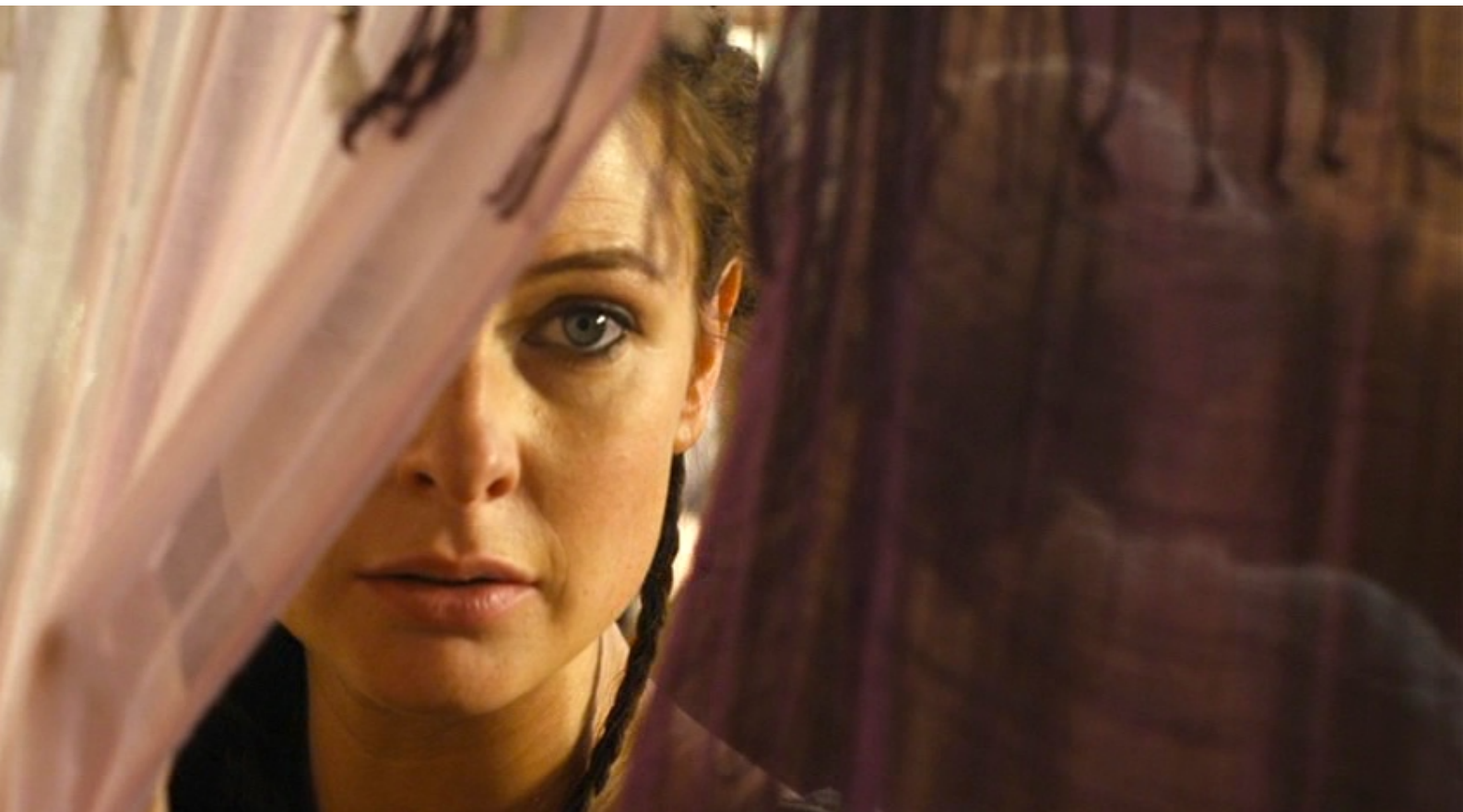
The Red Tent : et elle aperçoit aussi un très beau jeune homme, dont elle tombe amoureuse,