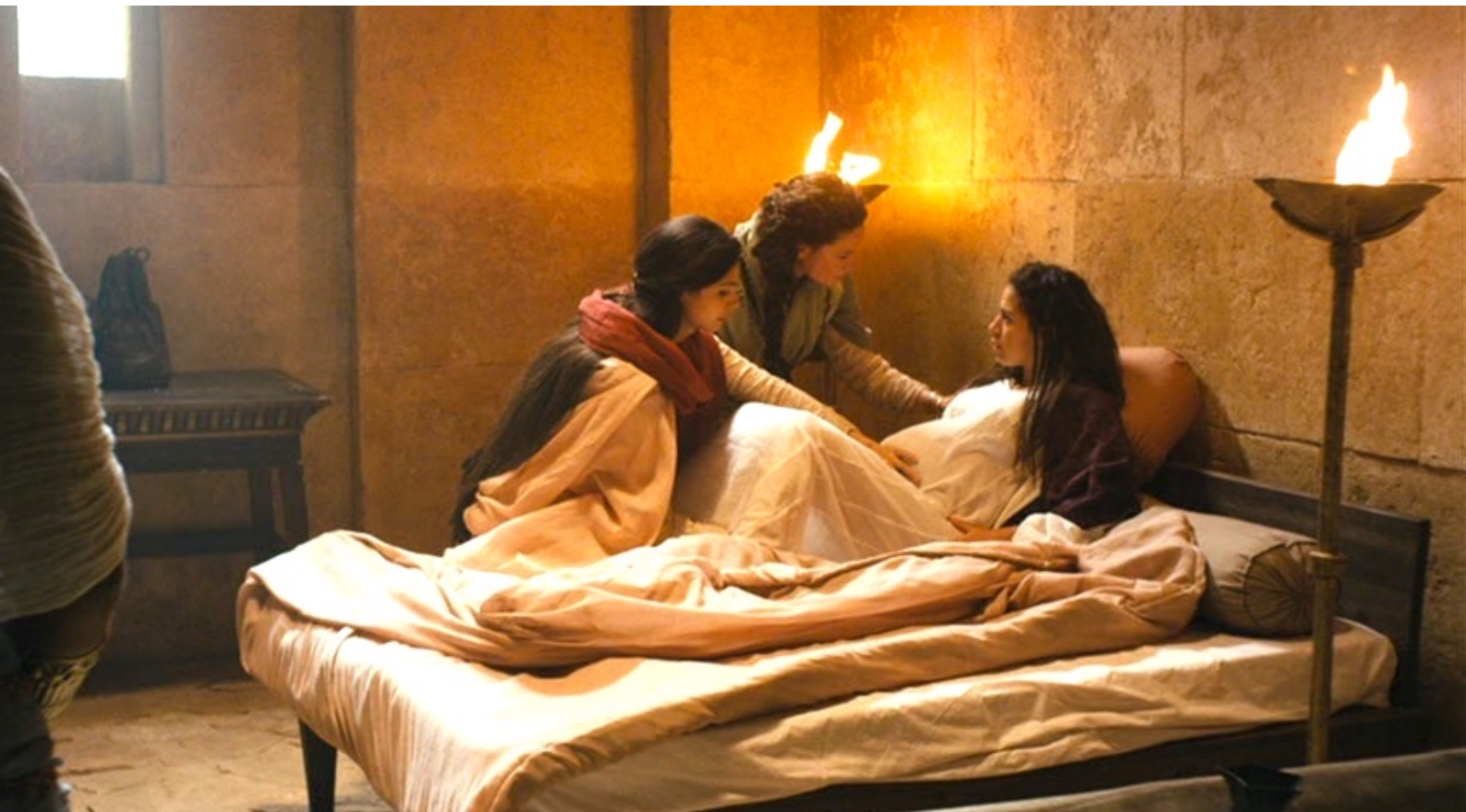
The Red Tent : elles aideront à un accouchement...