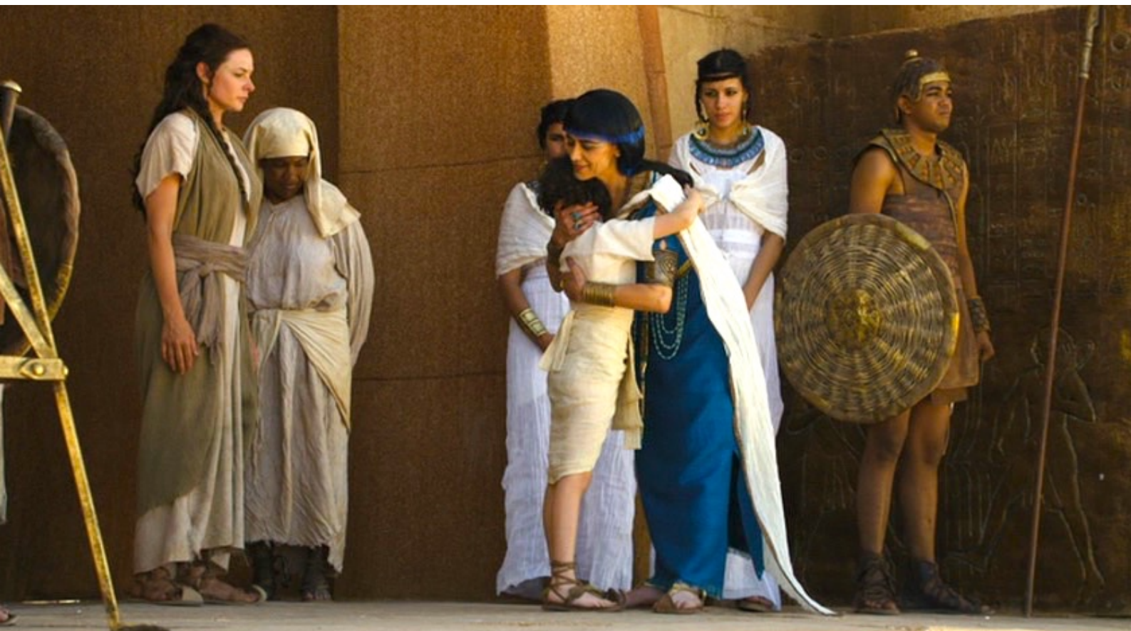
The Red Tent : En Égypte, Re-Nefer décide d'envoyer Re-Mose dans une école de scribes,