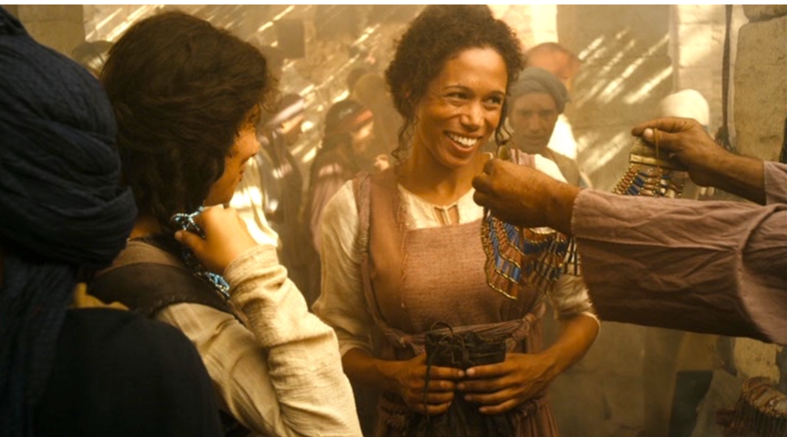
The Red Tent : des vendeurs de parures,