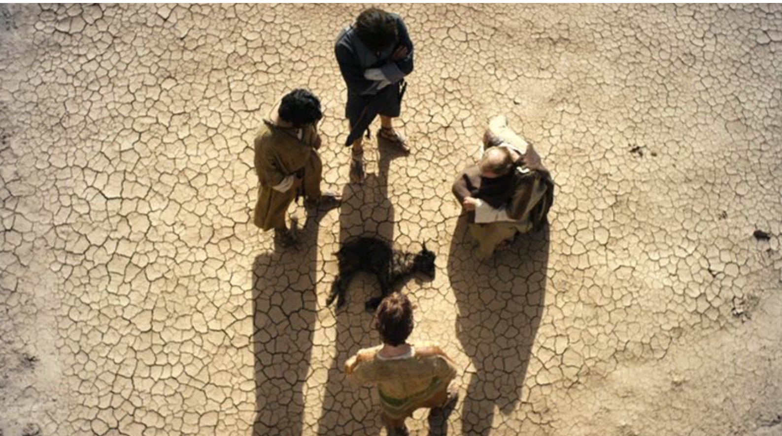
The Red Tent : Entre-temps, une sécheresse terrible s'abat sur la Palestine,