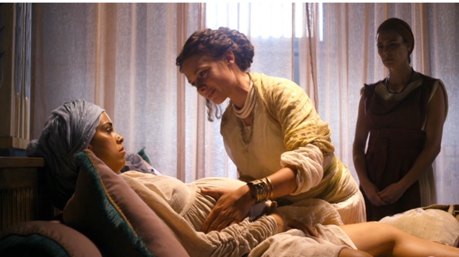
The Red Tent : elle assiste des parturientes...