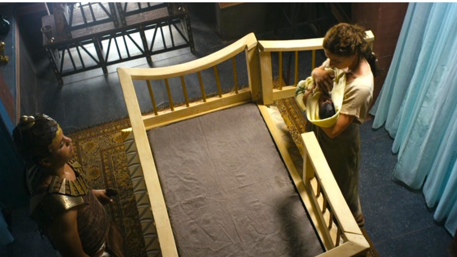
The Red Tent : et, malgré Re-Nefer, essaie de se comporter en mère,