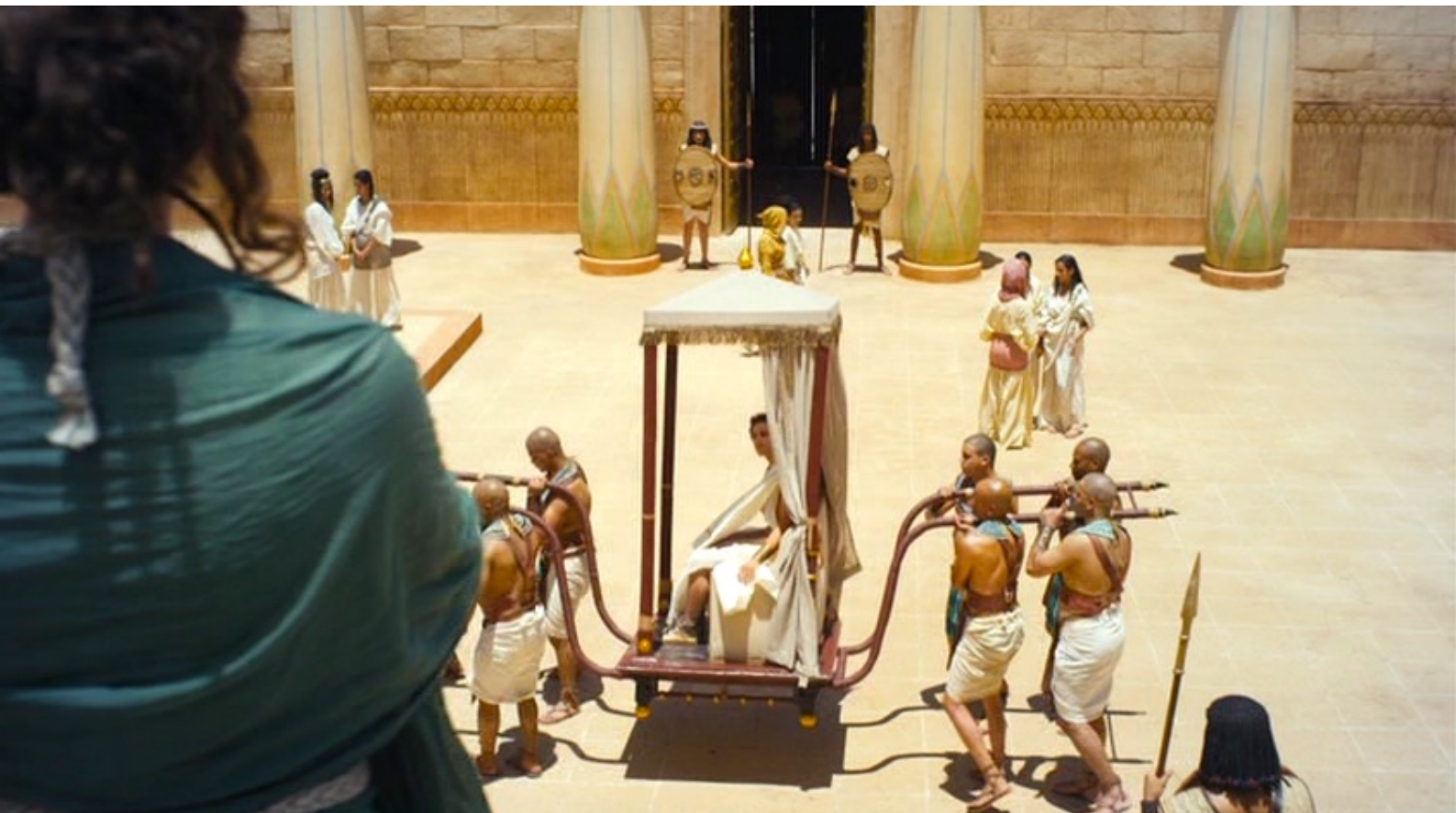
The Red Tent : Re-Mose, mal informé, essaie de tuer Joseph et doit partir en exil.