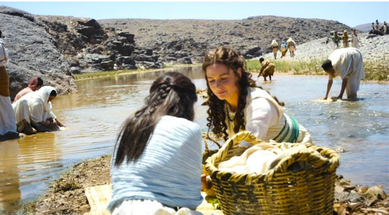
The Red Tent : elle fait sa lessive à l'oued,