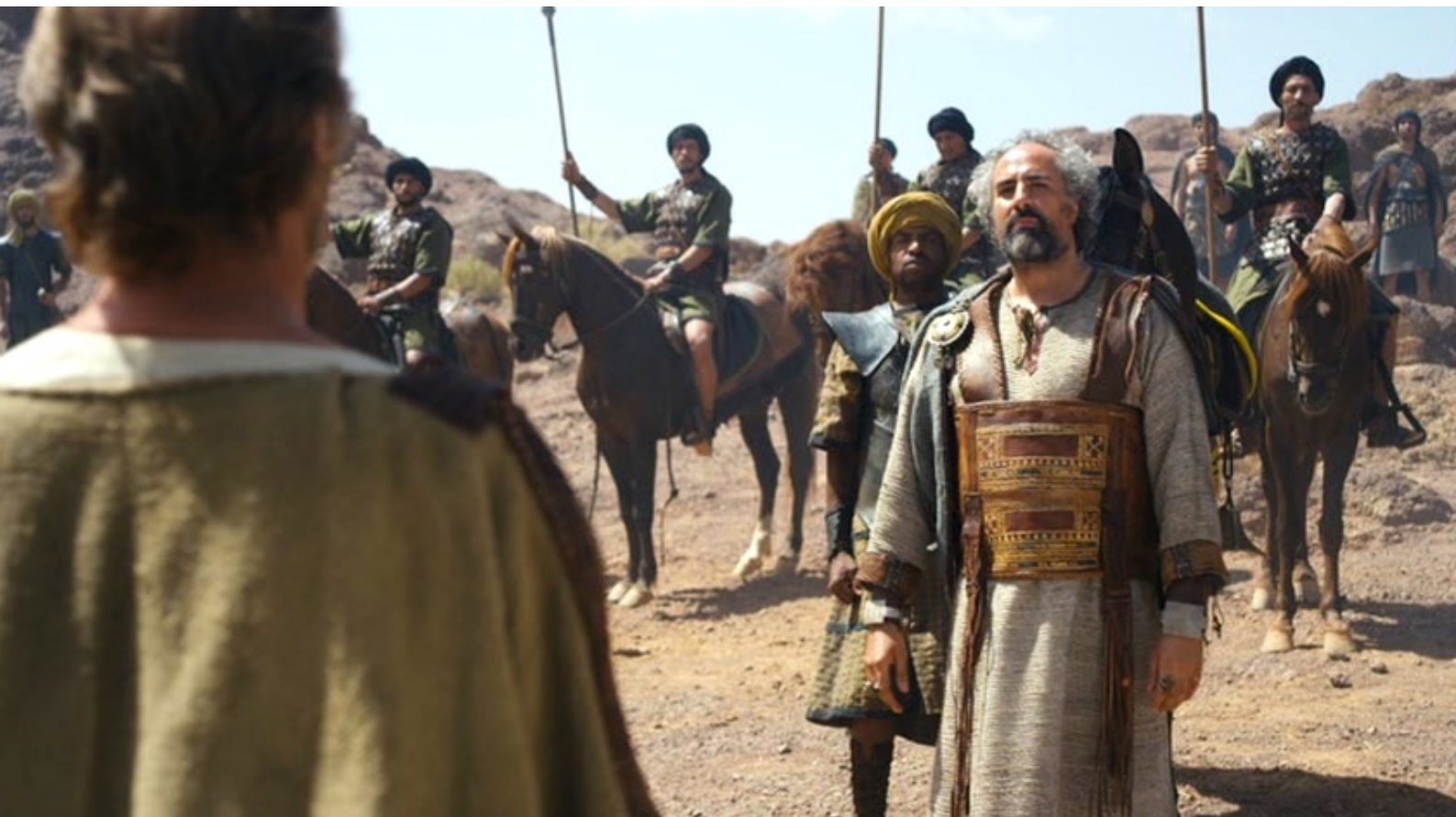
The Red Tent : Jacob refusant et exigeant que tous les hommes de Sichem se fassent circoncire,