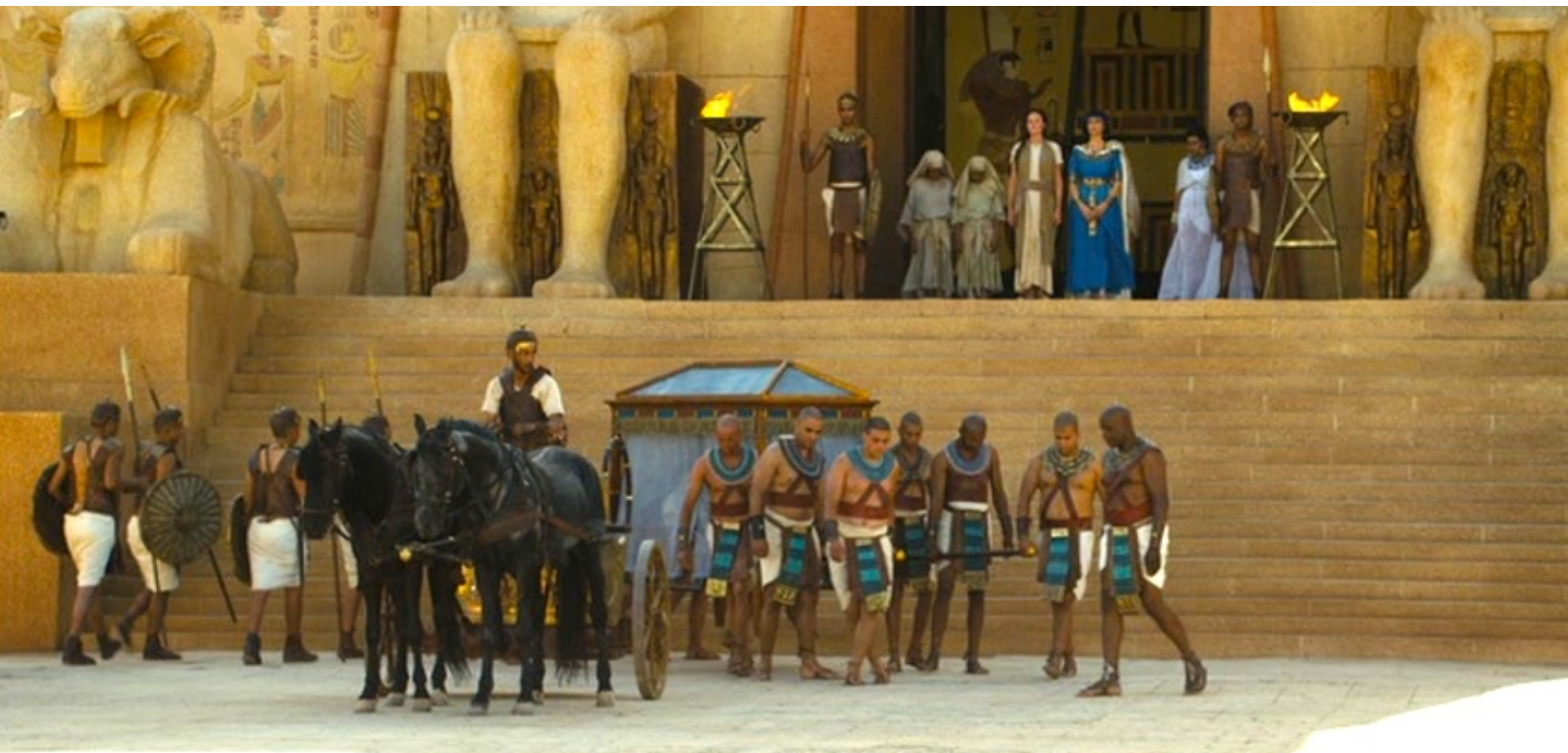
The Red Tent : ... s'en aller au loin.