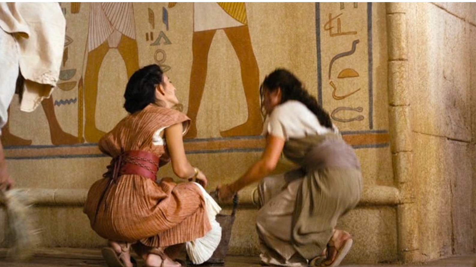
The Red Tent : ... et, après avoir fait ses adieux à Meryt,