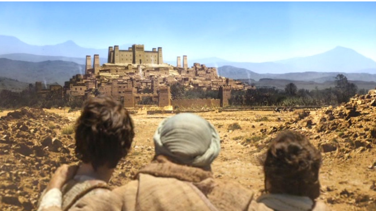
The Red Tent : une splendide cité construite sur une colline.