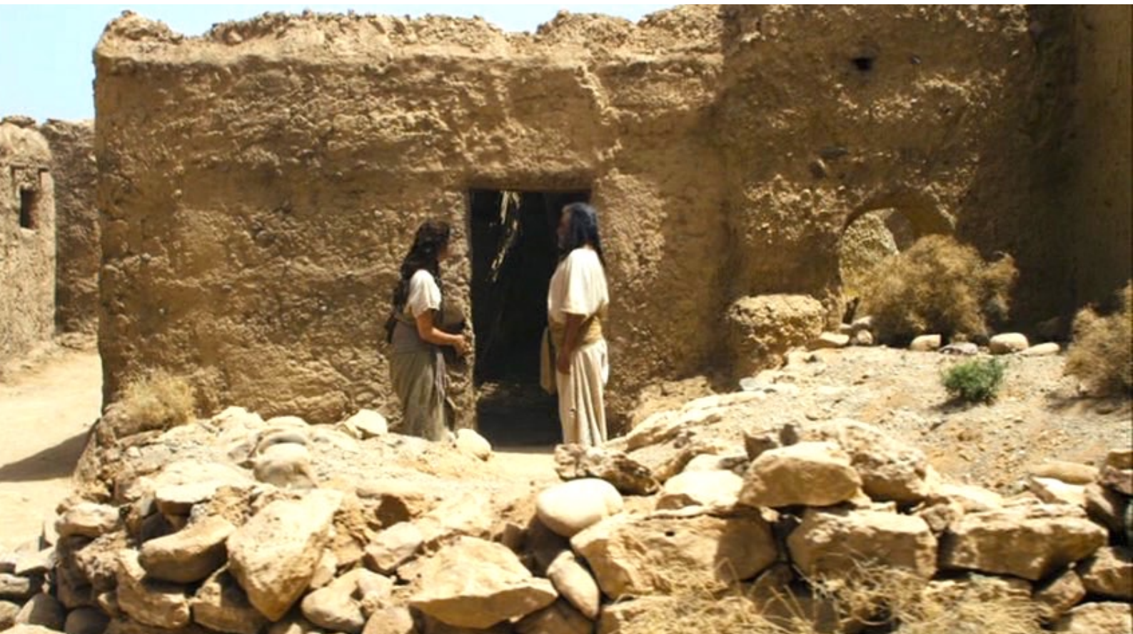
The Red Tent : sans ressources, elle se trouve un infâme gourbi pour se loger.