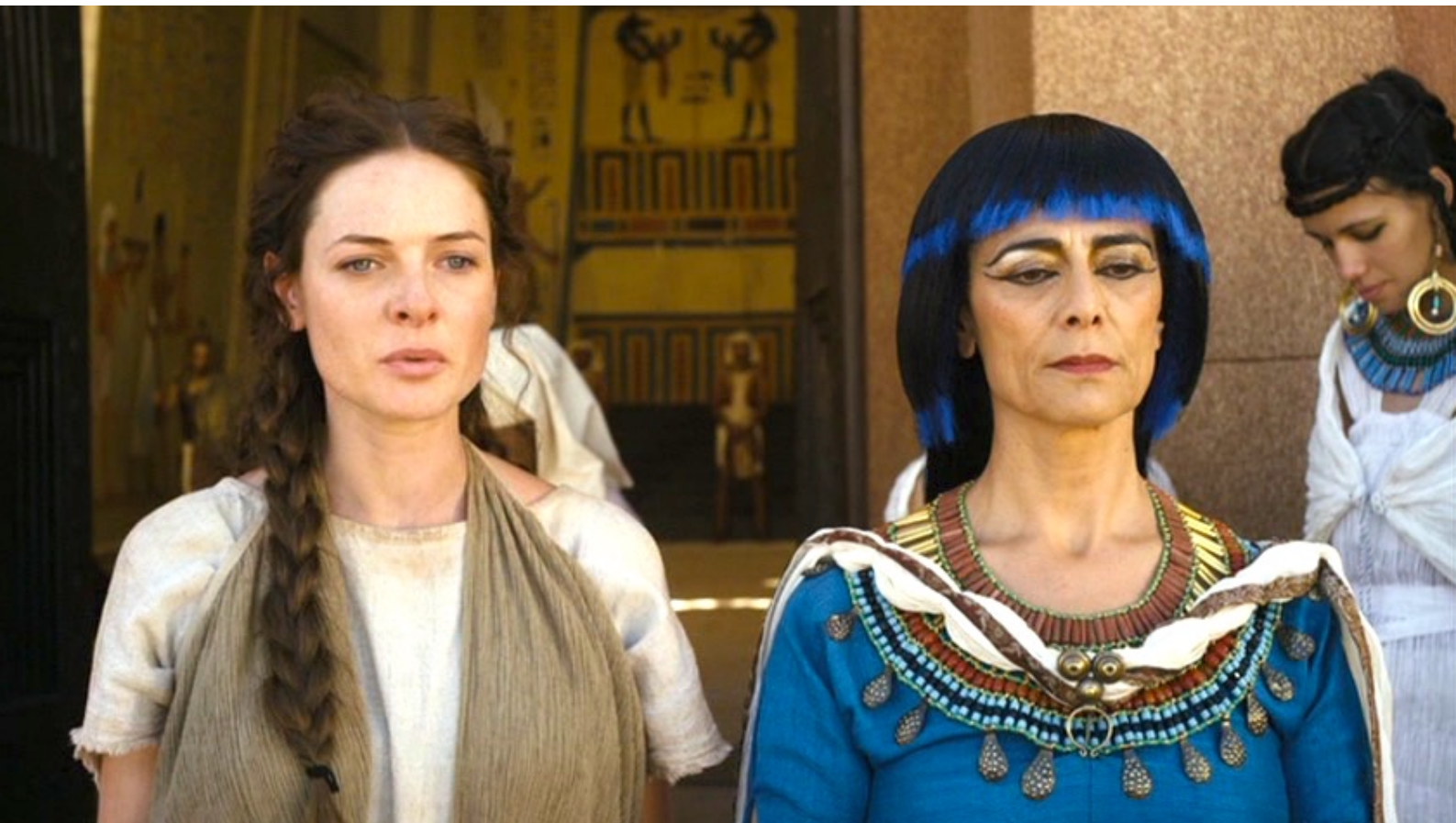
The Red Tent : et Dina, désespérée, le voit...