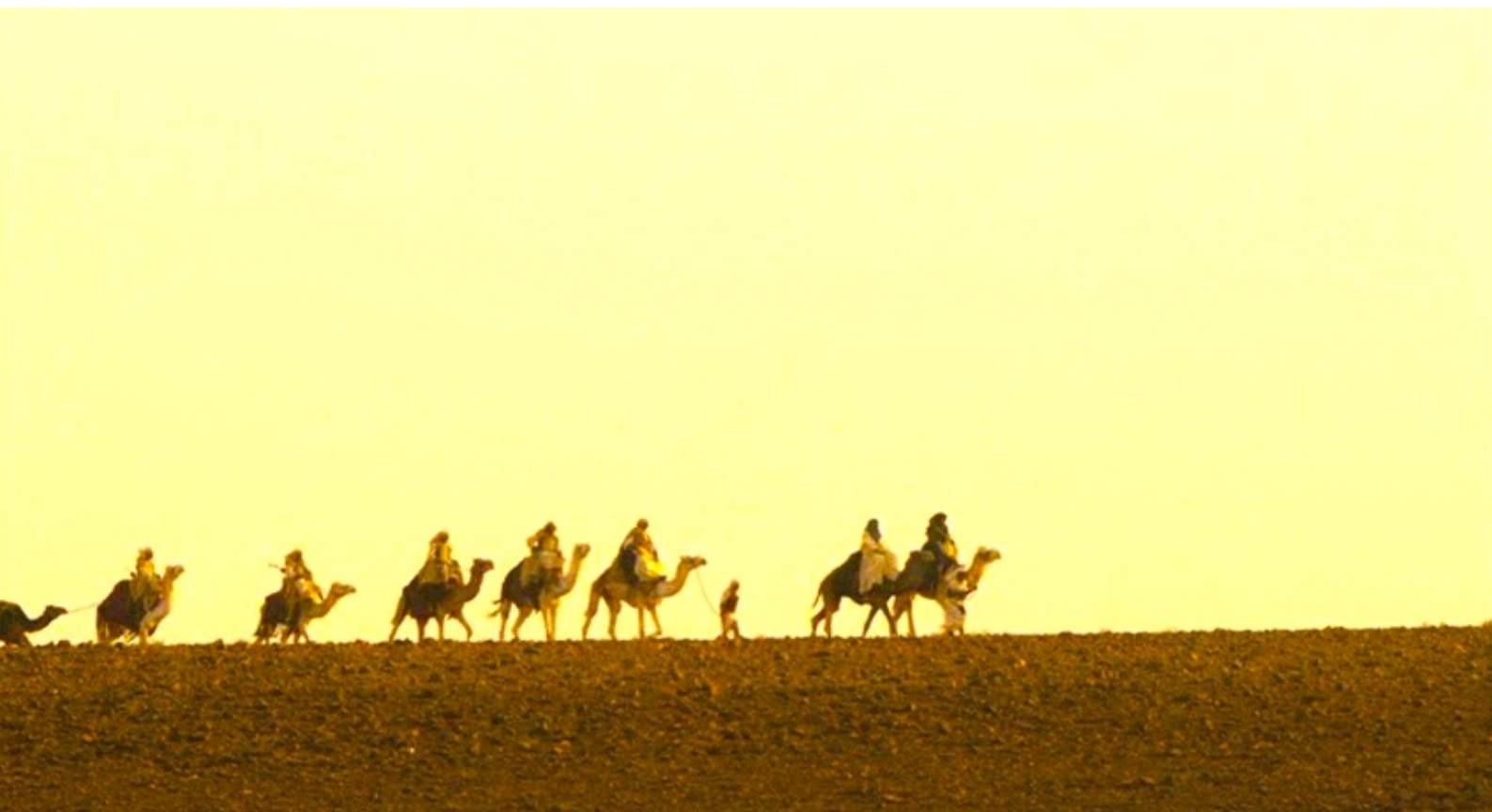
The Red Tent : De leur côté, Dina et son frère traversent le désert pour revoir...