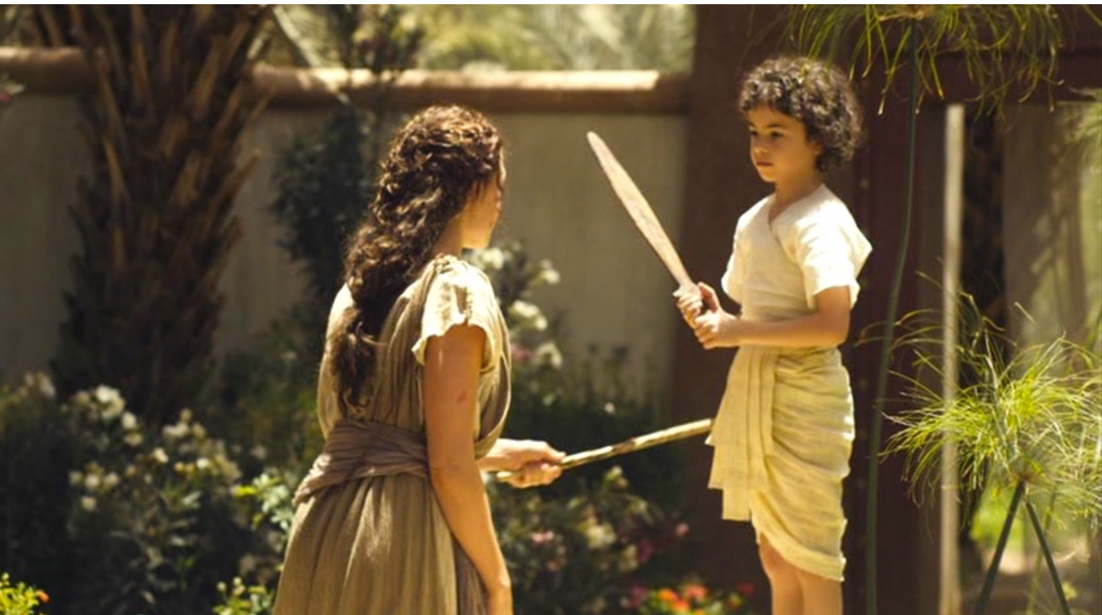
The Red Tent : jouant à l'escrime avec l'enfant...