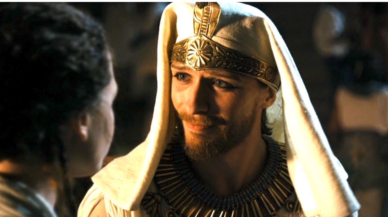
The Red Tent : ... qui est surpris et tout heureux de retrouver sa sœur.