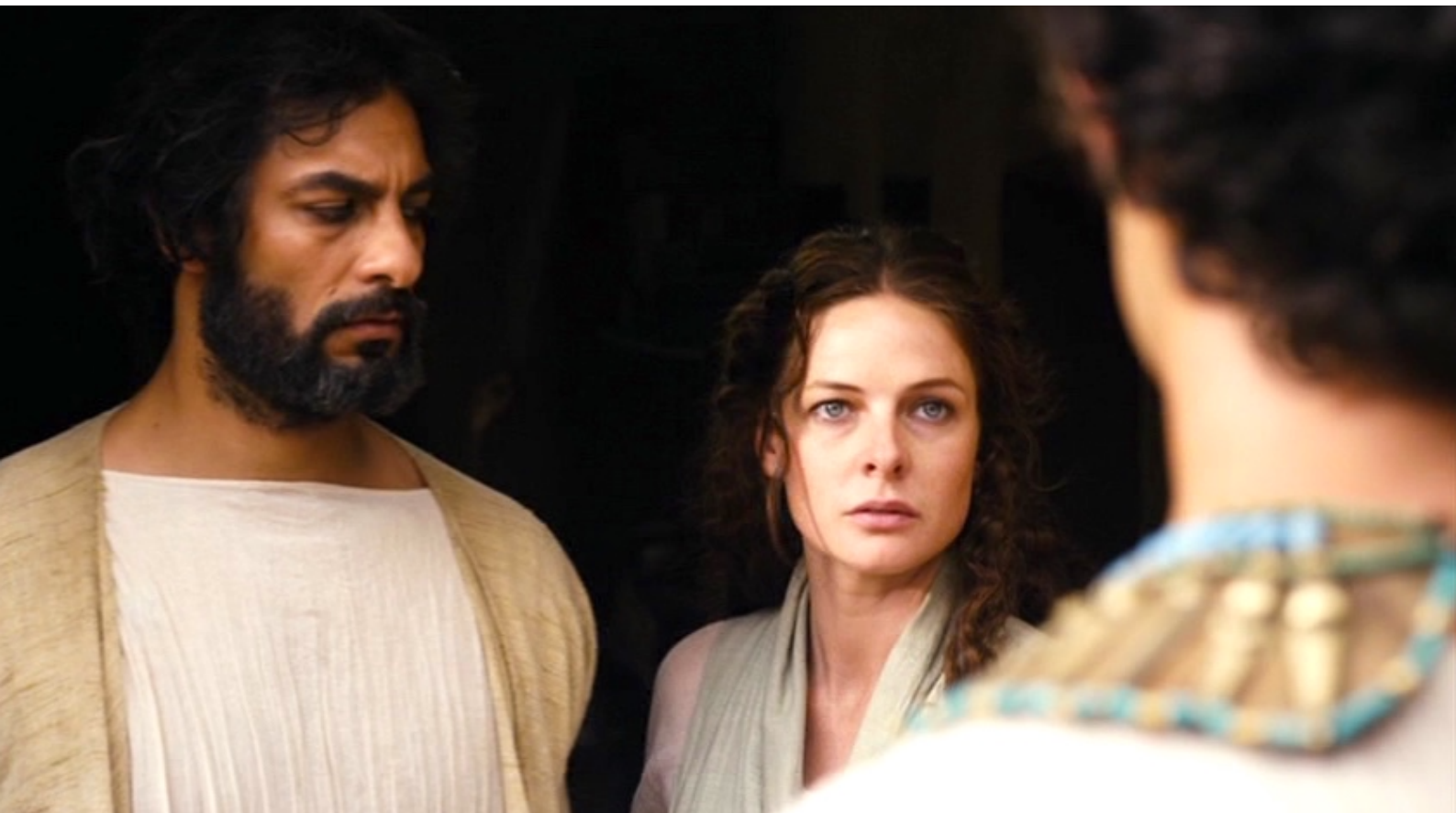
The Red Tent : Un matin, le couple est réveillé par un visiteur...