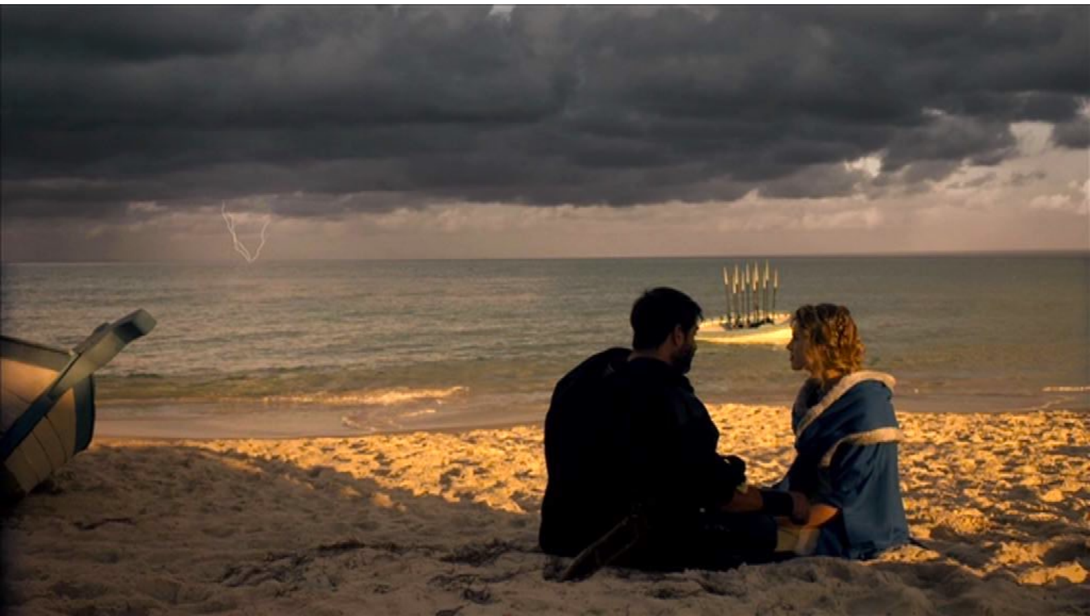
Santa Barbara : ... car elle a eu le coup de foudre pour lui.