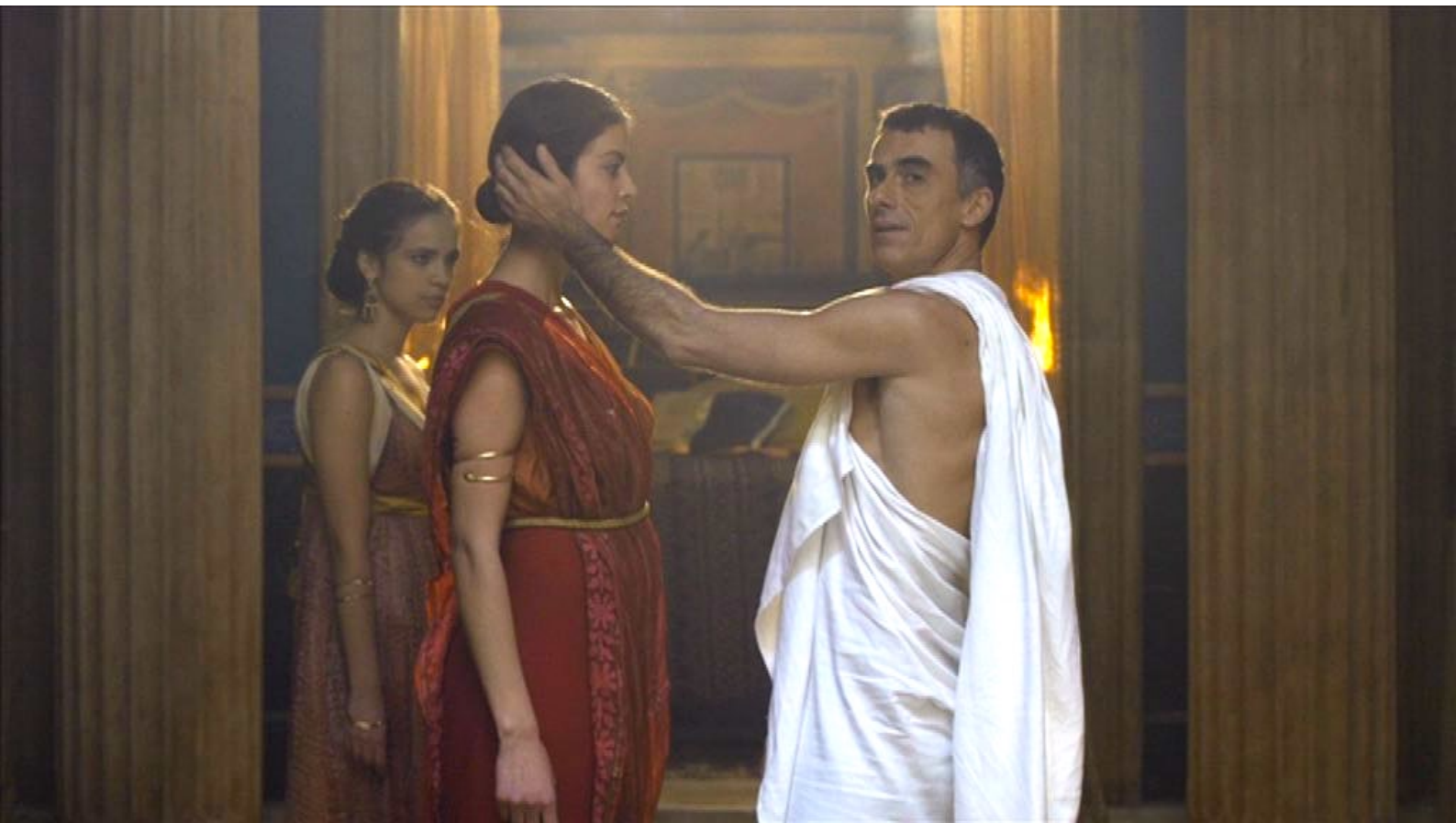
Santa Barbara : ... qui veut contraindre une esclave à lui accorder des faveurs.