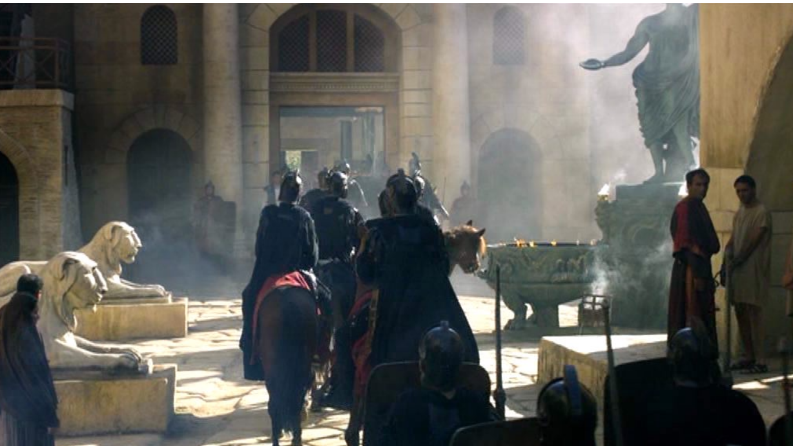
Santa Barbara : Et voilà qu'arrive l'escorte...