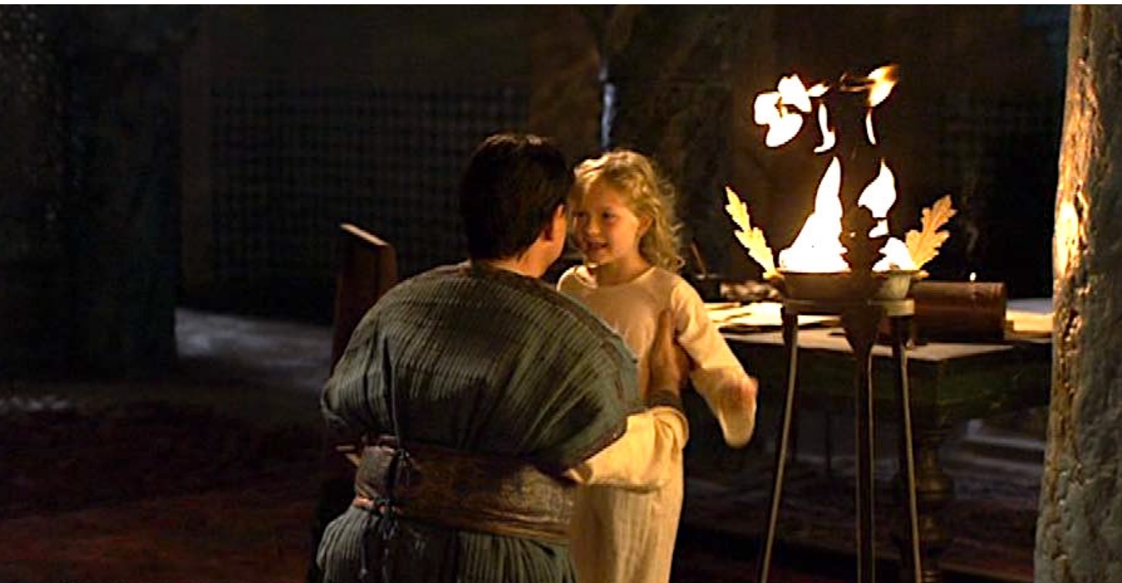
Santa Barbara : Puis son père lui a prétendu que sa mère était morte.