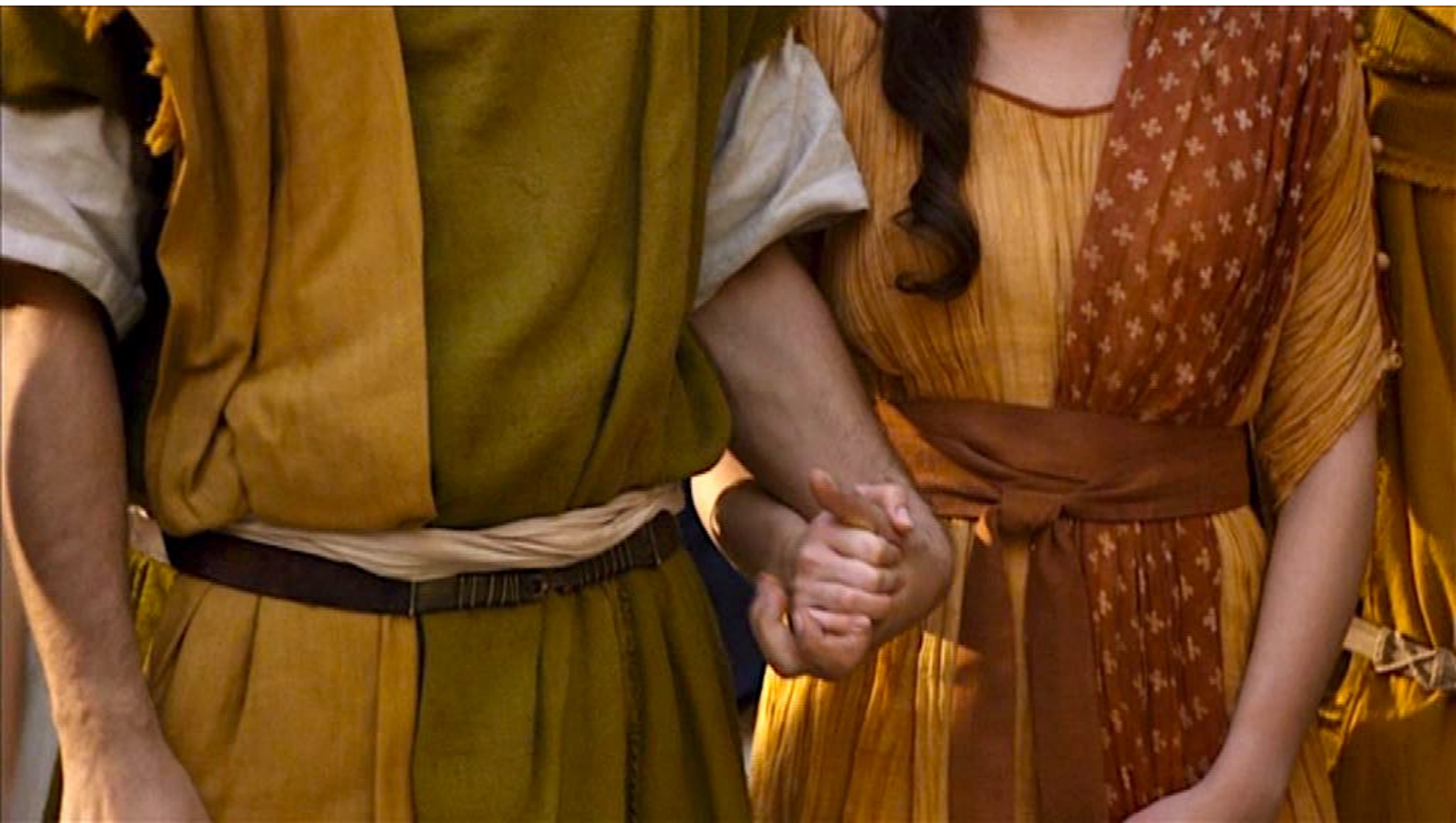
Santa Barbara : ... et se soutiennent en se donnant la main,