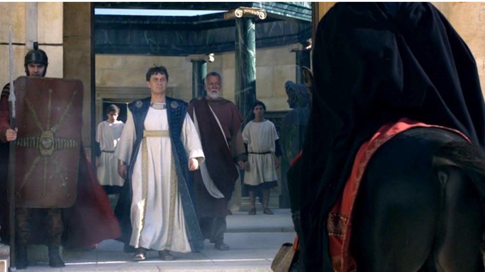
Santa Barbara : ... que Dioscore accueille...