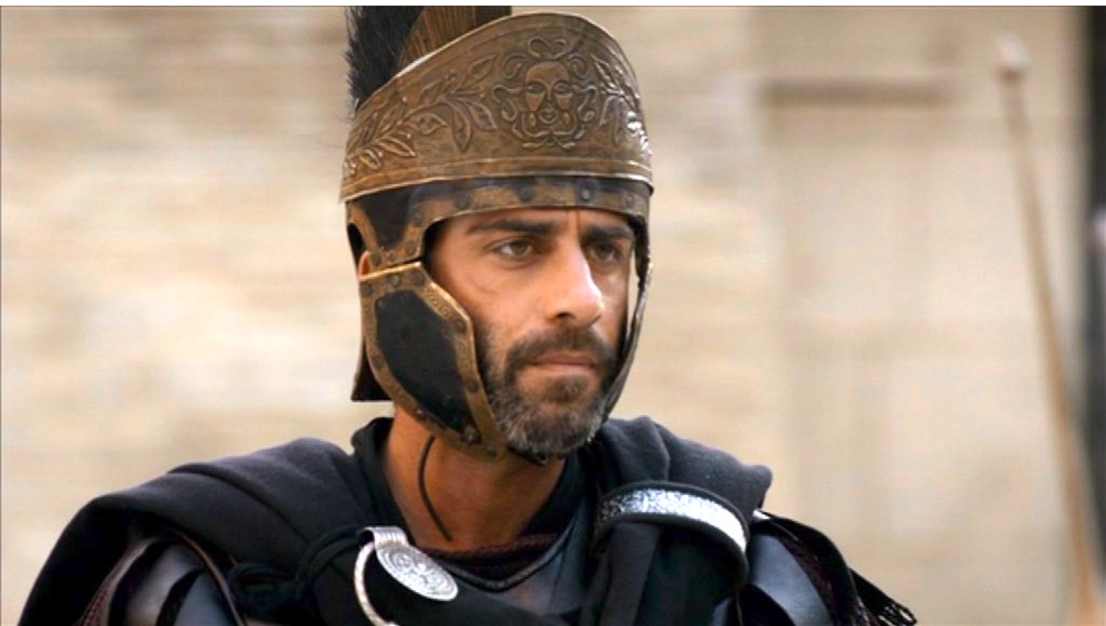
Santa Barbara : Mais voilà qu'arrive Claudius.