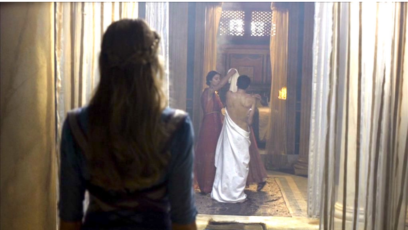
Santa Barbara : Un moment après, elle surprend au bain Marcianus...