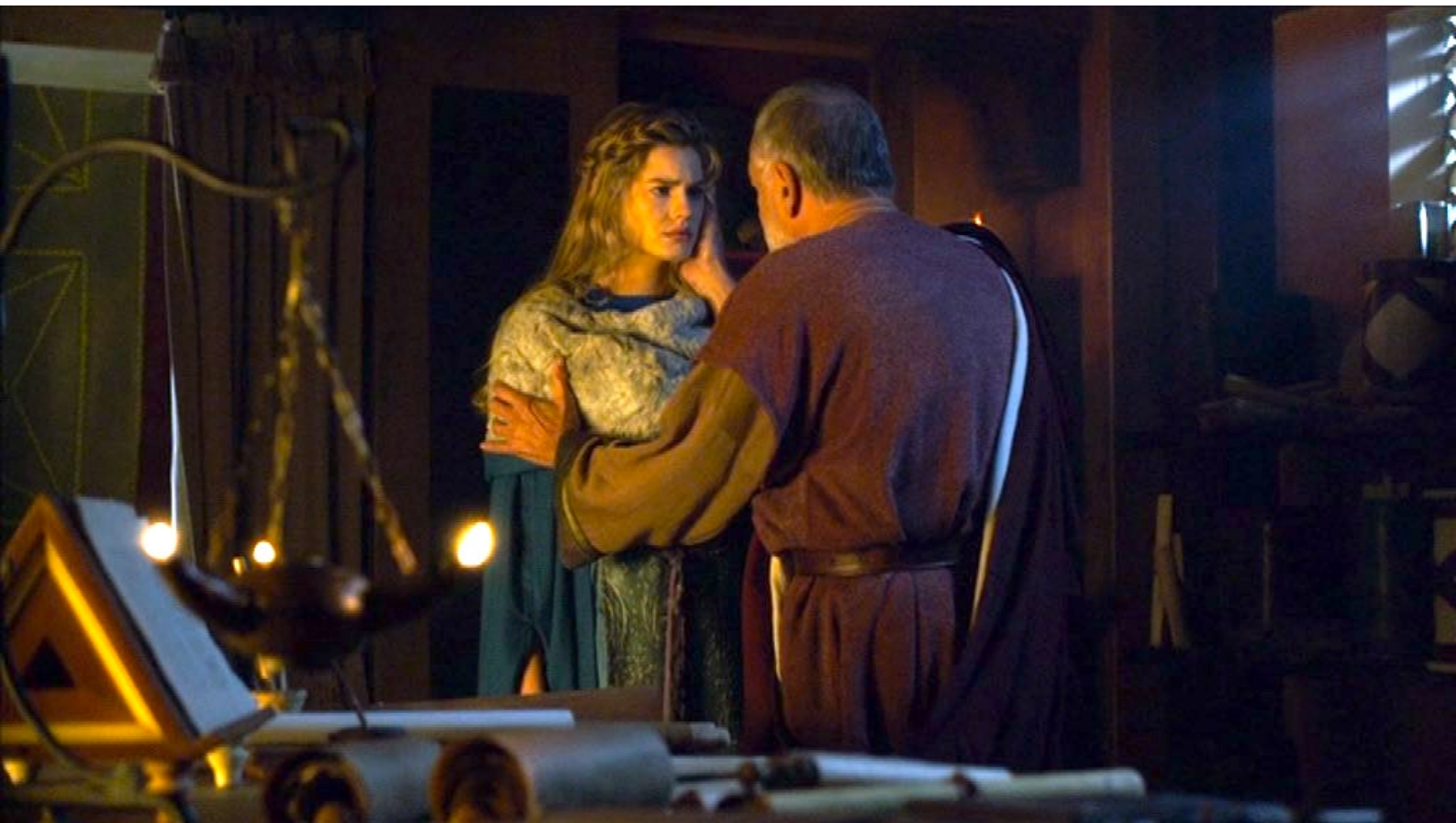
Santa Barbara : et il lui fait des révélations sur la disparition de sa mère.