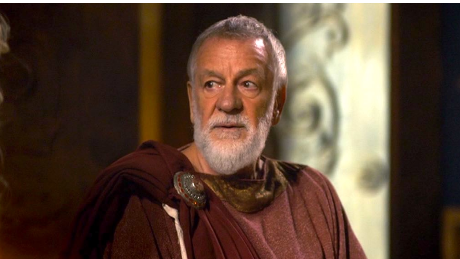
Santa Barbara : ... auprès de son sage maître Policarpe.