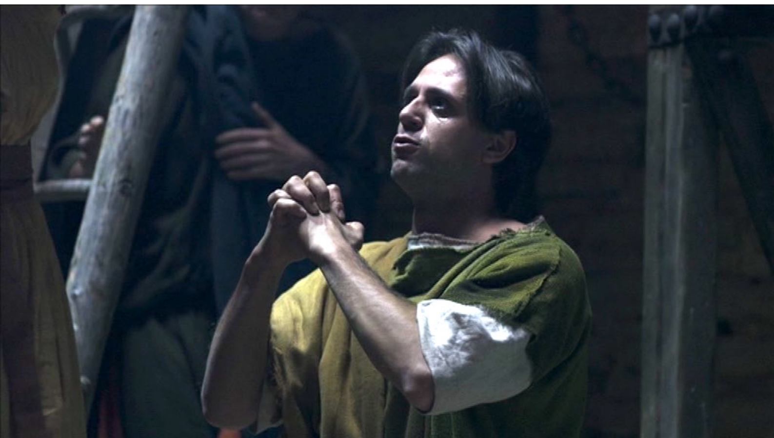
Santa Barbara : tandis que son ami Livius prie ardemment pour elle.