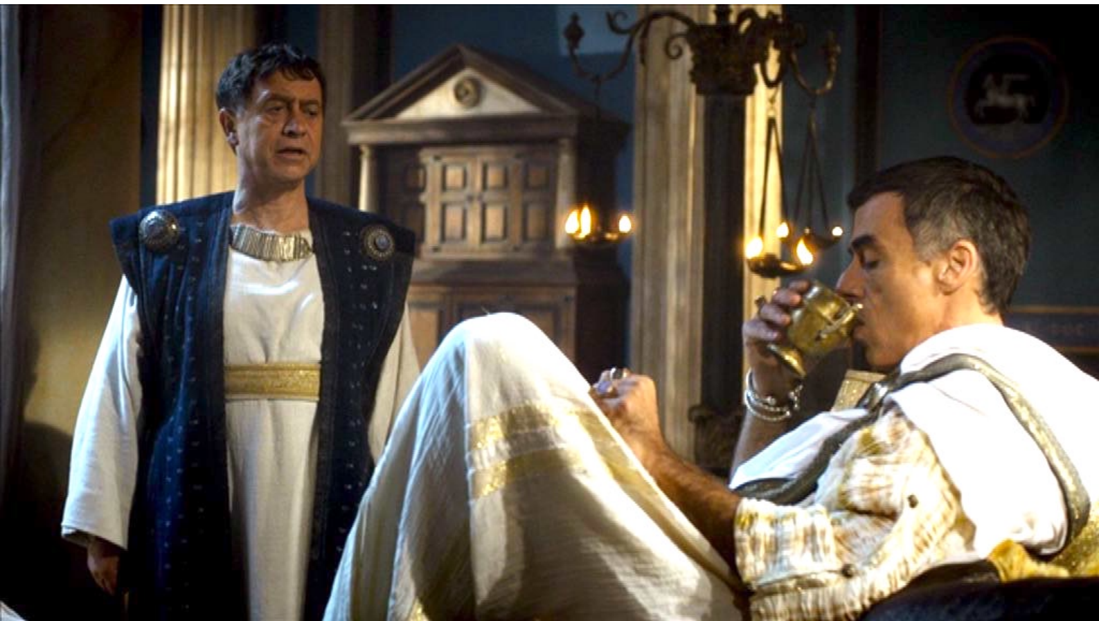
Santa Barbara : de même que Dioscore, qui veut laisser le choix du mari à sa fille.