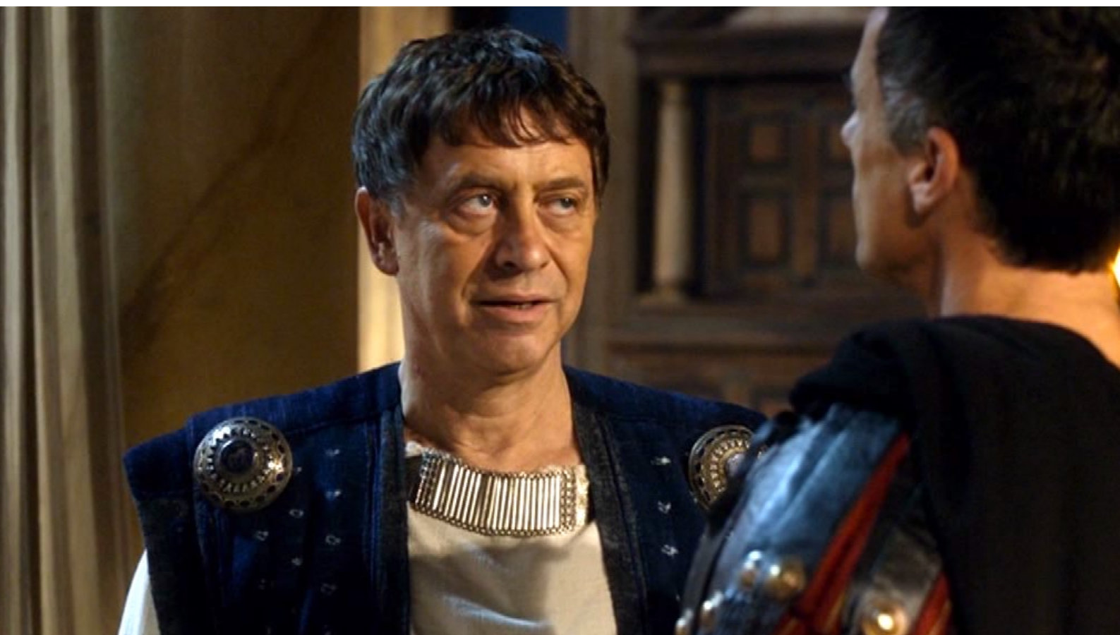
Santa Barbara : ... avant de s'entretenir avec lui.