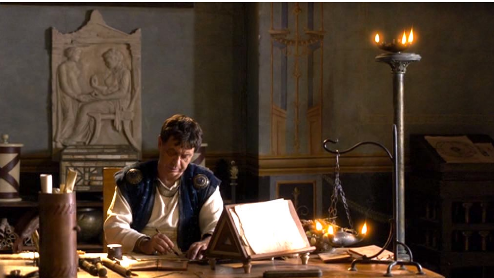
Santa Barbara : Son père Dioscure est gouverneur.