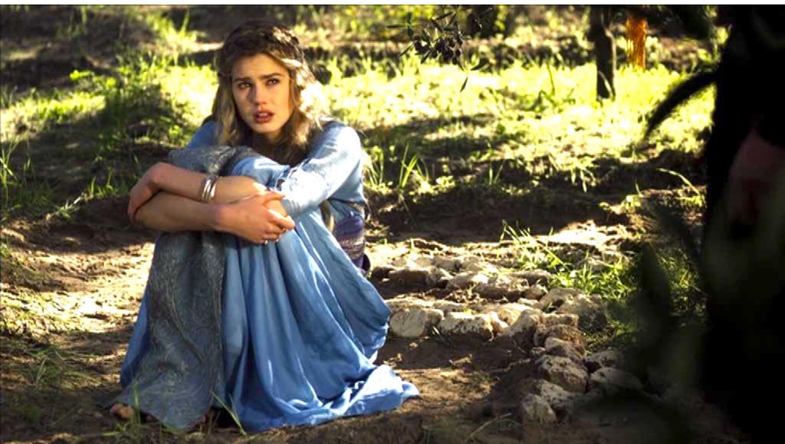
Santa Barbara : Éprouvant le besoin d'être réconfortée, Barbara...