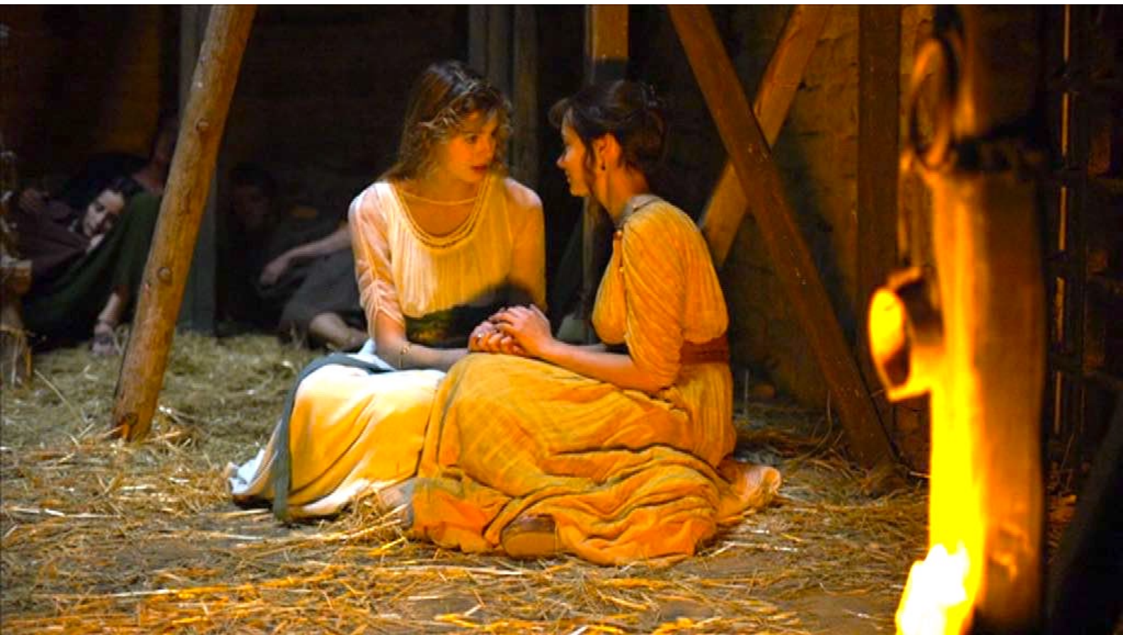
Santa Barbara : ... et aussi les consoler...