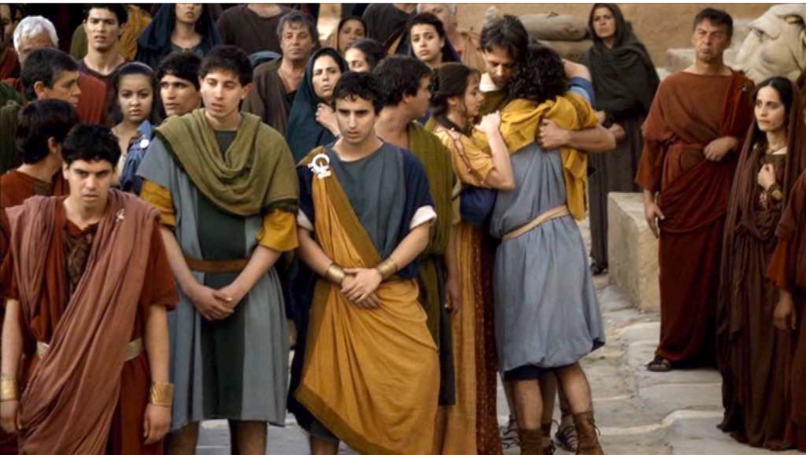
Santa Barbara : Mais, si certains acceptent,