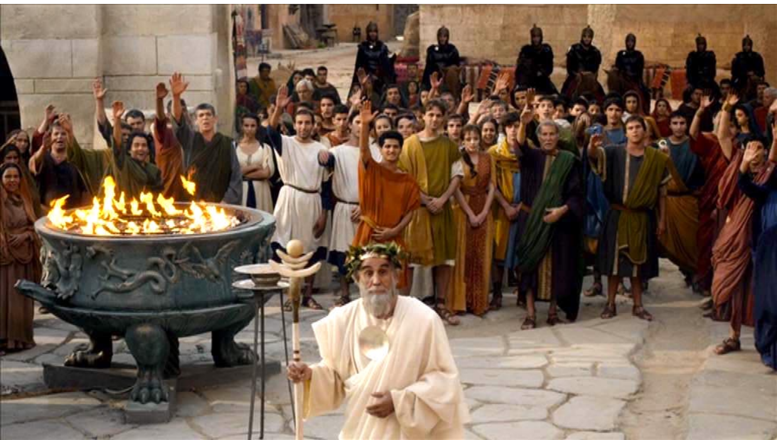
Santa Barbara : ... que tous les adultes viennent devant eux et devant la statue de l'empereur...