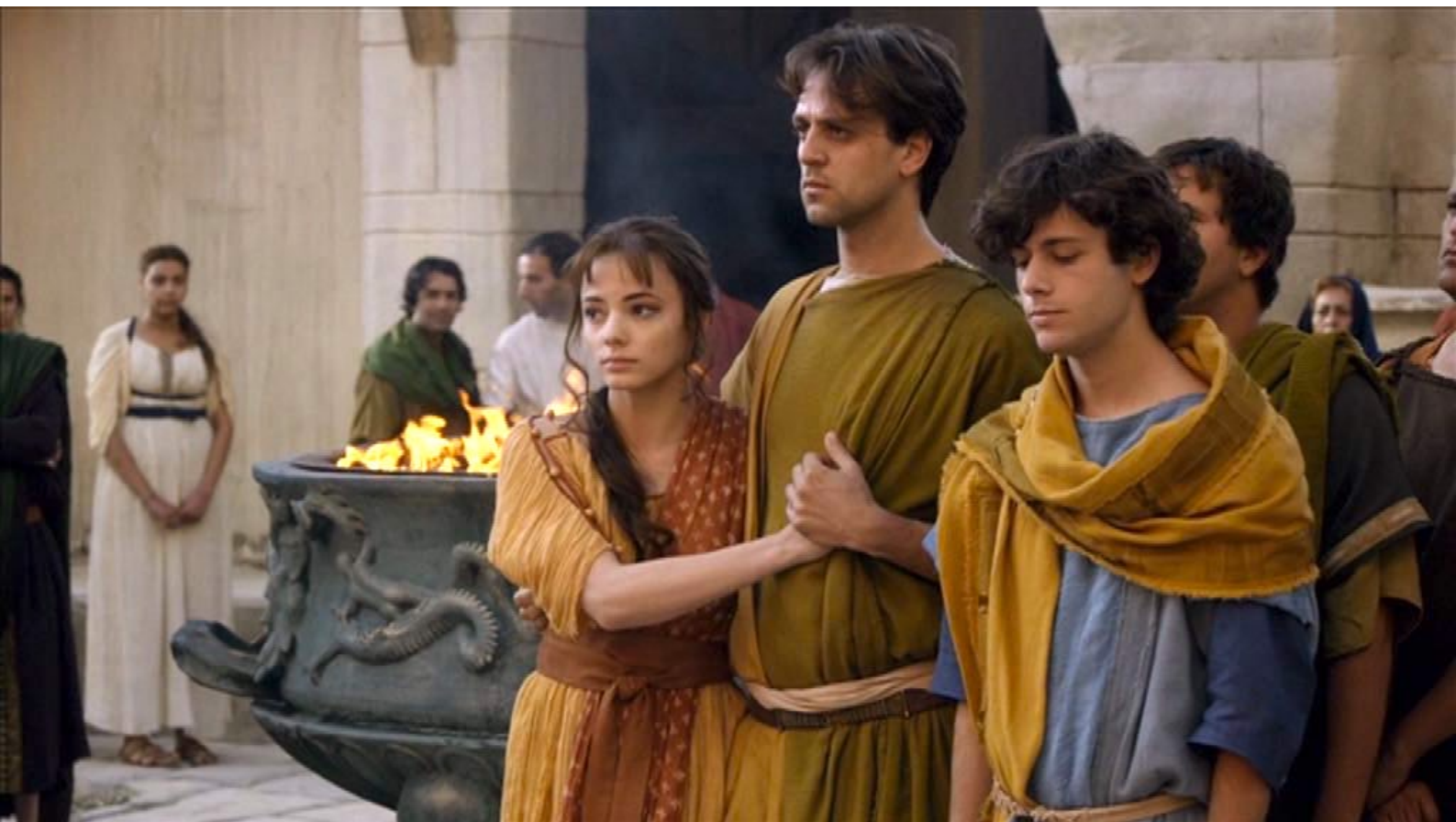
Santa Barbara : les chrétiens refusent...