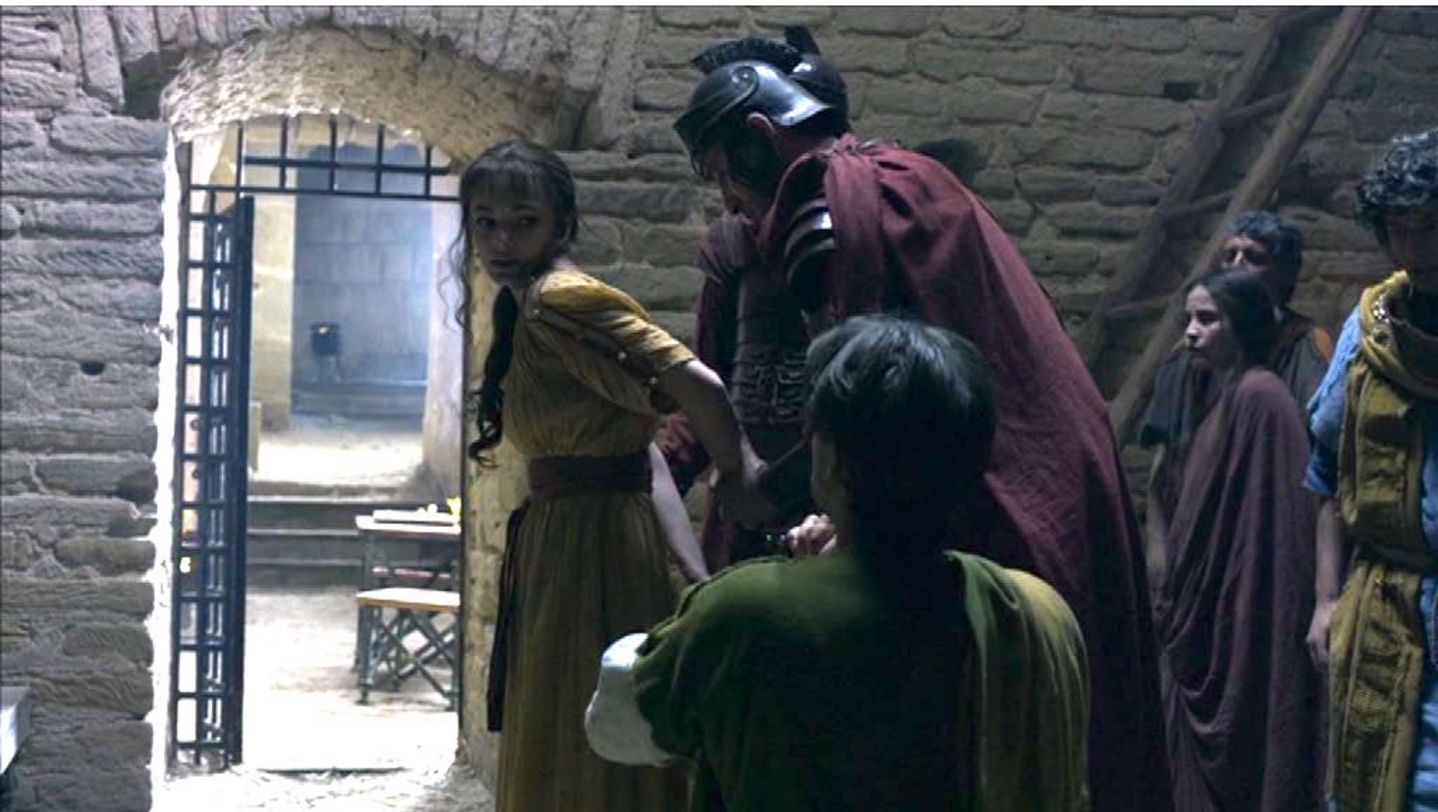
Santa Barbara : ... et fait emmener Julienne au supplice,