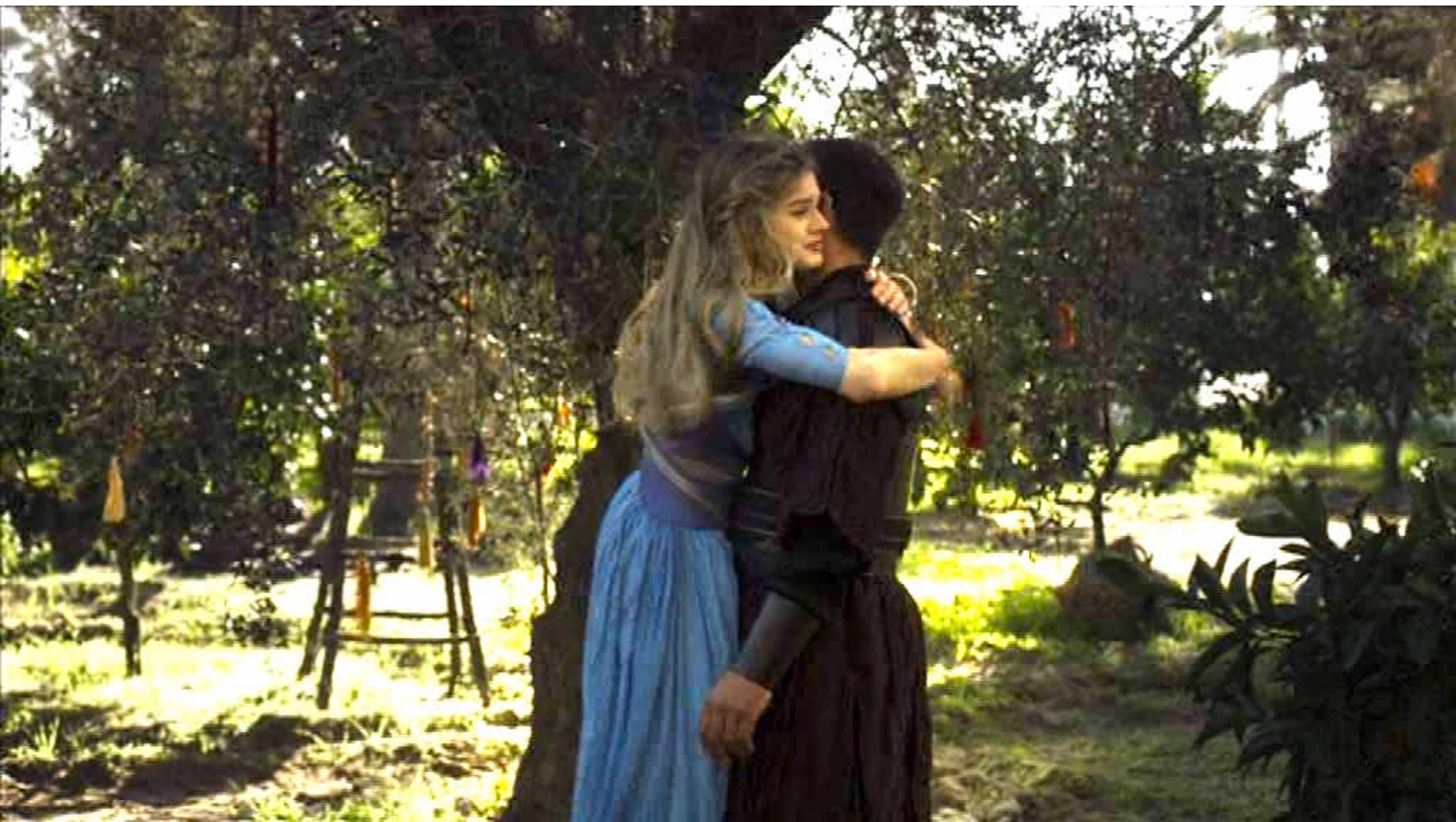
Santa Barbara : ... se lève et, pour la première fois, tombe dans les bras du bel officier.