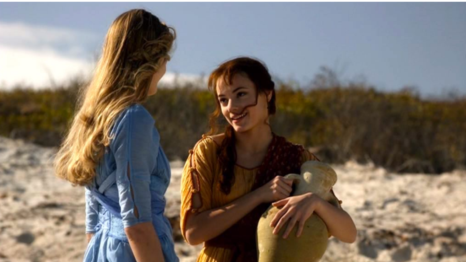
Santa Barbara : ... qui l'accompagne à la plage,