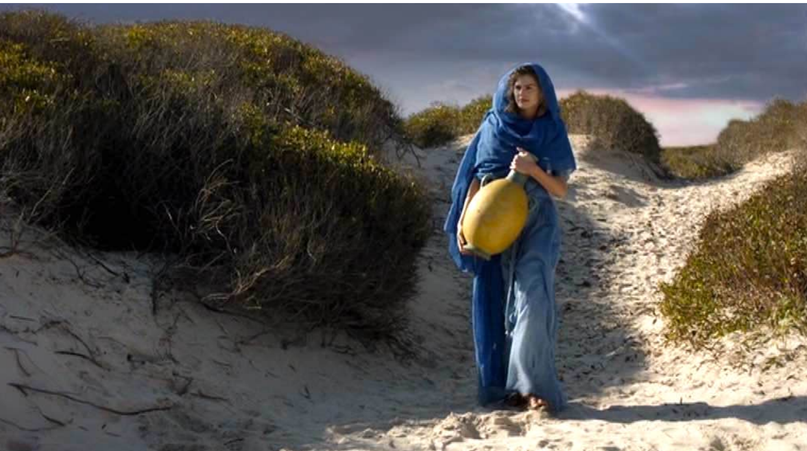
Santa Barbara : ... elle la lui prend des mains et rentre en direction de chez elle.