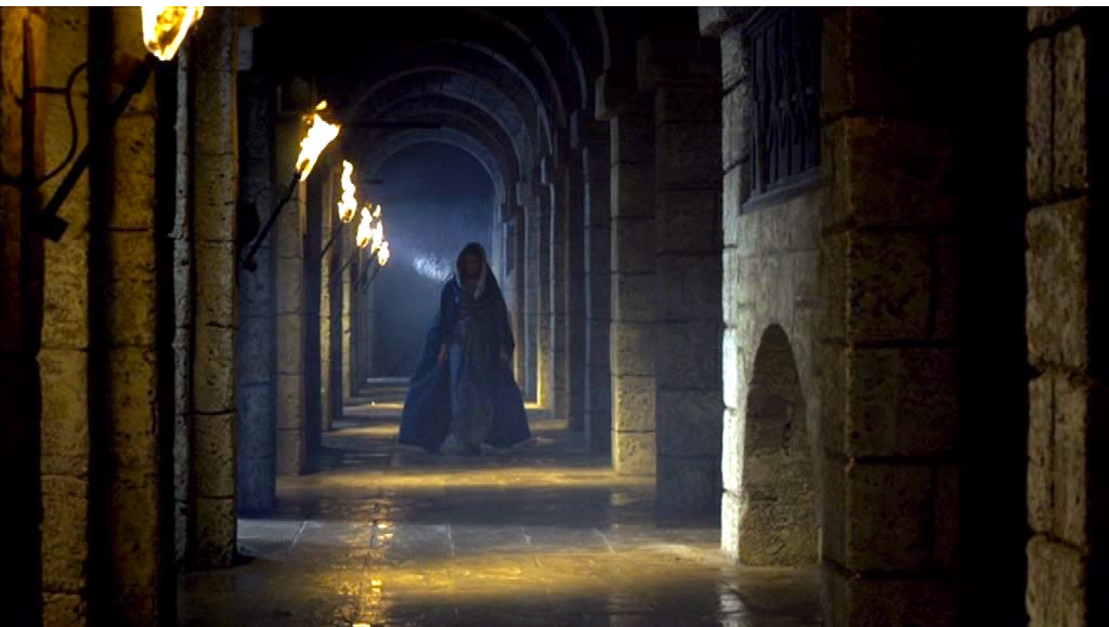
Santa Barbara : C'est pourquoi Barbara va apporter de la nourriture à ses amis prisonniers...