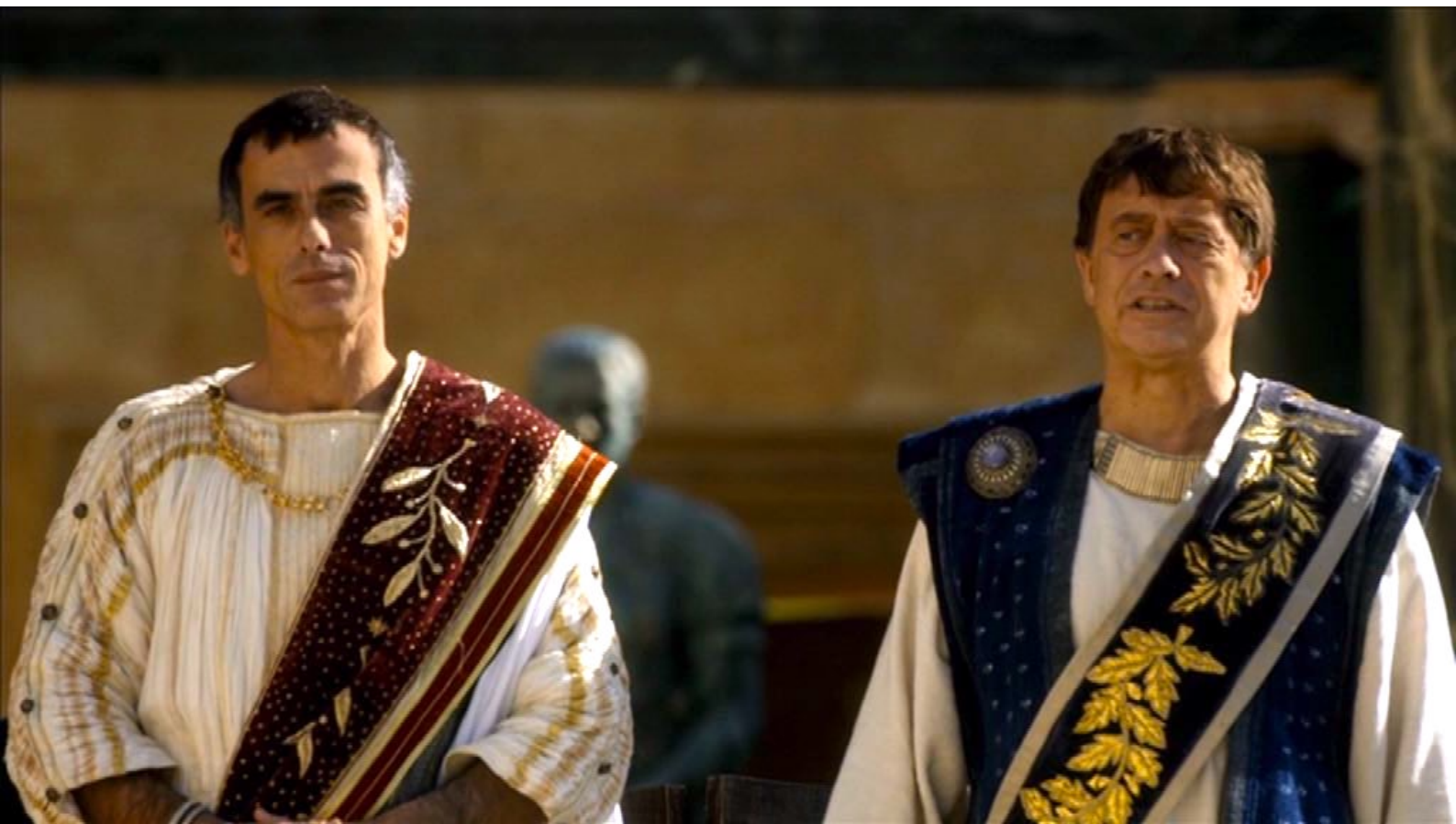
Santa Barbara : Cependant, Marcianus et Dioscore exigent...