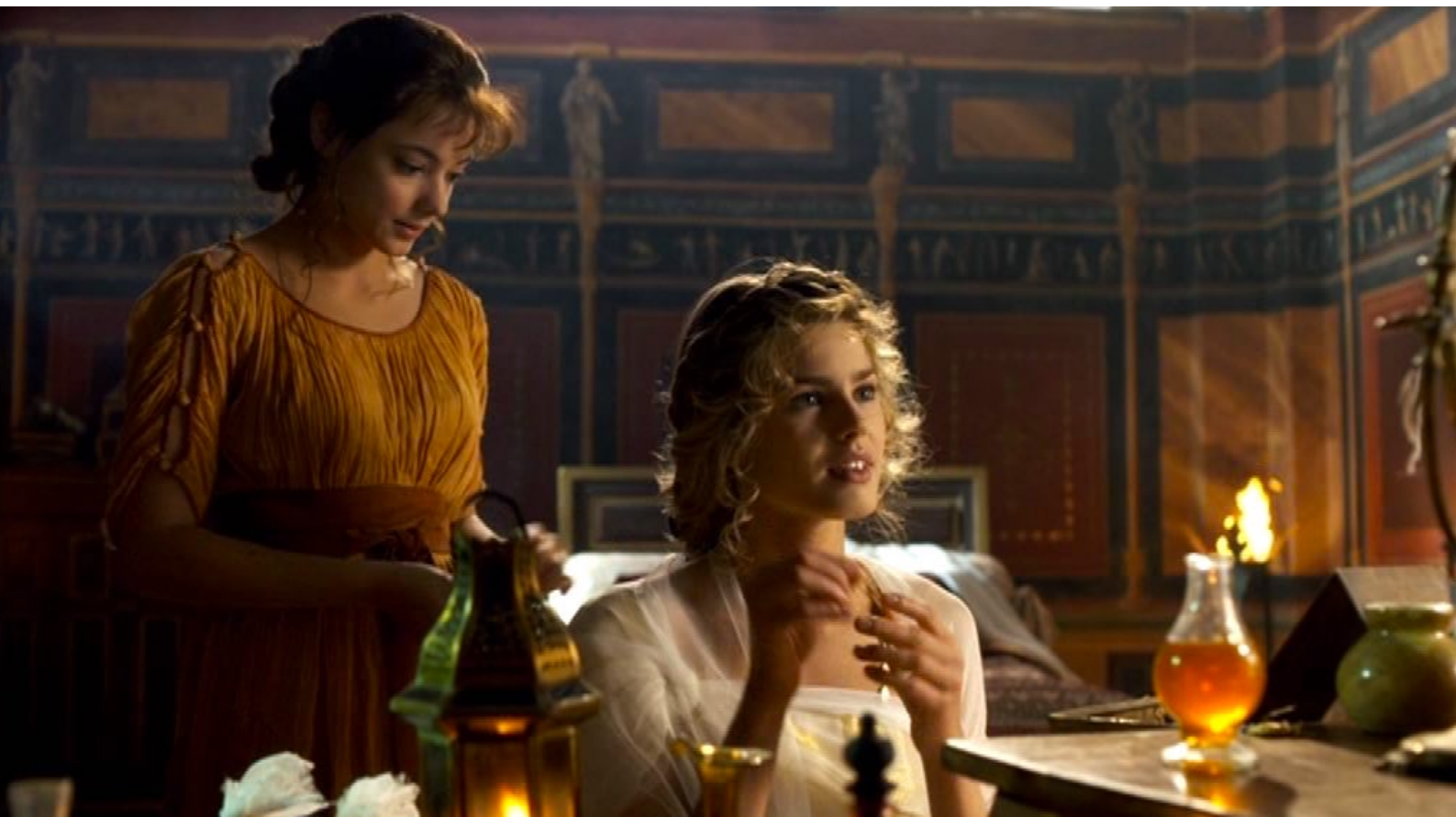
Santa Barbara : ... et se faire aider à sa toilette par son esclave et amie Julienne,