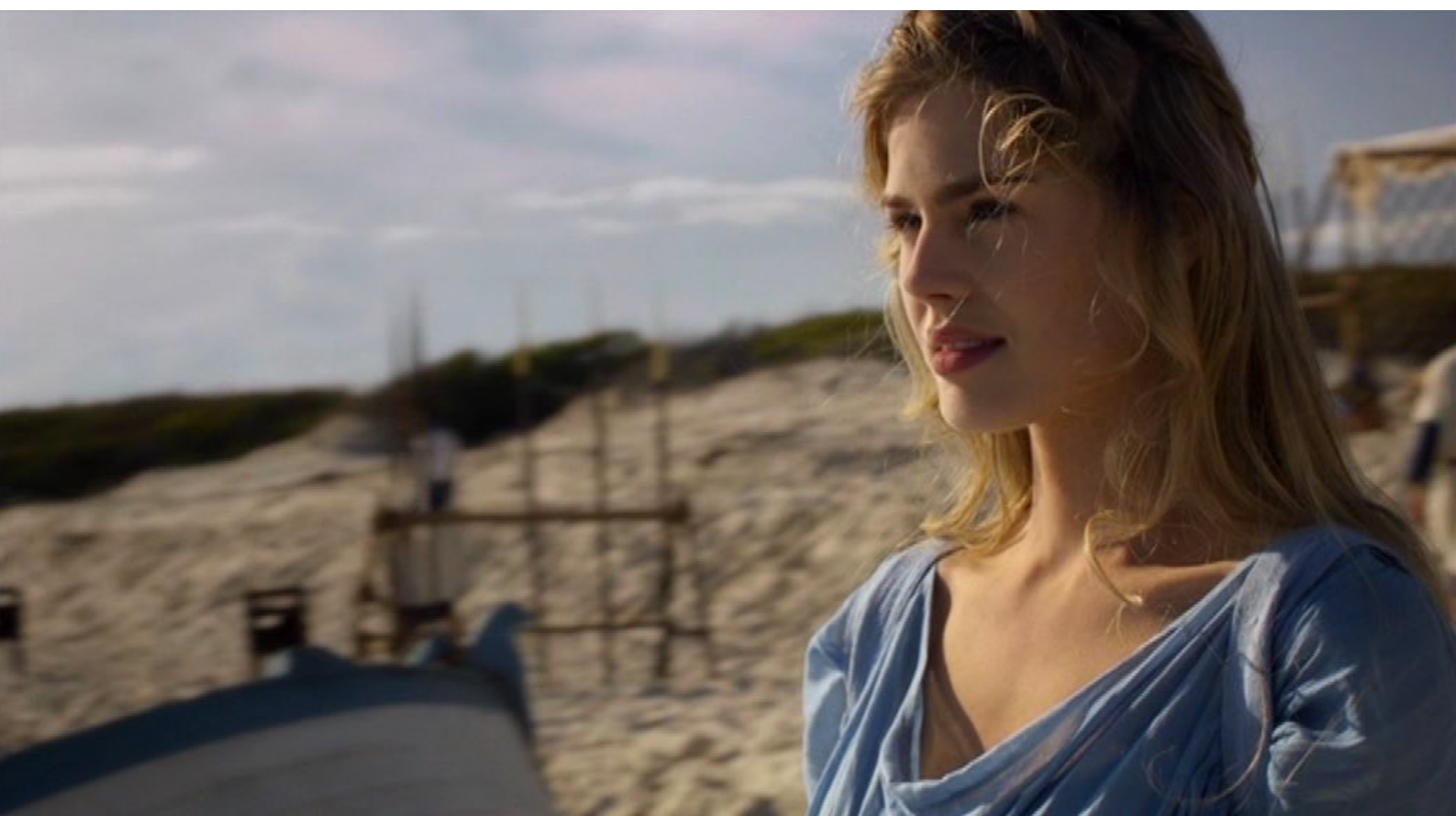
Santa Barbara : ... où Barbara supervise...