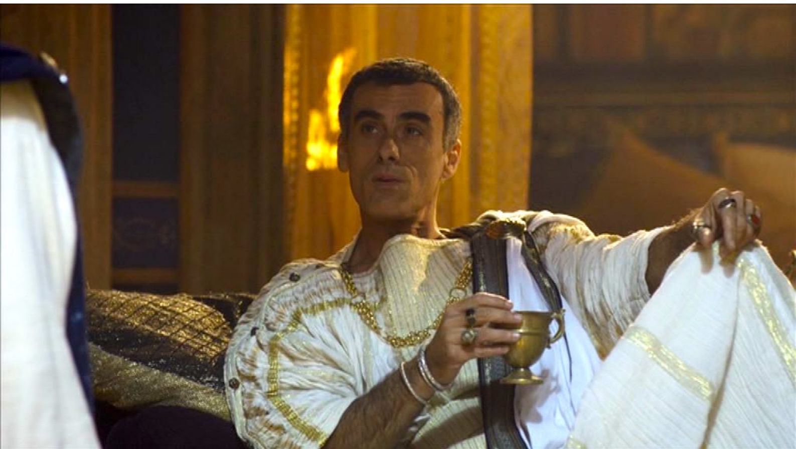
Santa Barbara : En outre, il voudrait épouser Barbara, qui refuse,