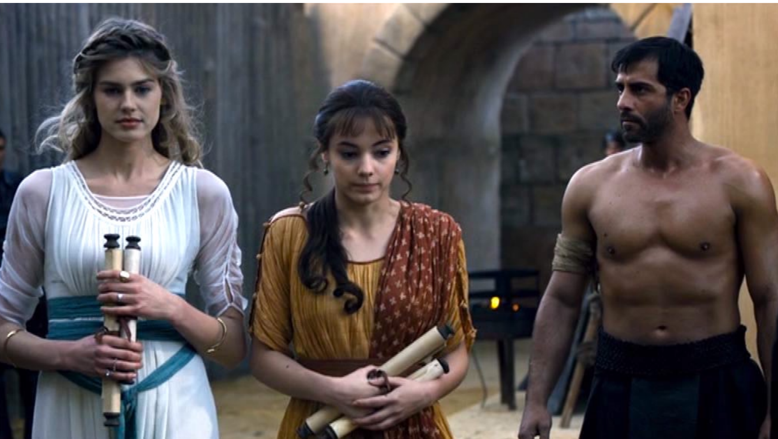
Santa Barbara : Barbara a beau feindre l'indifférence pour l'officier Claudius,