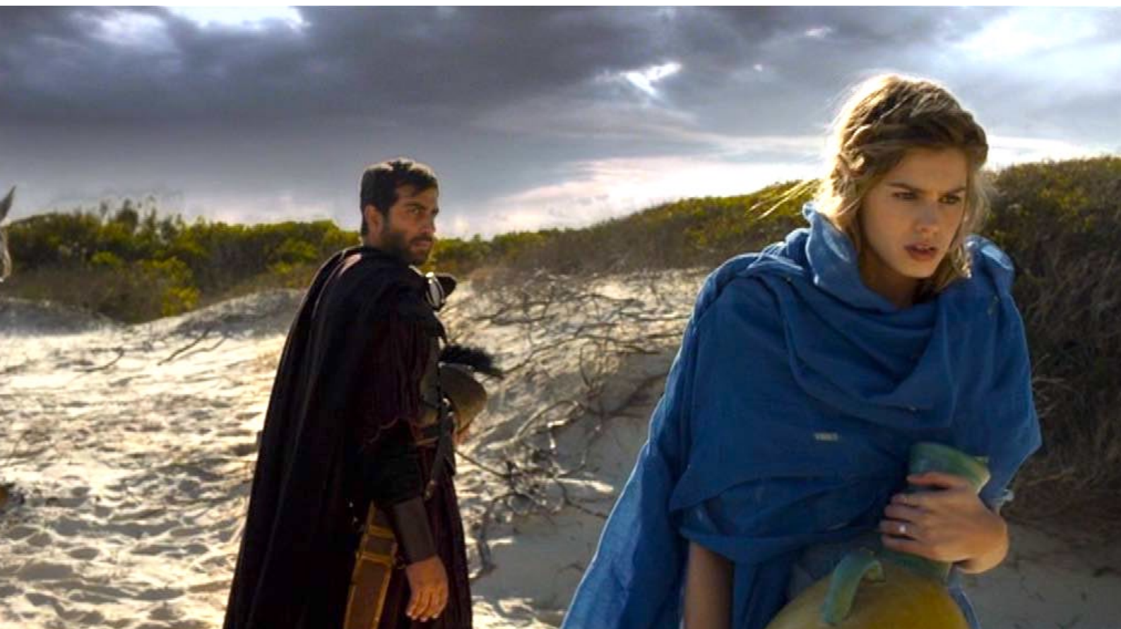
Santa Barbara : Effrayée, Barbara s'enfuit,