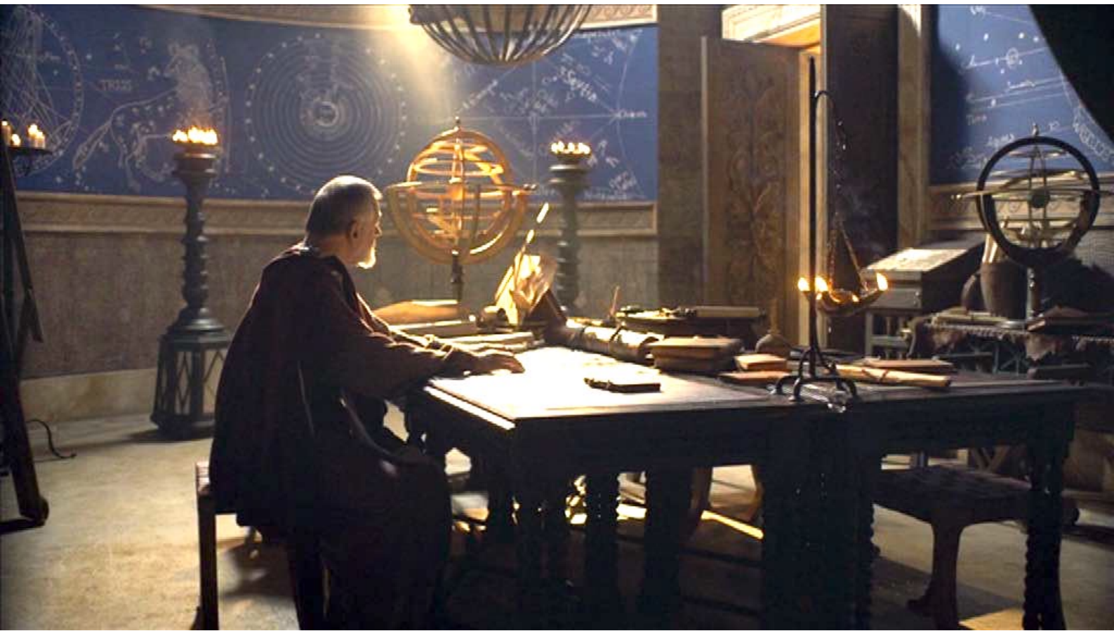
Santa Barbara : Puis, comme Polycarpe travaille dans son école,