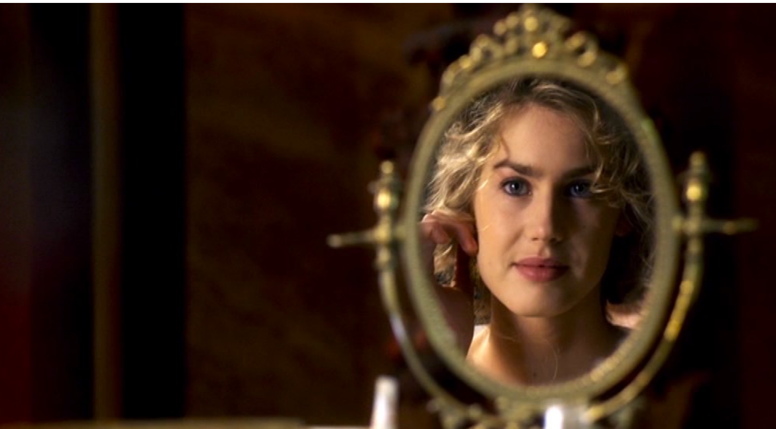
Santa Barbara : La belle et coquette Barbara aime se contempler dans un miroir...