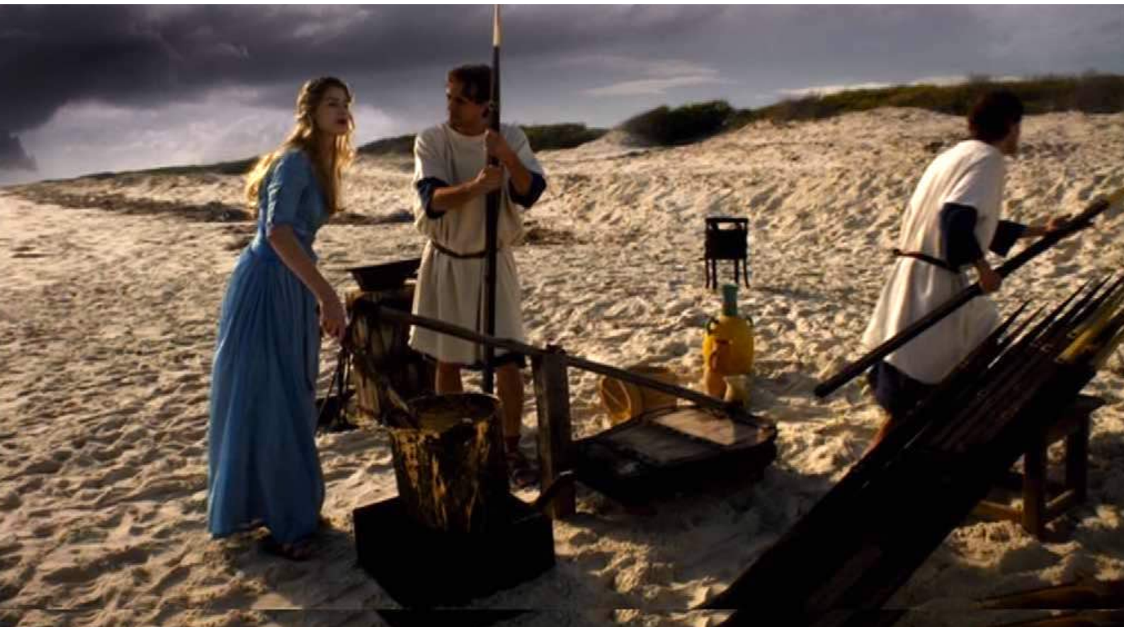
Santa Barbara : ...le travail de ses serviteurs pêcheurs.