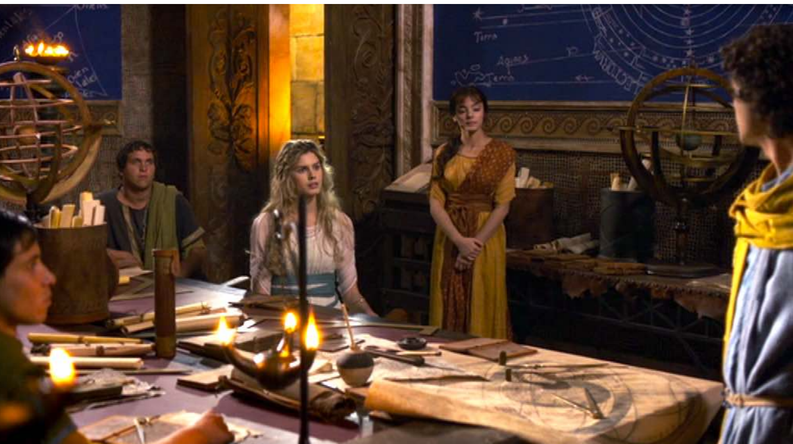
Santa Barbara : Quant à Barbara, elle suit des cours d'astronomie...