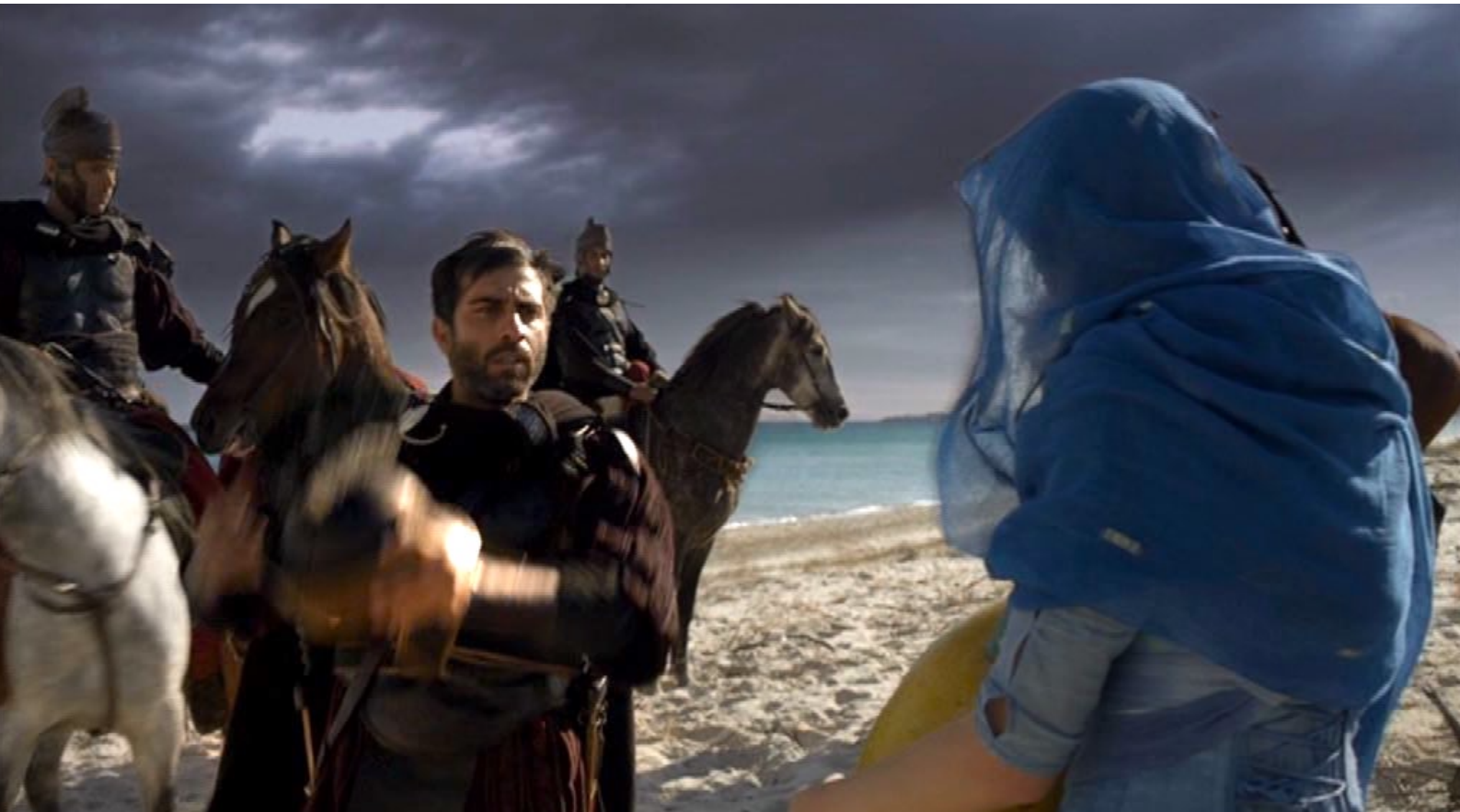
Santa Barbara : ... qui descend de cheval et lui demande de l'eau en la prenant pour une esclave.