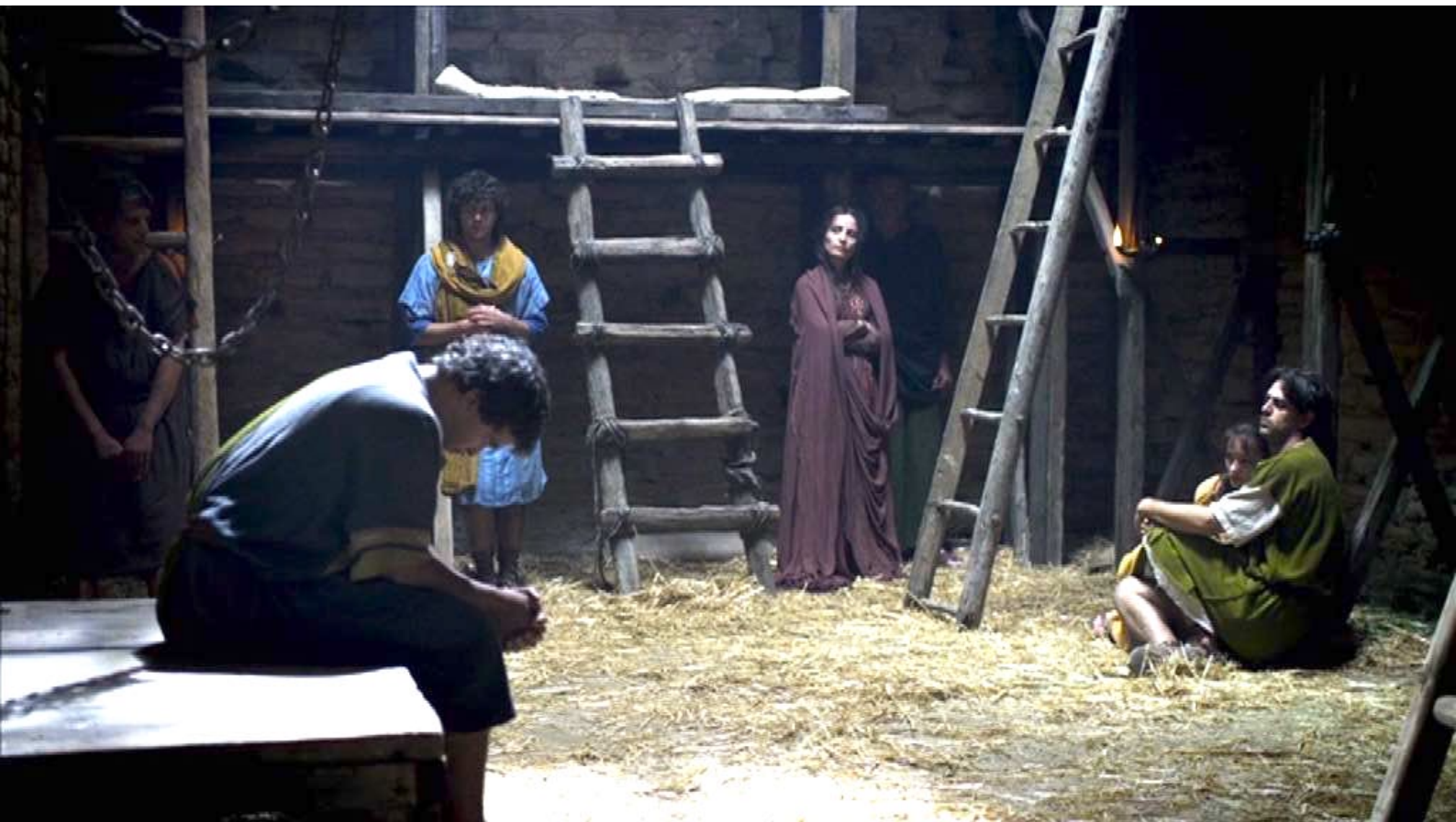
Santa Barbara : Alors, ils sont jetés en prison.