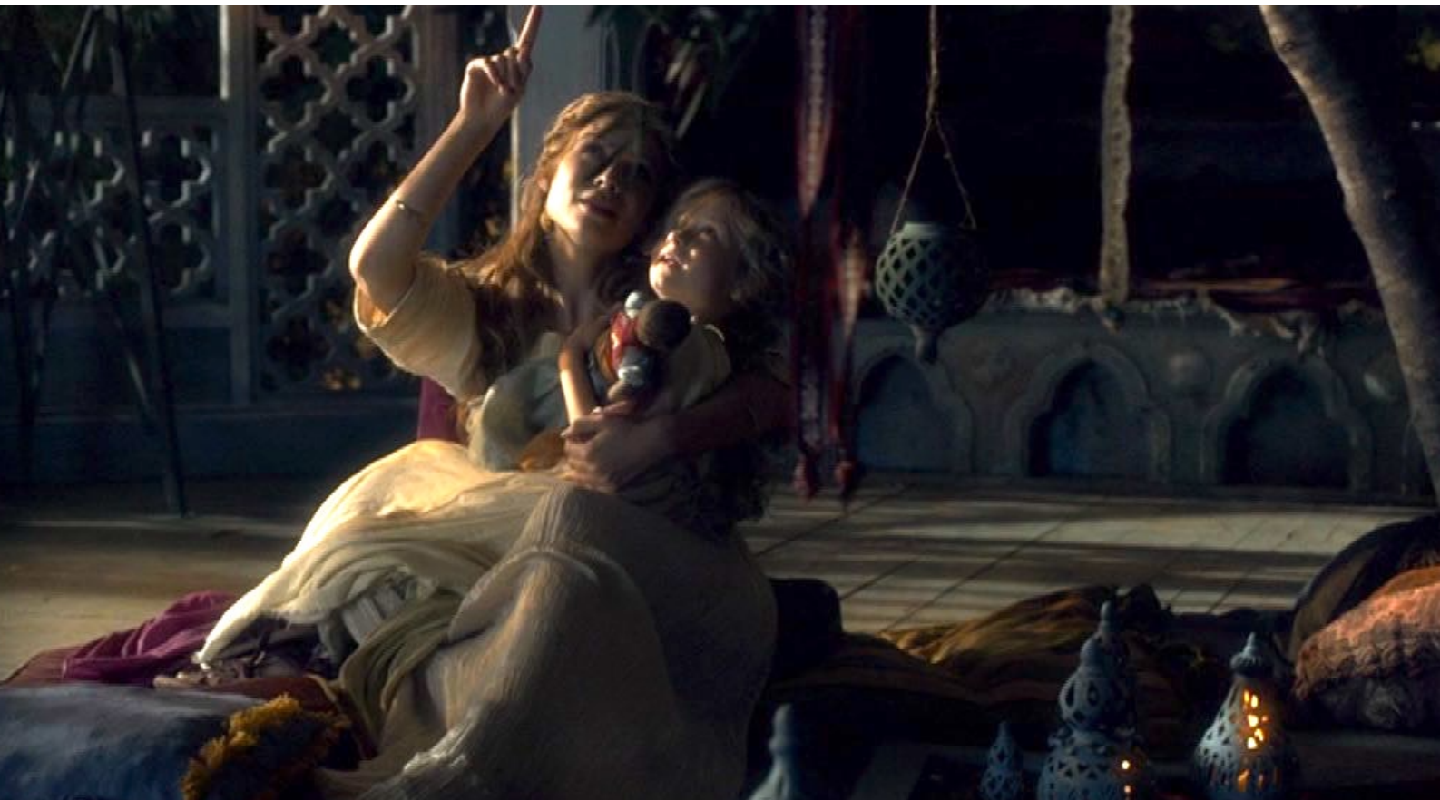
Santa Barbara : Quand Barbara était petite, sa mère lui montrait les étoiles.

Comme premier portfolio du numéro 48 de La 12 e Heure , nous vous offrons dans la présente annexe un petit florilège de photos tirées de la première partie du film Santa Barbara de Carmine Elia, dont nous avons parlé dans notre rubrique "Nouvelles Acquisitions".