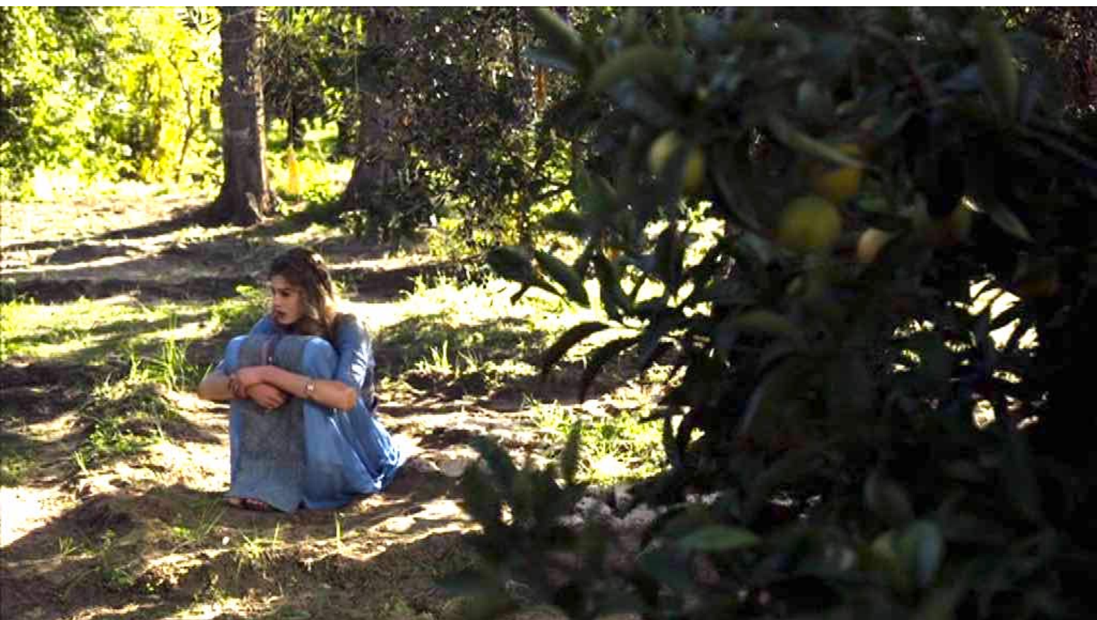
Santa Barbara : Pour toutes ces raisons, elle est déprimée.