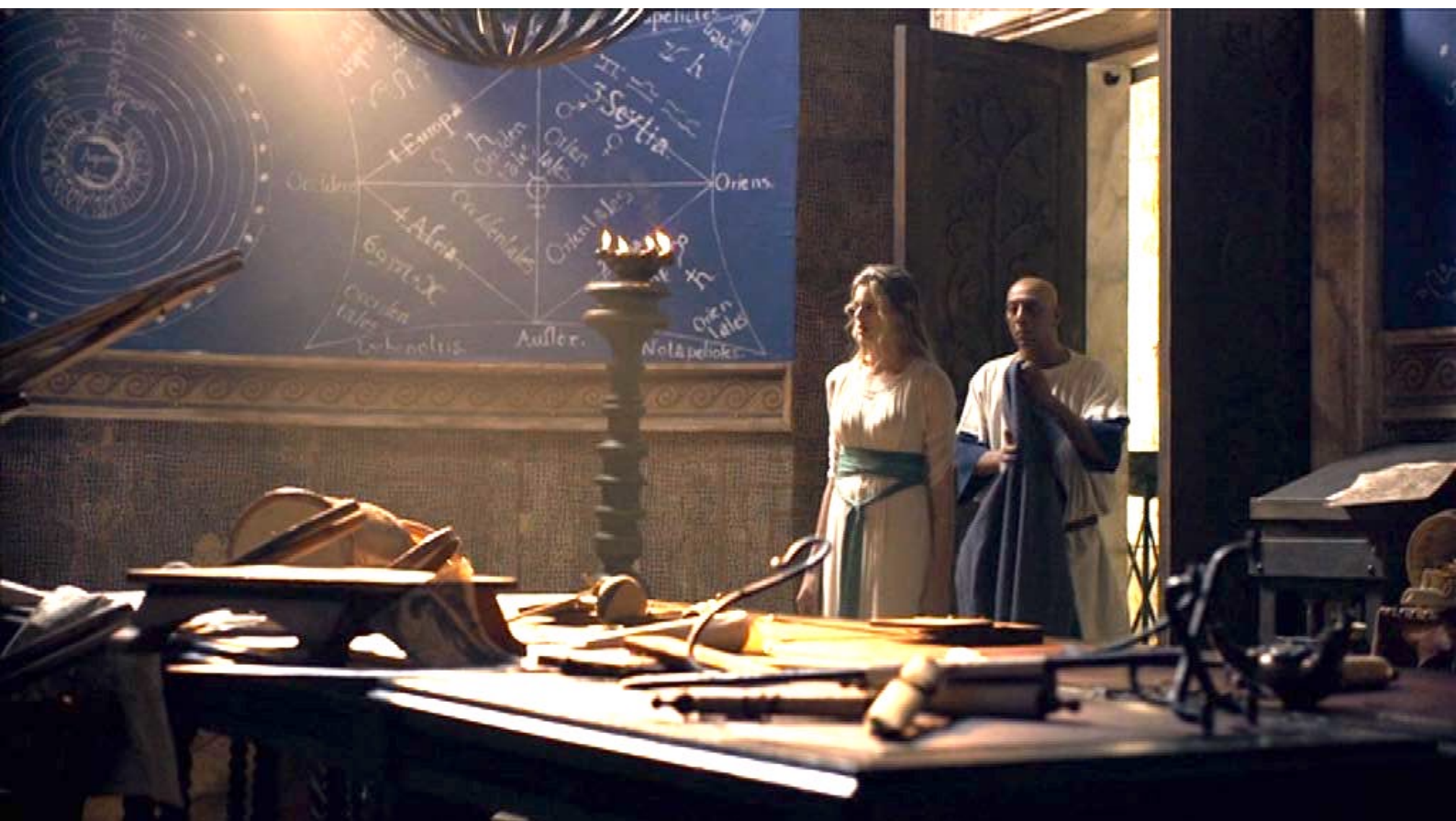
Santa Barbara : De colère, Marcianus fait ravager l'école de Policarpe.