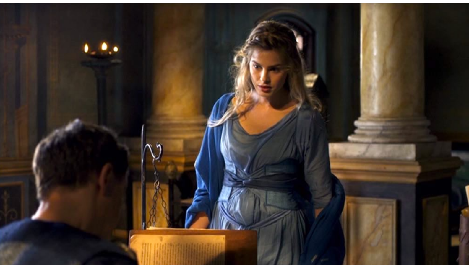
Santa Barbara : ... et se réfugie auprès de son père.