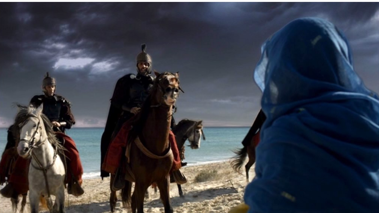
Santa Barbara : En chemin, elle rencontre l'officier Claudius...