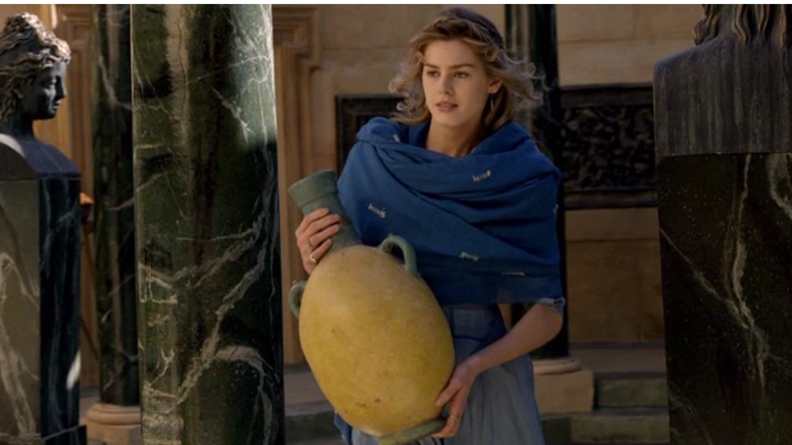
Santa Barbara : rentre chez elle ...