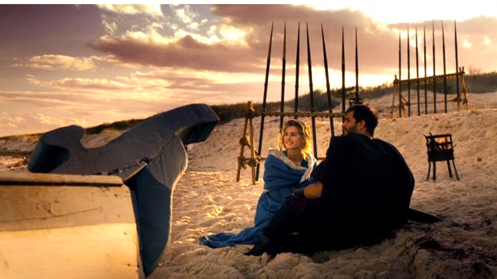
Santa Barbara : ... elle aime s'entretenir avec lui,