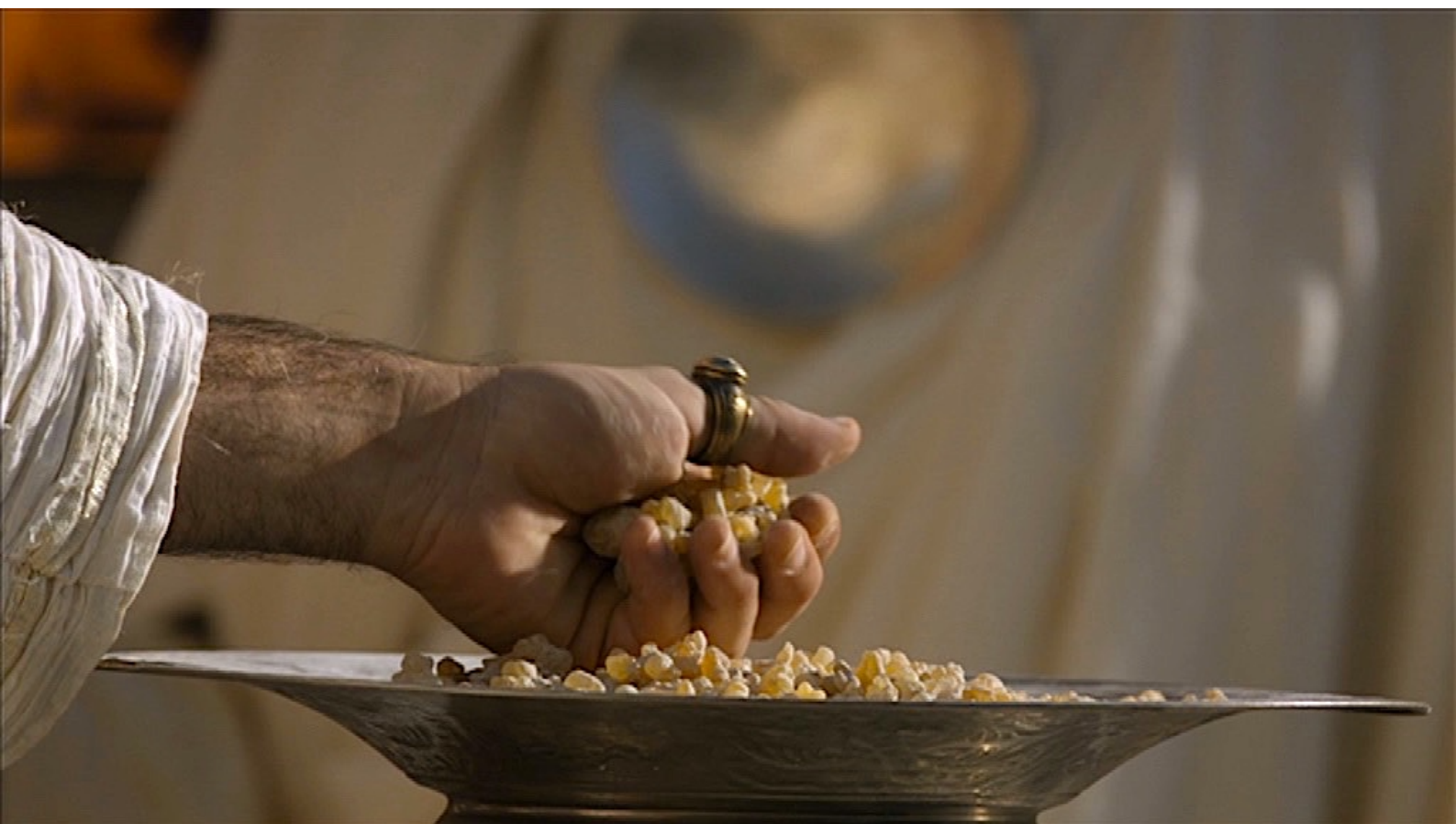
Santa Barbara : ... brûler des grains d'encens afin de reconnaître la nature divine de l'empereur.