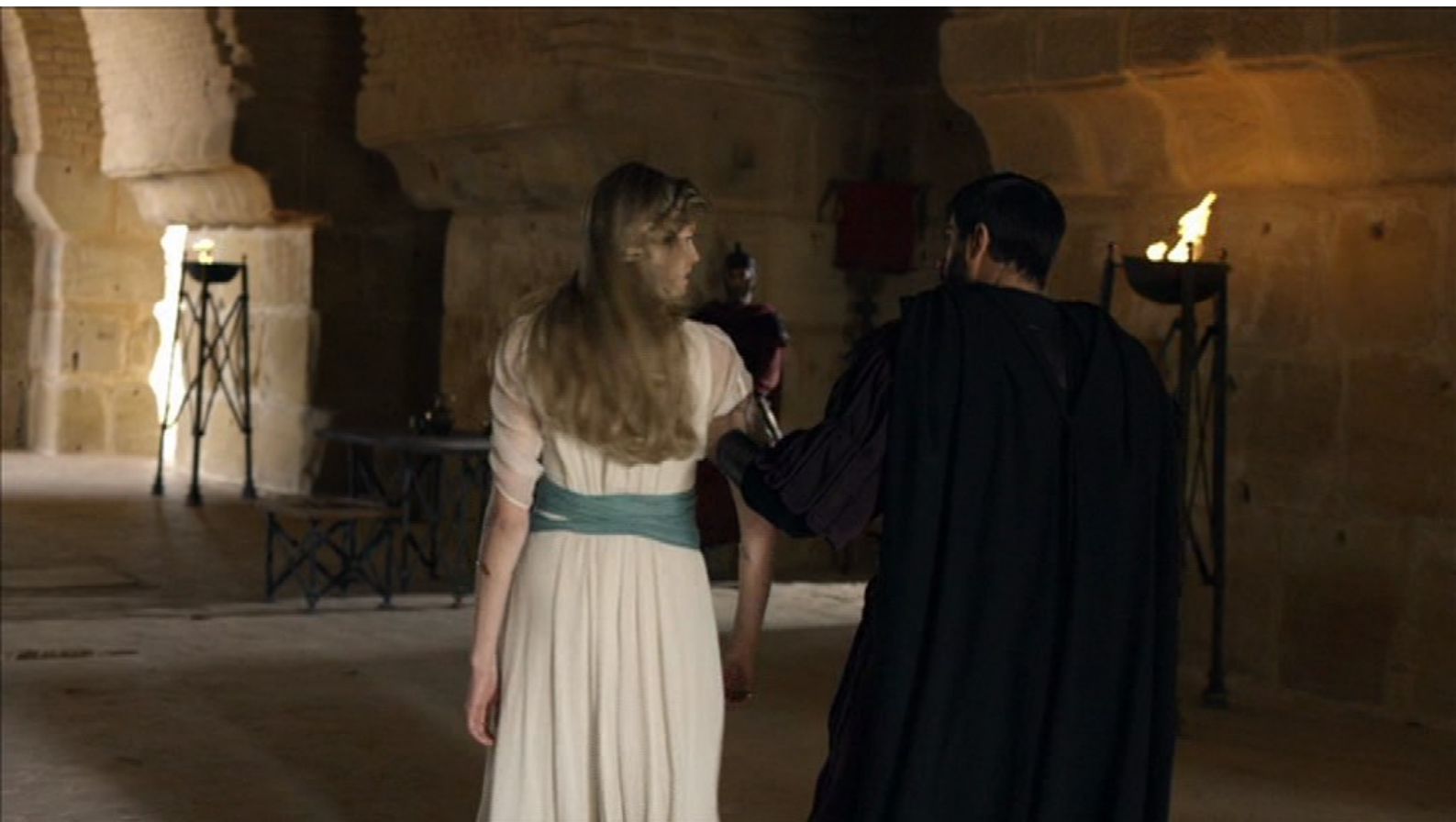
Santa Barbara : Alors, comme Barbara défend encore Julienne, Marcianus la fait jeter en prison...